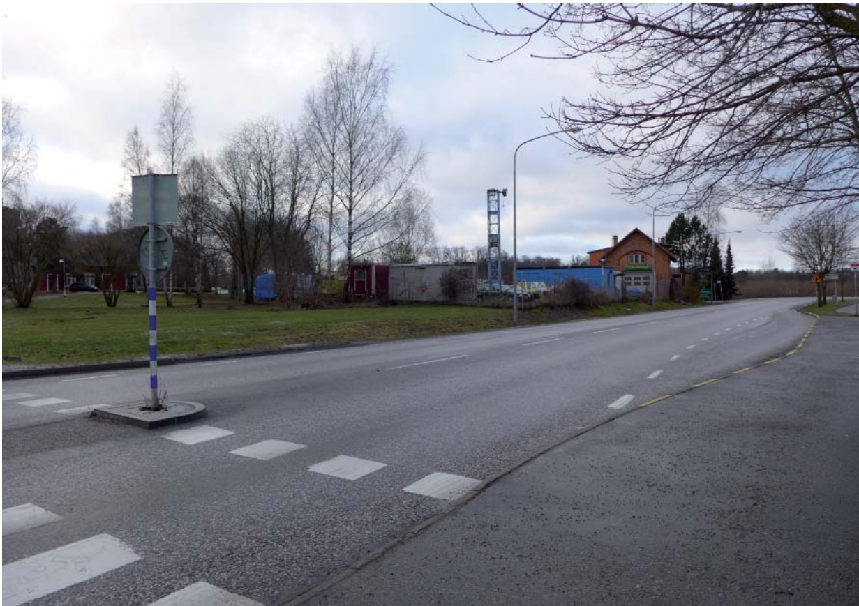
Lövstavägen. Det f.d. lokstallet vid infarten till Riddersvik till höger i bild.