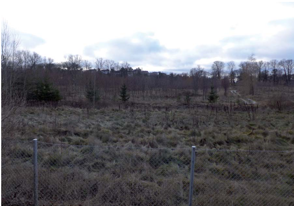
Trädskolans f.d. område sett från Löfstavägen. I fonden ses Riddersviks alléer och Hässelby villastads bebyggelse uppe på en höjd. Nedan hästhagar på tidigare jordbruksmark i anslutning till ladugården.