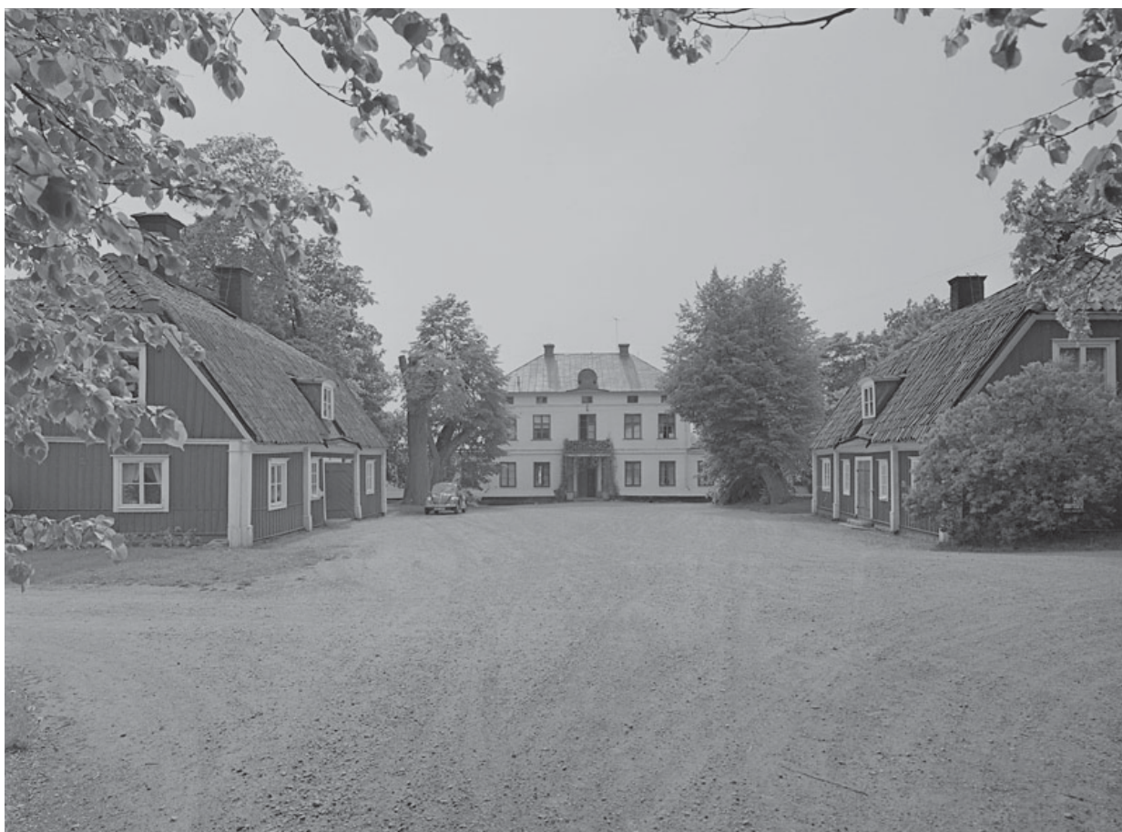
Riddersvik huvudbyggnad och flygelbyggnader.

Uthus: Uppfört 1872. Ursprungligen bl.a. stall, ladugård och vagnshus. 1917 ändrat till uthus med förråd. Långsträckt enplansbyggnad. Sadeltak med tvåkupigt lertegel, fasad av stående locklistpanel, målad faluröd.