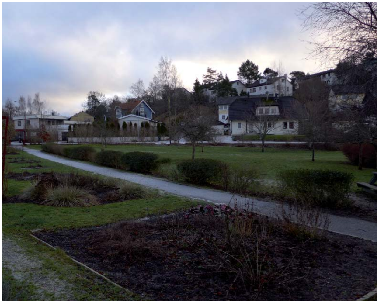
Parkområdet söder om Riddersviks infartsallé framför norra randen av den södra delen av Hässelby villastad.