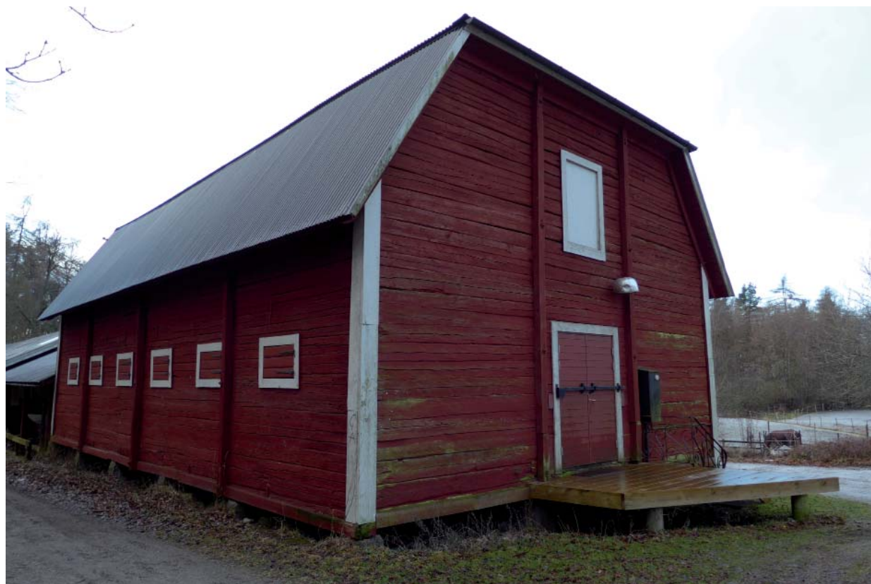
Det magasin som på 1890-talet flyttats till gården från Lövsta by.