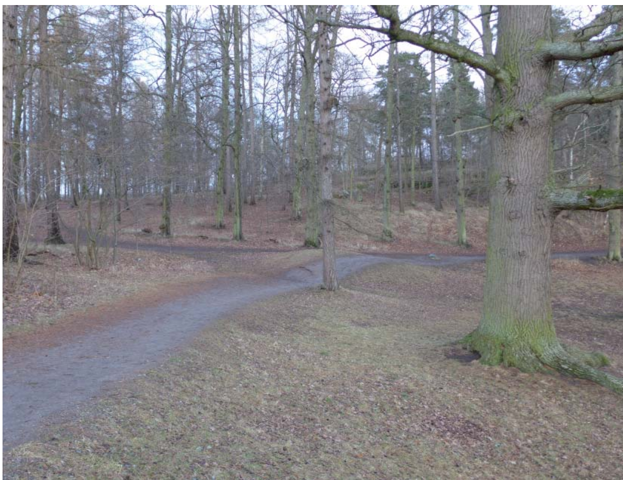
Den engelska parkens system av gångar är i huvudsak ursprungligt.