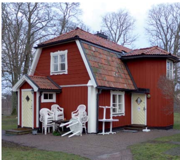
Trädgårdsmästarebostället idag, samma byggnad som torpet ovan.