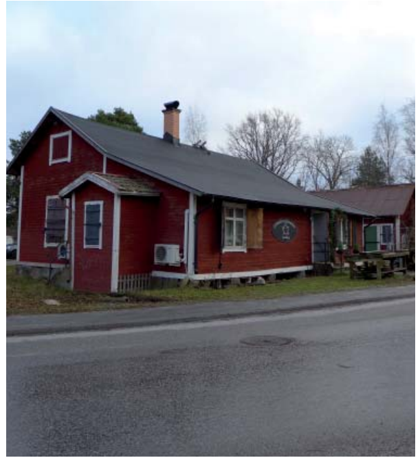
Den tidigare livsmedelsbutiken vid Riddersviksvägen.

I de glest bebyggda kvarteren mellan Riddersviksvägen och Lövestavägen finns det f.d. lokstallet i tegel och den låga, rödmålade träbyggnad som tidigare rymde områdets handelsbod. I synnerhet lokstallet står som en entrébyggnad till Riddersvik vid Lövestavägen.