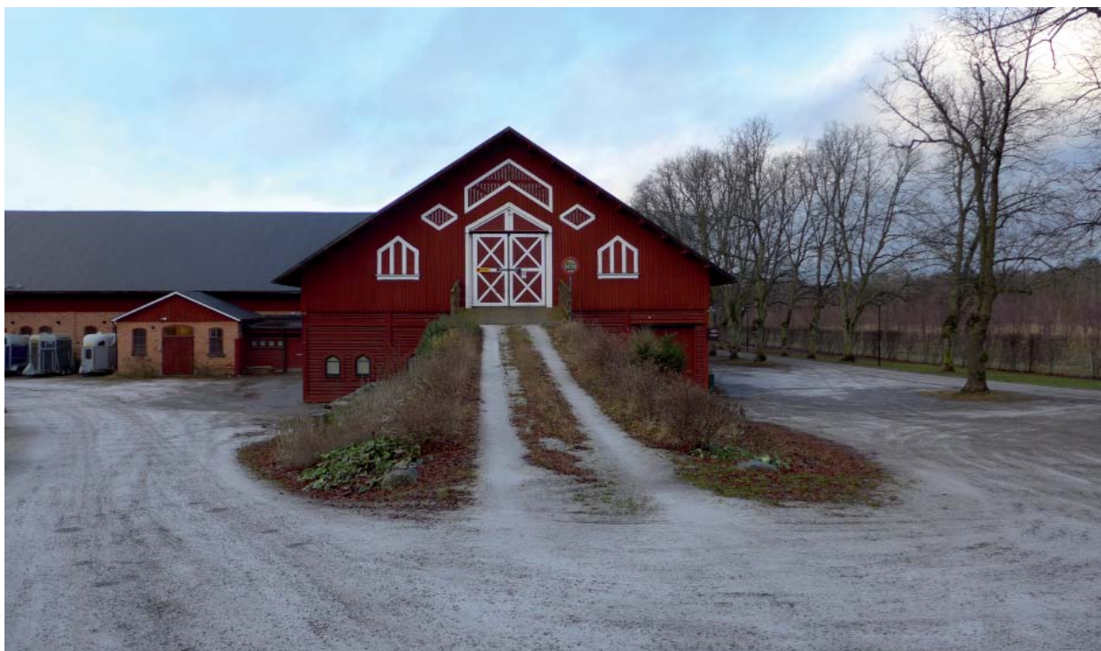
Ladugården med Riddersviks gårdsväg till höger i bild.