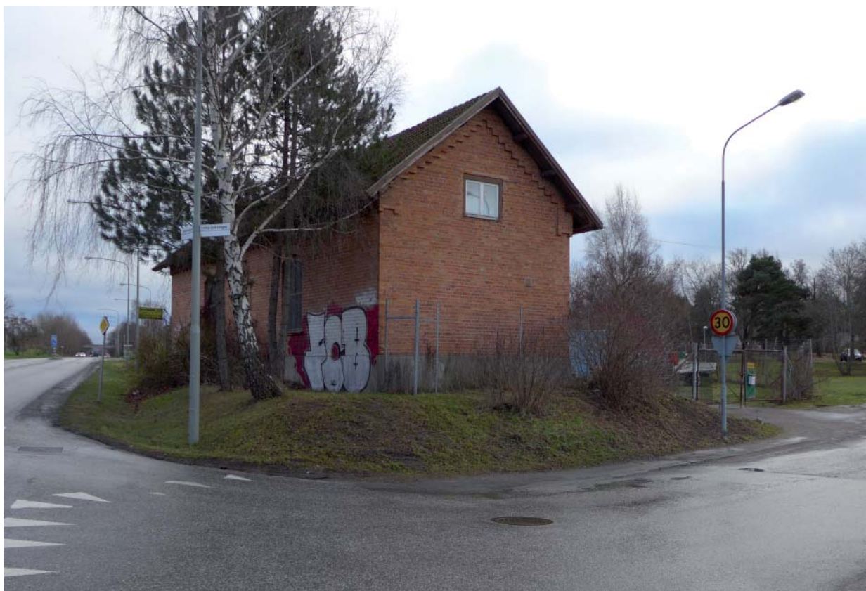
Det tidigare lokstallet som står i korsningen Lövstavägen-Riddersviksvägen och utgör informell entrébyggnad till Riddersvik.