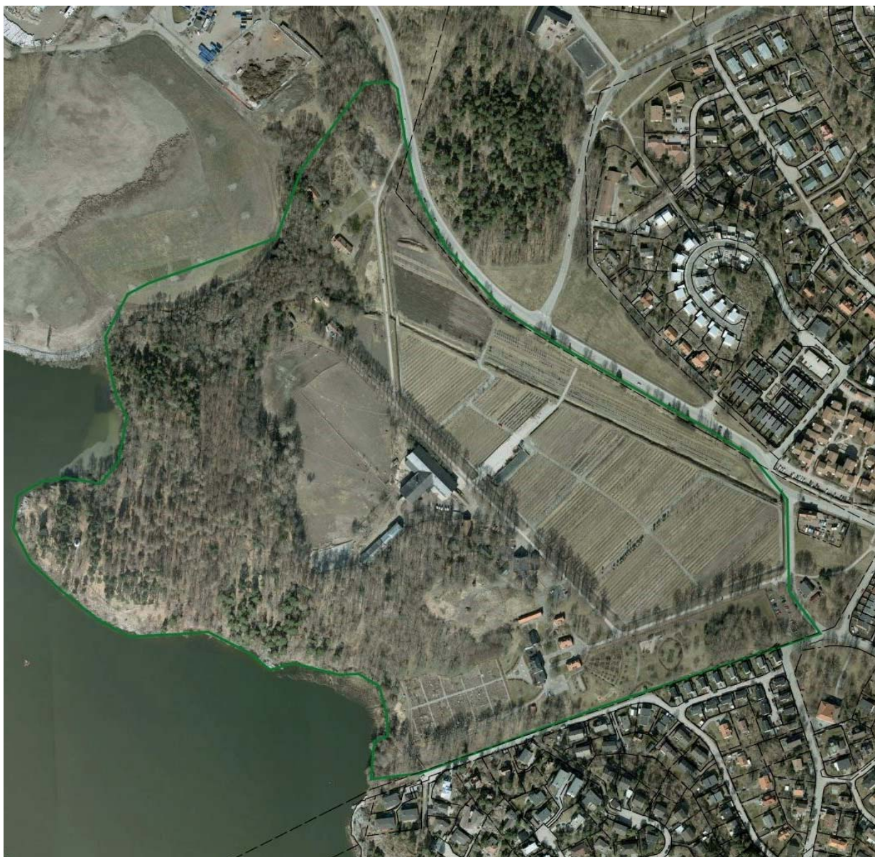
Stockholms stadsmuseums klassificering av Riddersvik. Grön linje markerar gräns för kulturhistoriskt värdefullt område. Klassificeringskarta på ortofoto 2009. Stockholms stadsmuseum.