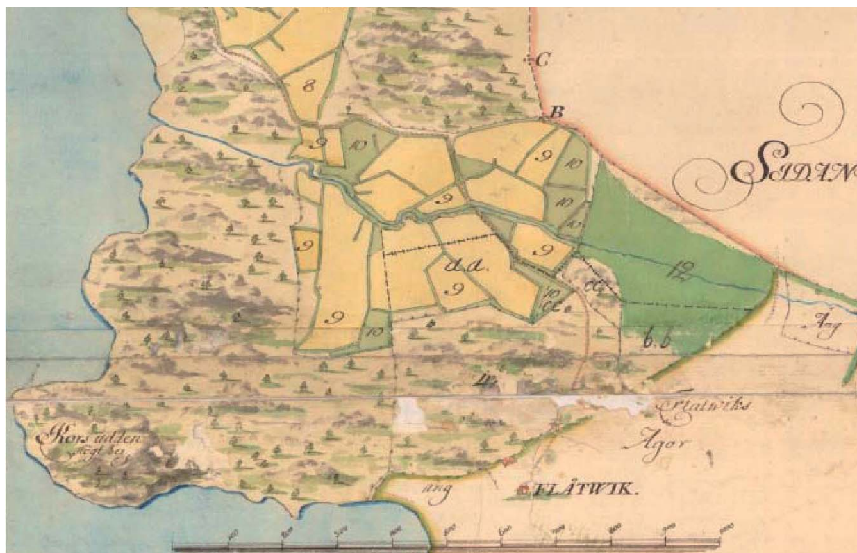
Utsnitt ur ägokarta över Lövsby 1752. Torpet Flätwik, ungefär på platsen för Riddersviks nuvarande huvudbyggnad, är friköpt och ligger utanför byns ägor. Lantmäteriverkets arkiv. Ur Topia 2008.