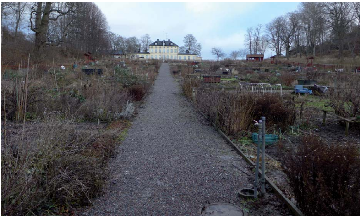
Koloniträdgårdar på trädgårdsmarken mot Mälaren. Herrgården i fonden.