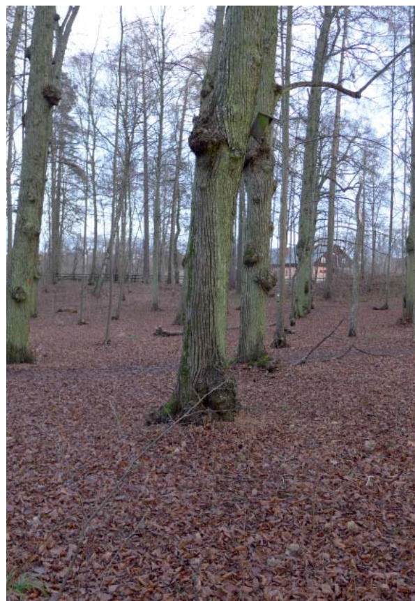
Ovan "Stjärnparkens" raka rader av lind.

Alléerna anlades sannolikt decennierna runt 1800, möjligen redan på 1760-talet. De består idag av en stor andel äldre träd, enligt bedömning 2008 planerade på 1700- eller 1800-talet. De domineras av lind.