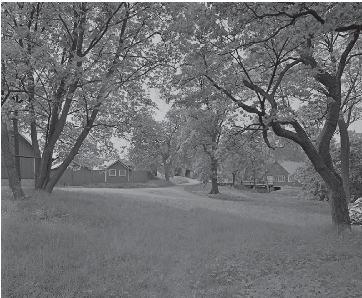
Park vid Riddersvik.

År 2008 gjorde Topia landskapsarkitekter AB en kulturhistorisk värdebeskrivning av Riddersviks trädgårds- och parkanläggning som underlag för eventuell ny detaljplan. Skälet var att dåvarande arrendator av Riddersviks gård önskade uppföra nya byggnader i området. Utredningen 2008 fokuserar på grönstrukturerna med omfattar historik, beskrivning och värdering av hela gårdsanläggningen med bebyggelse, trädgård, park och alléer. Den tidigare jordbruksmarken behandlas delvis. Den kulturhistoriska värderingen fokuserar på trädgårdshistoriska värden. Även möjliga hot mot de identifierade värdena och framtida åtgärder för att bevara Riddersviks kulturhistoriska värde redovisas. Se vidare Topia 2008.