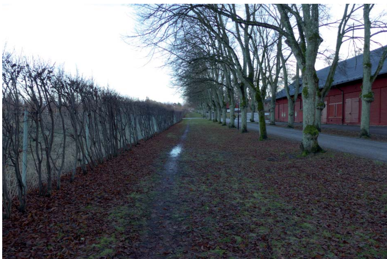
Avståndet idag mellan alléer och staket mot den f.d. plantskolans område. Överst Riddersviks allé, vy mot herrgården i sydväst. Nedan Riddersviks gårdsväg, vy mot sydost.