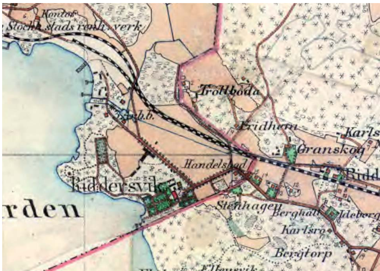
Häradsekonomska karta över Hässelby villastad och Riddersvik, odaterad, sannolikt tidigt 1900-tal. Till höger dåvarande Riddersviks station, i kartans mitt handelsboden. Karta Svartsjö J112-75-13.