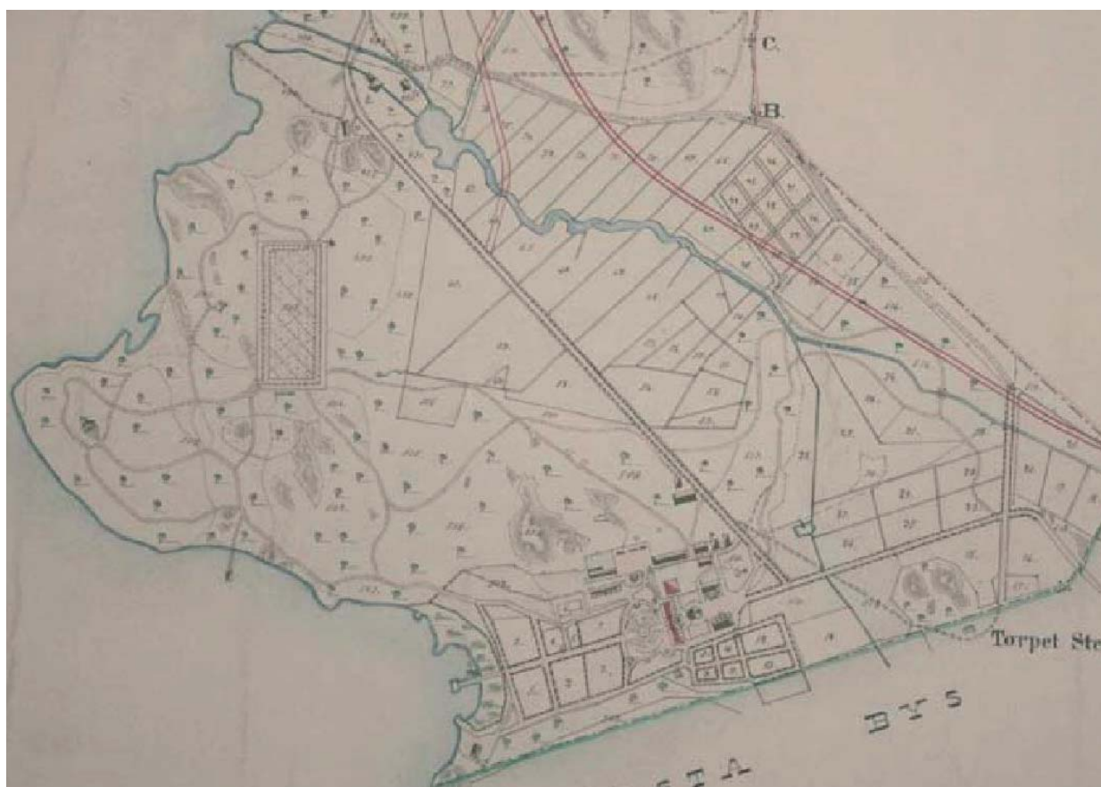
Utsnitt ur ägokarta över Riddersvik 1843. Riddersviks struktur är i huvudsak etablerad så som den är läsbar idag. Stockholms stadsarkiv. Ur Topia 2008.