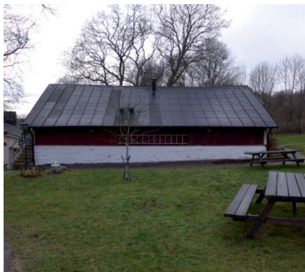
Källarbyggnaden är placerad på en terrass intill huvudbyggnaden.