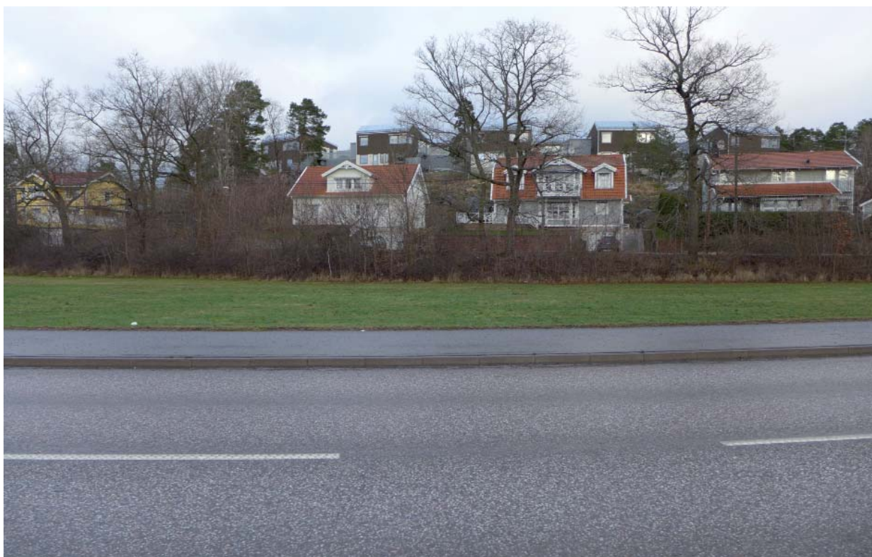
Bebyggelsen i Hässelby villastad mot Lövstavägen. Denna bebyggelse är synlig från Riddersviks alléer.