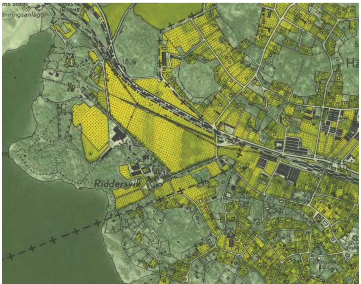
Ekonomisk karta 1951. Hässelby villastad innan 1970-talets omfattande förtätning. Lantmäteriet.

Ingen mark har styckats av från Riddersviks gård till villastadens framväxt. Däremot har delar av gårdens mark arrenderats ut till de boende i villastaden, för trädgårdsodling, med flertalet växthus och odlingsbänkar. Odling har präglat även Riddersvik och det ger en koppling mellan trädgårdsstadens framväxt och gårdens 1900-talshistoria.