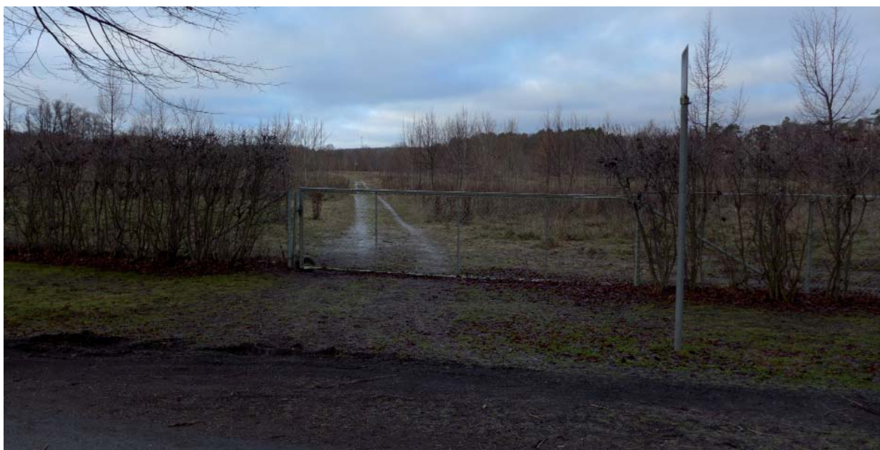
Trädskolans f.d. område med ungträd i raka rader samt en av infarterna till området från Riddersviks gårdsväg.