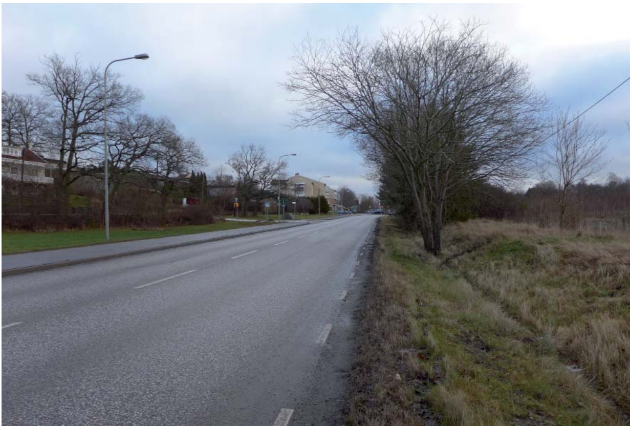
Lövstavägen österut. Villastaden på vänster sida och Riddersviks område till höger.