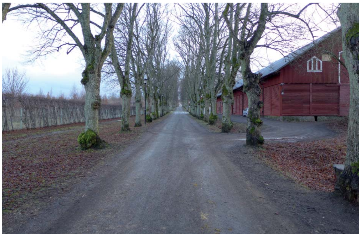
Nedan den västgående allén, vy mot sydost.