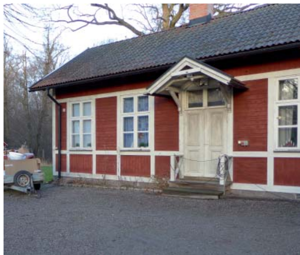
"Slöjdstugan" vid gårdsalléns västra slut.

Allévägarna utgår från gårdsinfarten och strålar ut i nordvästlig respektive nordöstlig riktning. De saknar diken och alléträden står på gräsmatta. Allévägarna är enligt dagens mått för smala för biltrafik men används ändå som körvägar eftersom de utgör enda infarter till herrgården och stallet.