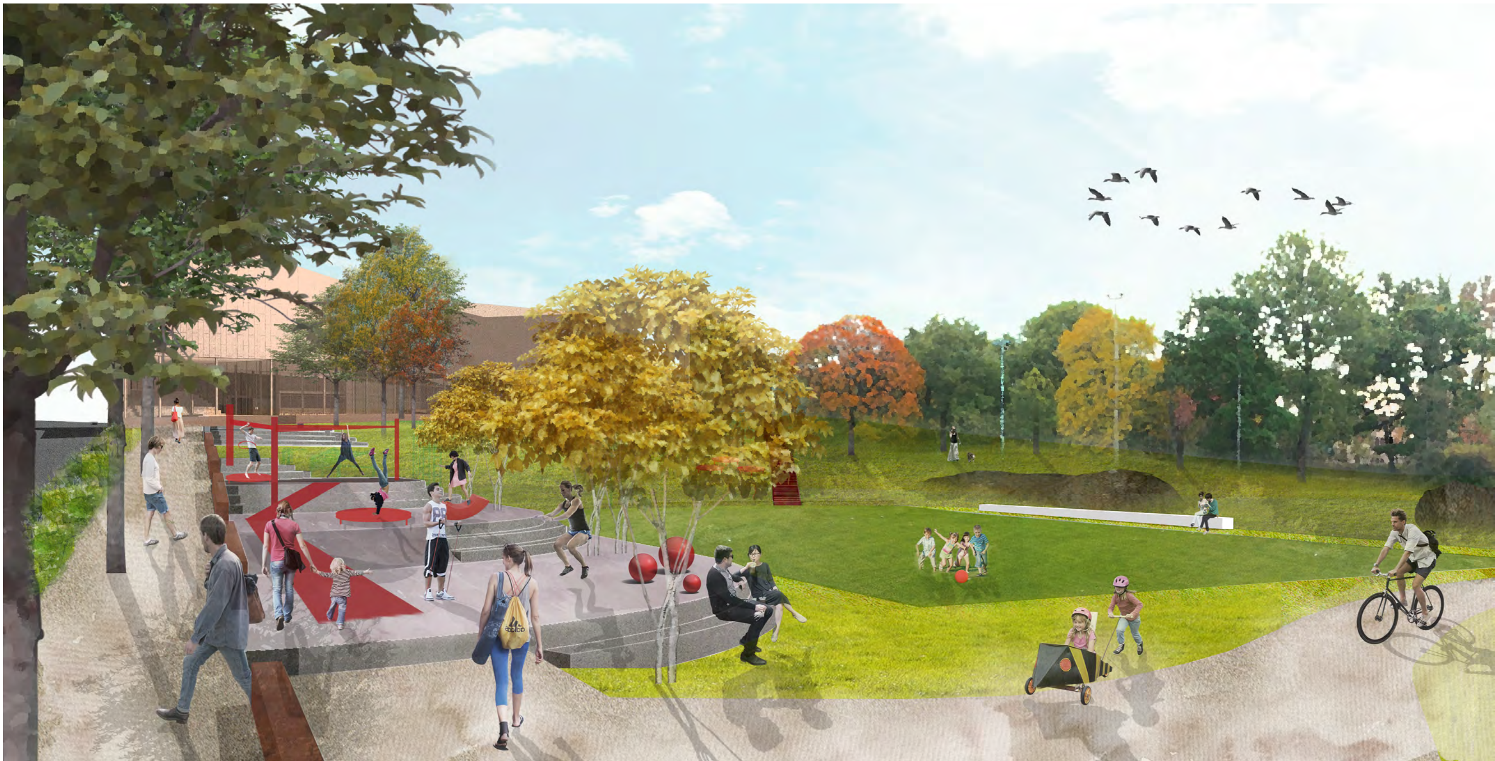
Perspektivbild Idrottsparken och Ekparken, från Elersvägen