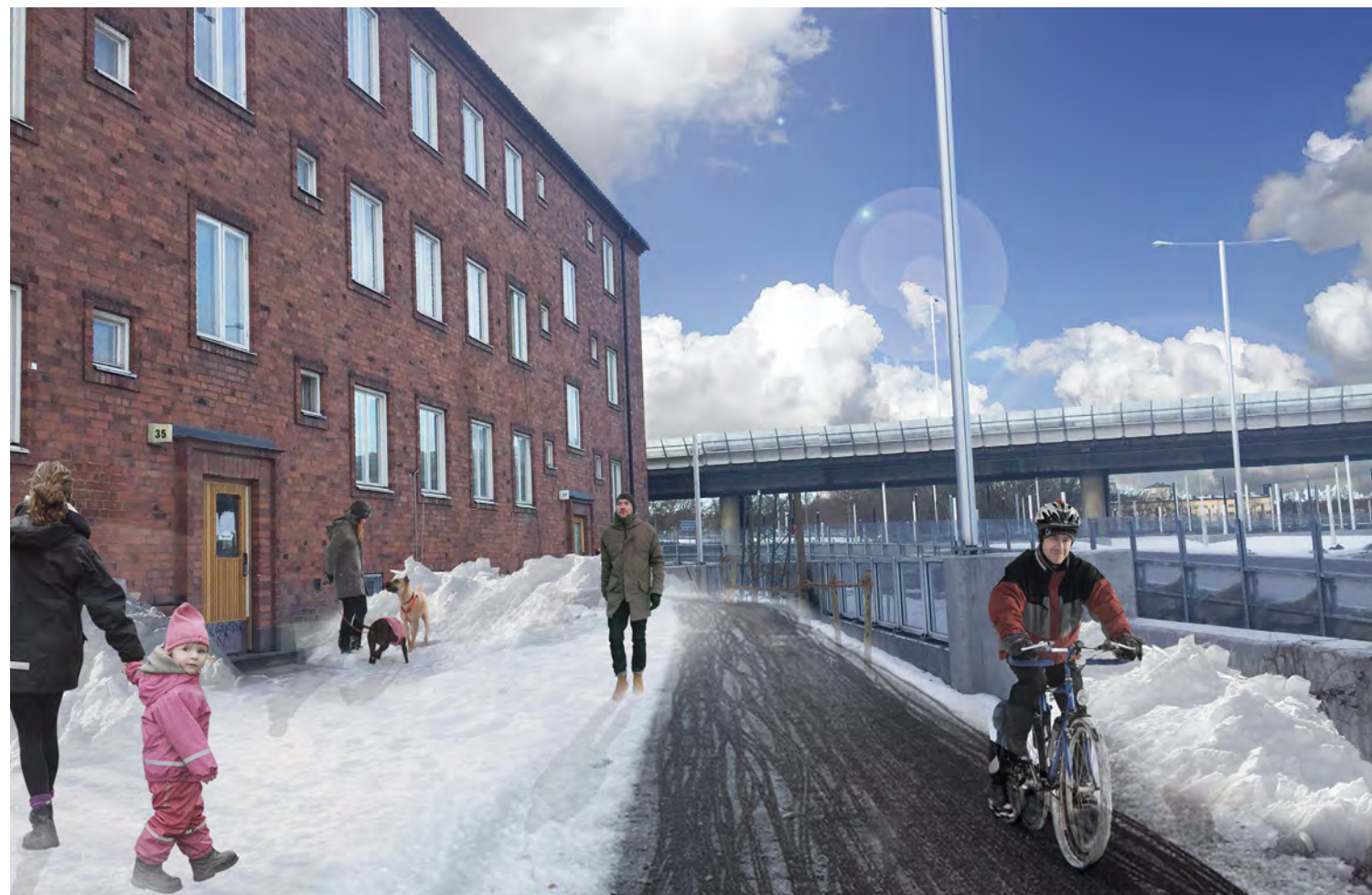
Perspektivbild: nytt gc-stråk