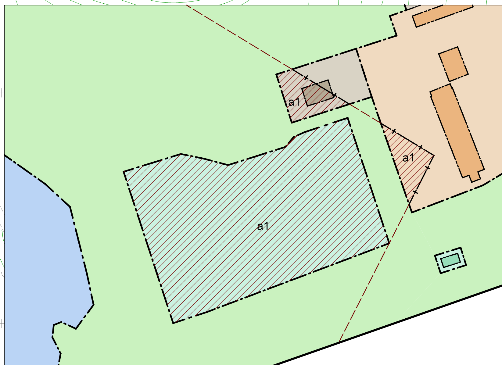
Illustration: Strandskyddet upphävs inom skafferat område. Strandskydd kommer fortsatt att gälla inom parkmark 100 meter från strand eller närmare.