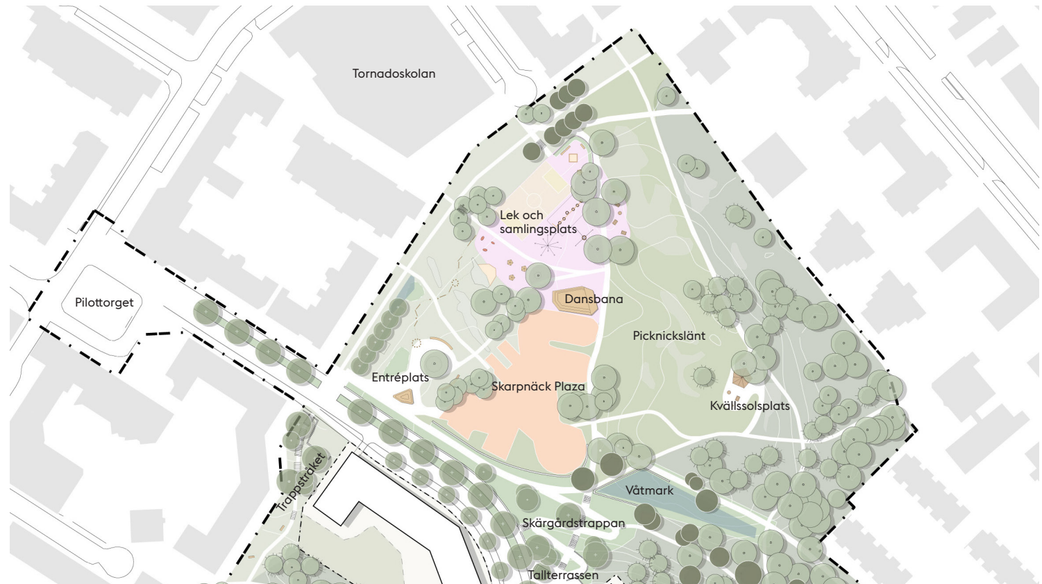
Förslag över parken, där "Skarpnäck plaza" avser skateparken. Illustration Nyréns.

Gestaltningen tar avstamp i Skarpnäcks särpräglade tegelkvarterstad och varierade taklandskap, men med ett samtida uttryck. Skalan lägesanpassas, från 5-6 våningar mot Skarpnäcks gård till 7 våningar mot