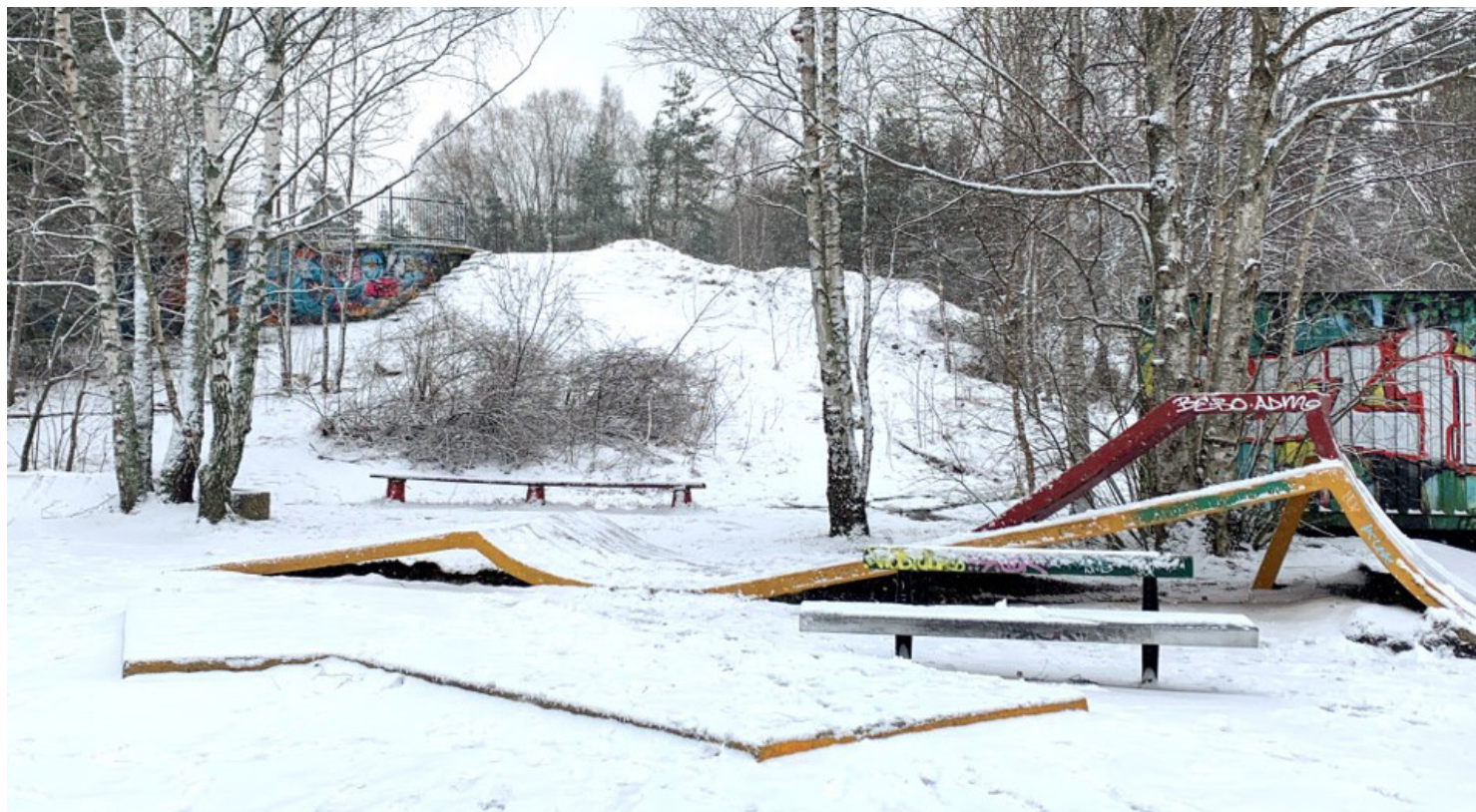
Bild från platsbesök. Del av skateparken i vinterskrud.

används idag. Platsbesöken har bland annat lett till att mer naturmark föreslås att sparas i samrådsförslaget än den strukturskiss som fanns med i detaljplanens start-PM.