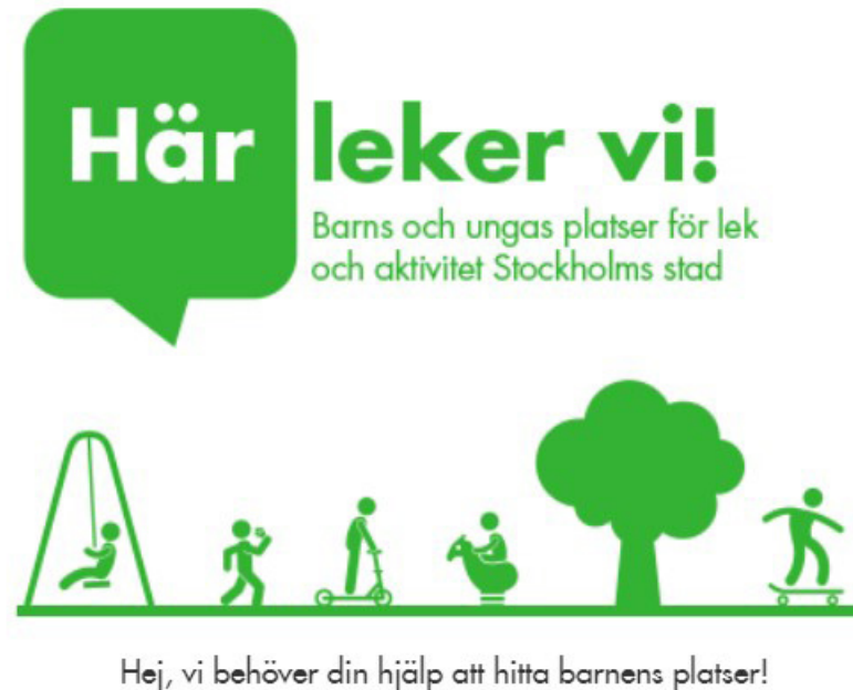
Bild från Stockholm stads webenkät Här leker vi.

en barnkonsekvensanalys 2015. Analysen skulle reda ut programarbetets påverkan på barn och unga i tidigt skede. BKA:n baserades bland annat på intervjuer med stadsdelsförvaltningen och en grupp ungdomar i området.