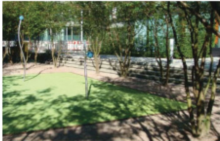
Förskolegården får olika rum genom terraserings och vertikala element

Inkom till Stockholms stadsbyggnadskontor - 2018-06-12, Dnr 2016-14205