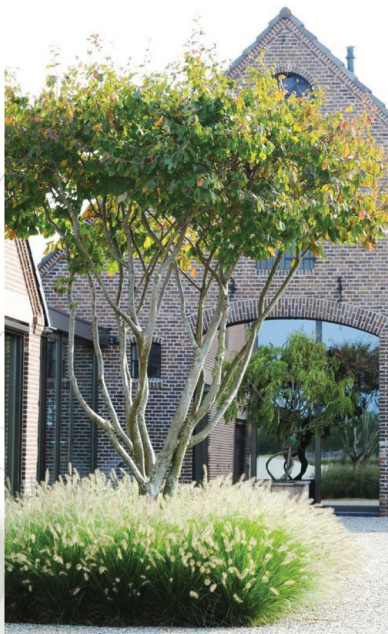
Flerstammiga träd i marktäckare på förgårdsmarken