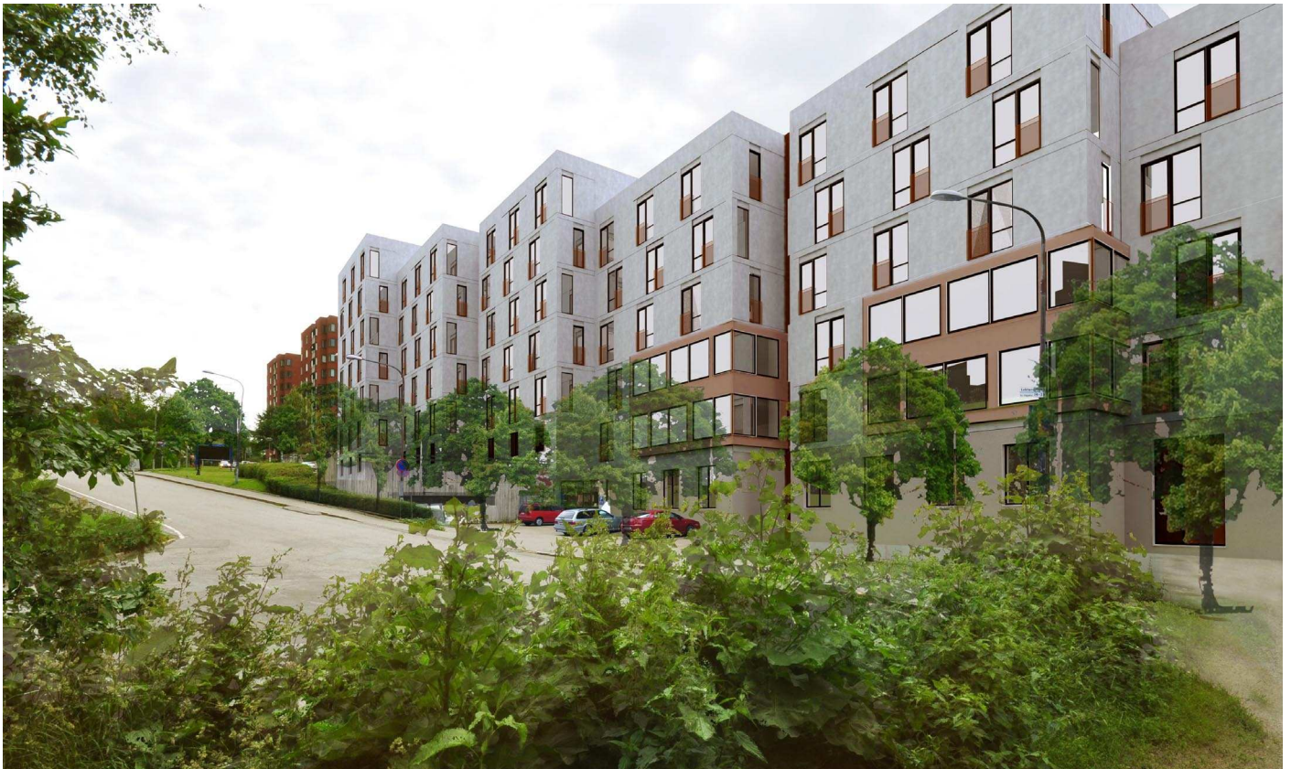
Vy 9, Hus 34:1-4