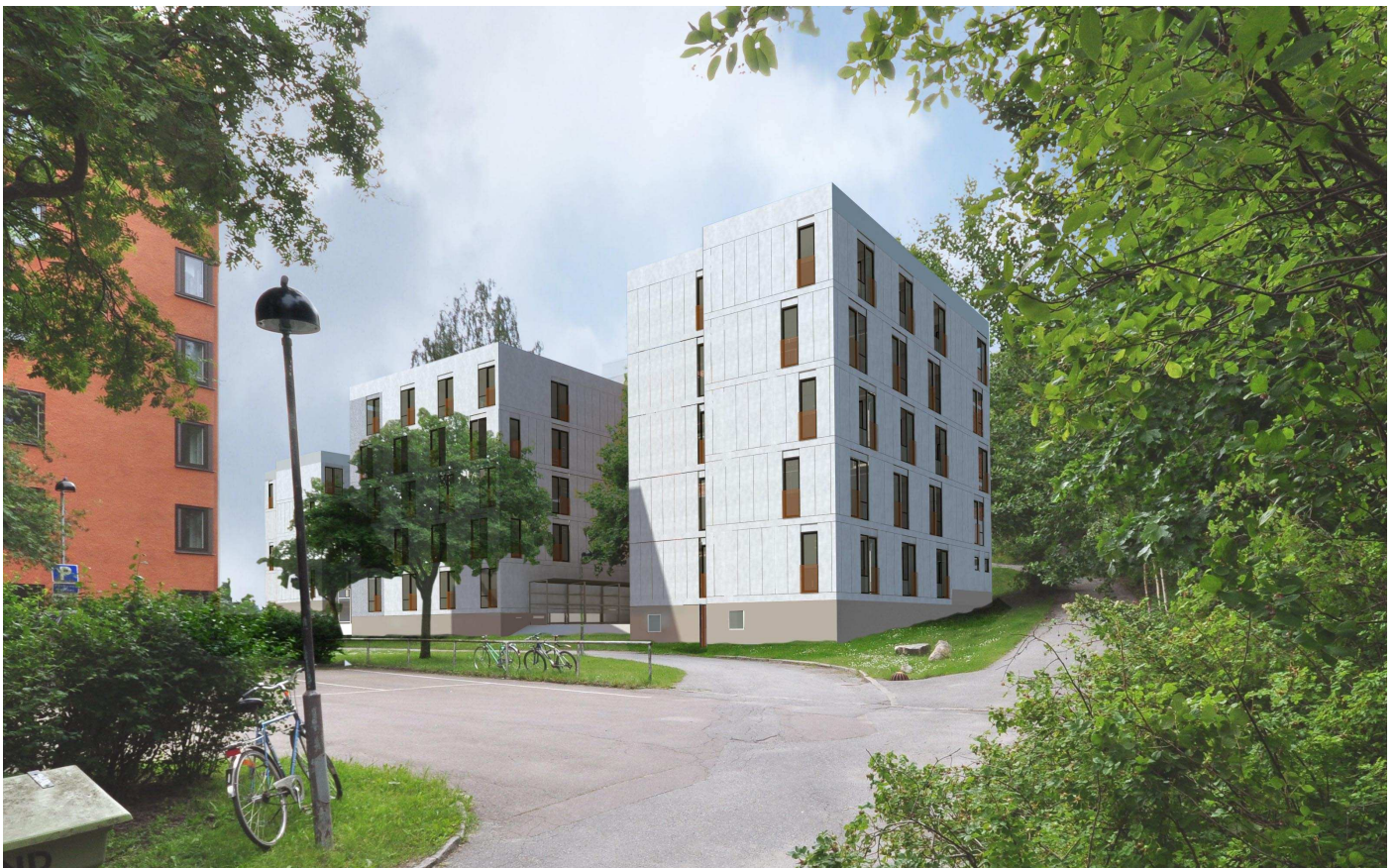
Vy 7, Hus 9:1