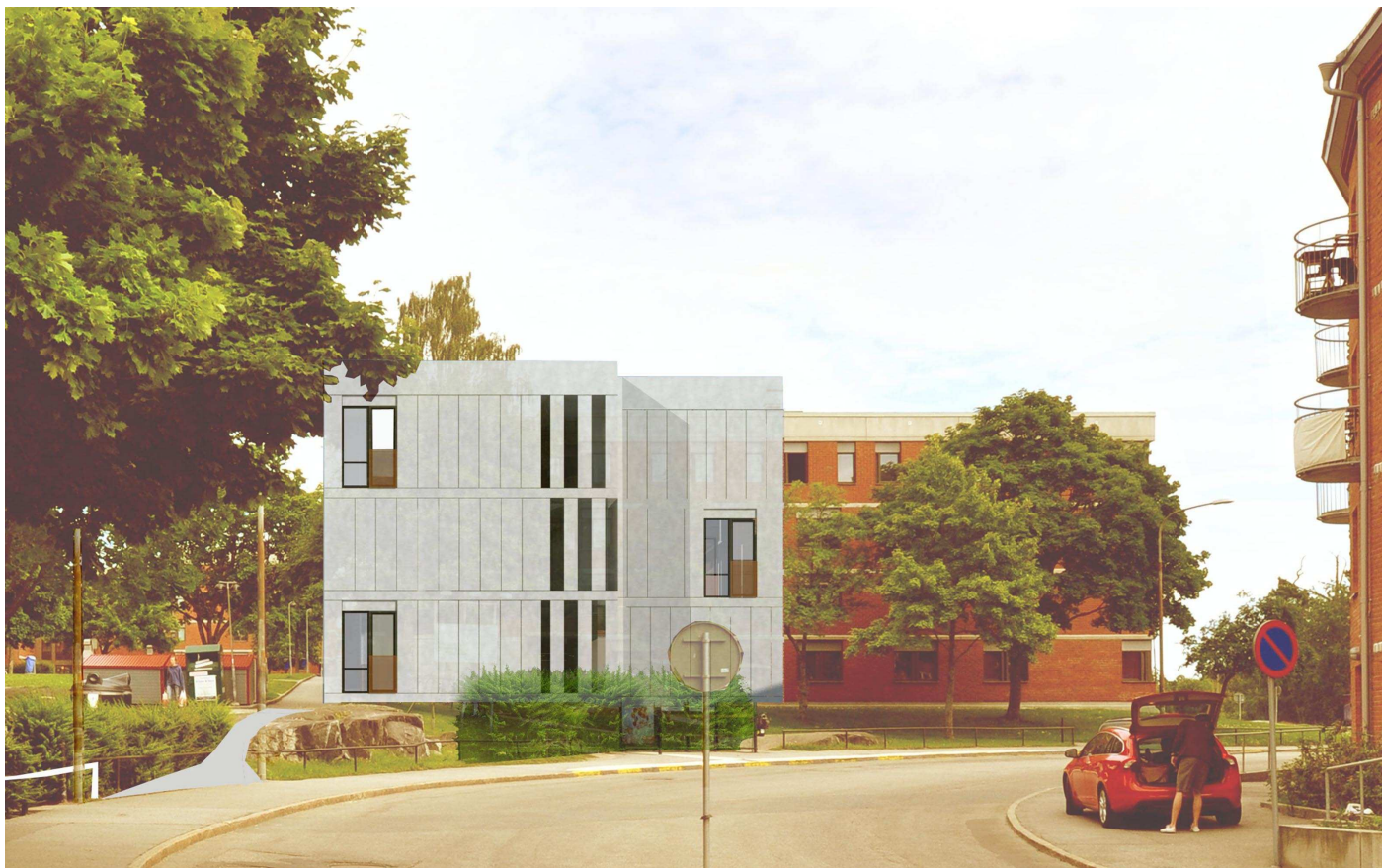
Vy 2, Hus 16:1