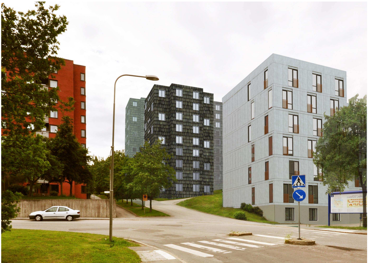
Vy 8, Hus 33:1-3