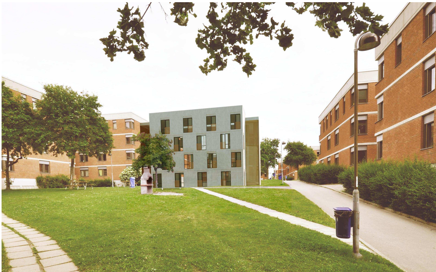
Vy 4, Hus 12:1