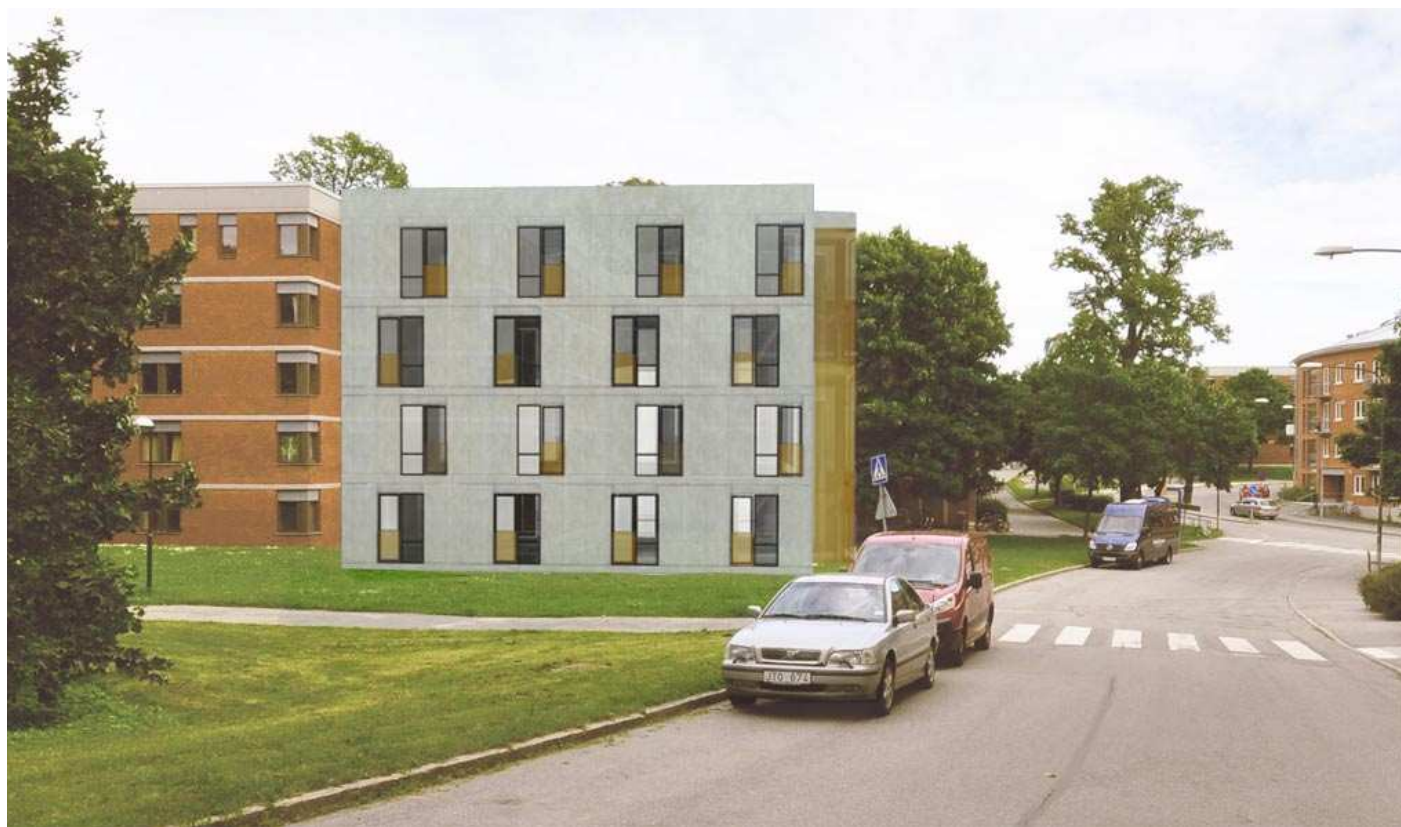
Vy 1, Hus 1:1