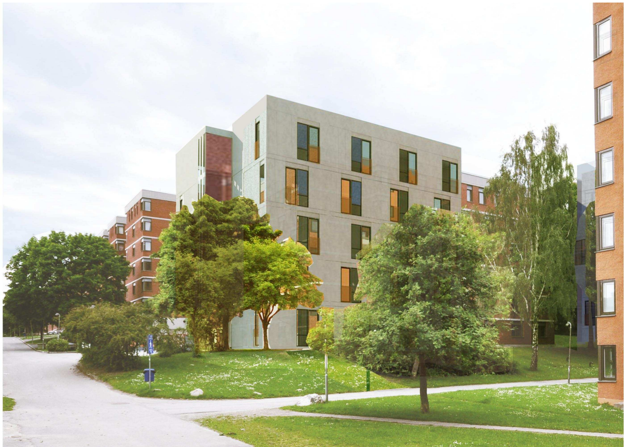
Vy 6, Hus 9:2