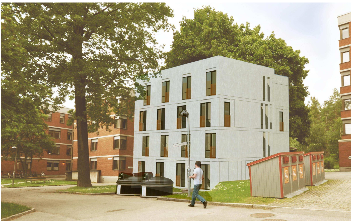
Vy 3, Hus 1:2