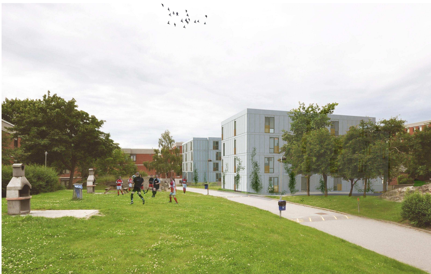
Vy 5, Hus 15:1-2