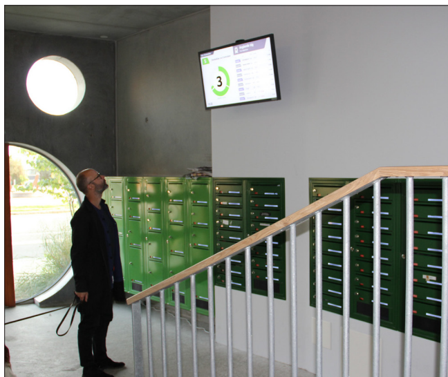
Realtidstavla med kollektivtrafikens avgångar.