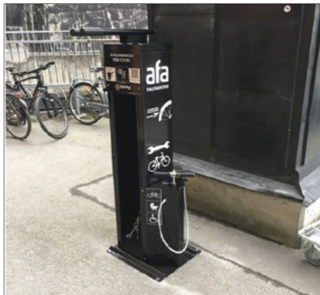
Exempel på cykelservice.

Det finns flera tillverkare av cykelserviceanordningar för såväl inomhus- som utomhusbruk, t ex Cyklos, Svenska cykelrum och Vestre.