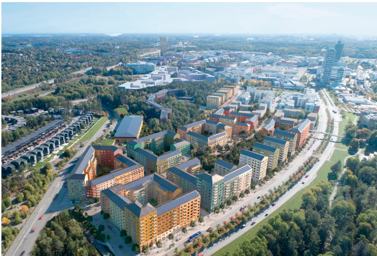
Flygbild över planerad bebyggelse sett mot Kista verksamhetsområde. Bild: Reflex Arkitekter/Ripellino Arkitekter.

Bebyggelsehöjderna i området utgår från en sammanhållen skala beroende på läge och anslutande offentliga rum. Mot Hanstavägen är höjderna övervägande åtta våningar med två markerade hörn i tio våningar. Mot Kista alléväg är höjderna motsvarande sju våningar. Mot lokalgatorna och det intimare gångfartsområdet och kvartersparken är våningsantalet mellan fem till sex våningar. Inom planområdet skapas tre nya offentliga parker, ett torg och ett gångfartsområde. De utformas med utgångspunkt i befintlig natur för att i så stor utsträckning som möjligt bevara befintliga natur- och kulturvärden. Parkering anordnas i underjordiska garage samt i ett parkeringshus som inryms i den tidigare serverhallen i anslutning till kontorsanläggningen. Projektspecifikt parkeringstal är 0,54 med möjlighet att sänka parkeringstalet till 0,4 med ambitiösa mobilitetsåtgärder.