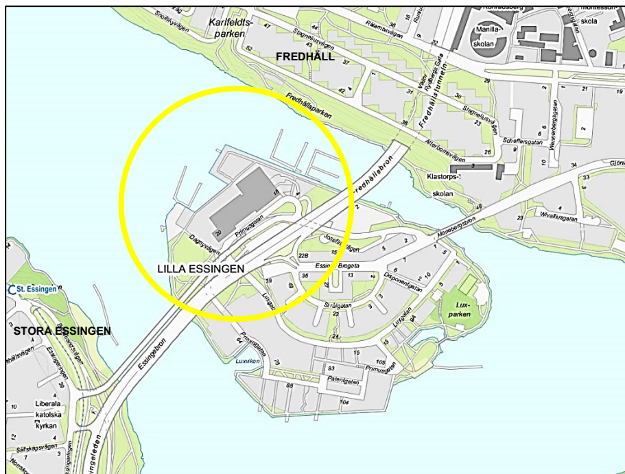
Översiktskarta med planområdets ungefärliga läge markerat.

Fleminggatan 4 Box 8314 104 20 Stockholm Telefon 08-508 27 300 stadsbyggnadskontoret@stockholm.se stockholm.se