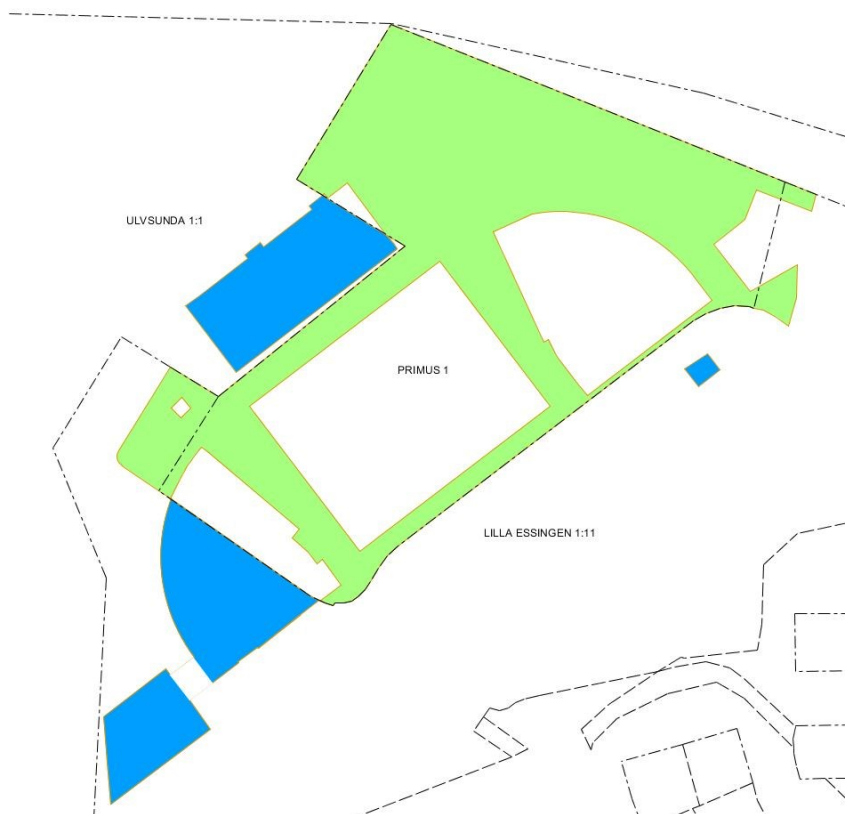
Figur 1. Figuren illustrerar förändringar mellan allmän plats och kvartersmark. Gröna ytor är idag kvartersmark som blir allmän plats. Blå ytor är idag allmän plats som blir kvartersmark.