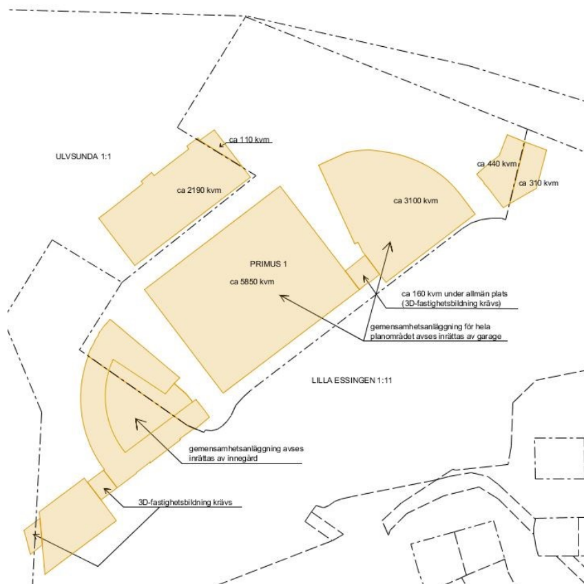
Figur 2. Figuren illustrerar nedanstående text om fastighetsbildning.