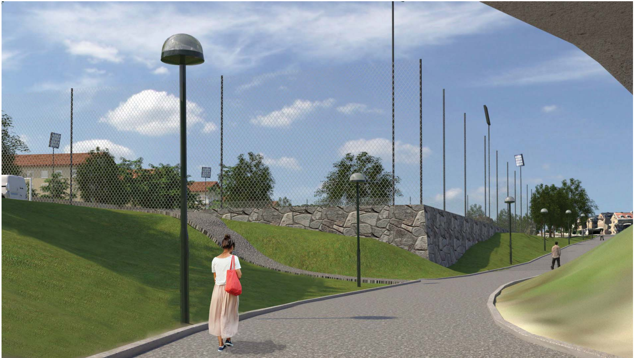
6. Vy från gång- och cykelstråket som går mellan fotbollsplanen och Drottningholmsvägen.