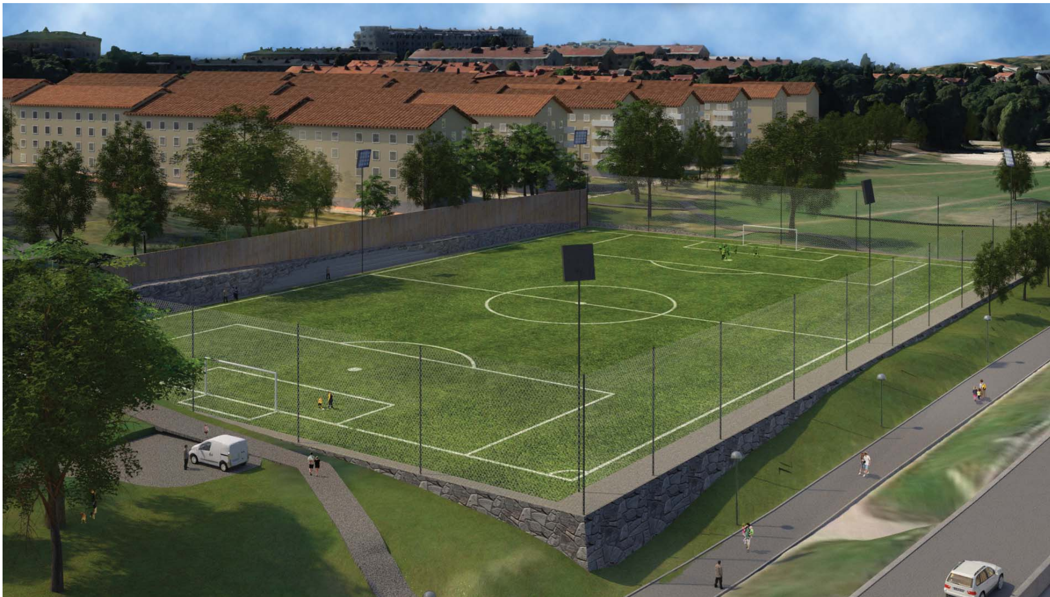
1. Vy över fotbollsplanen från Drottningholmsvägen