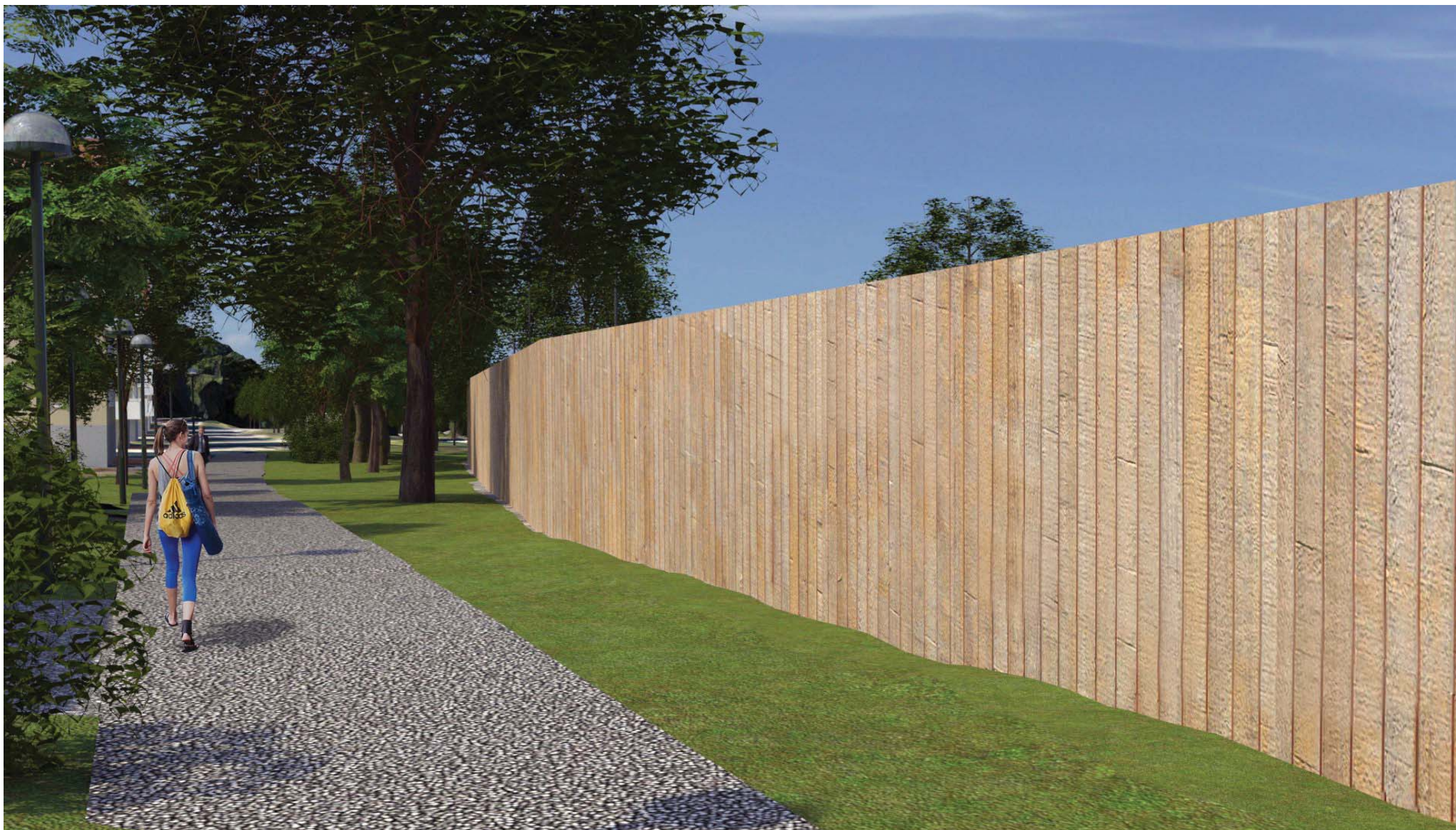
8. Bullerplank längs den södra långsidan