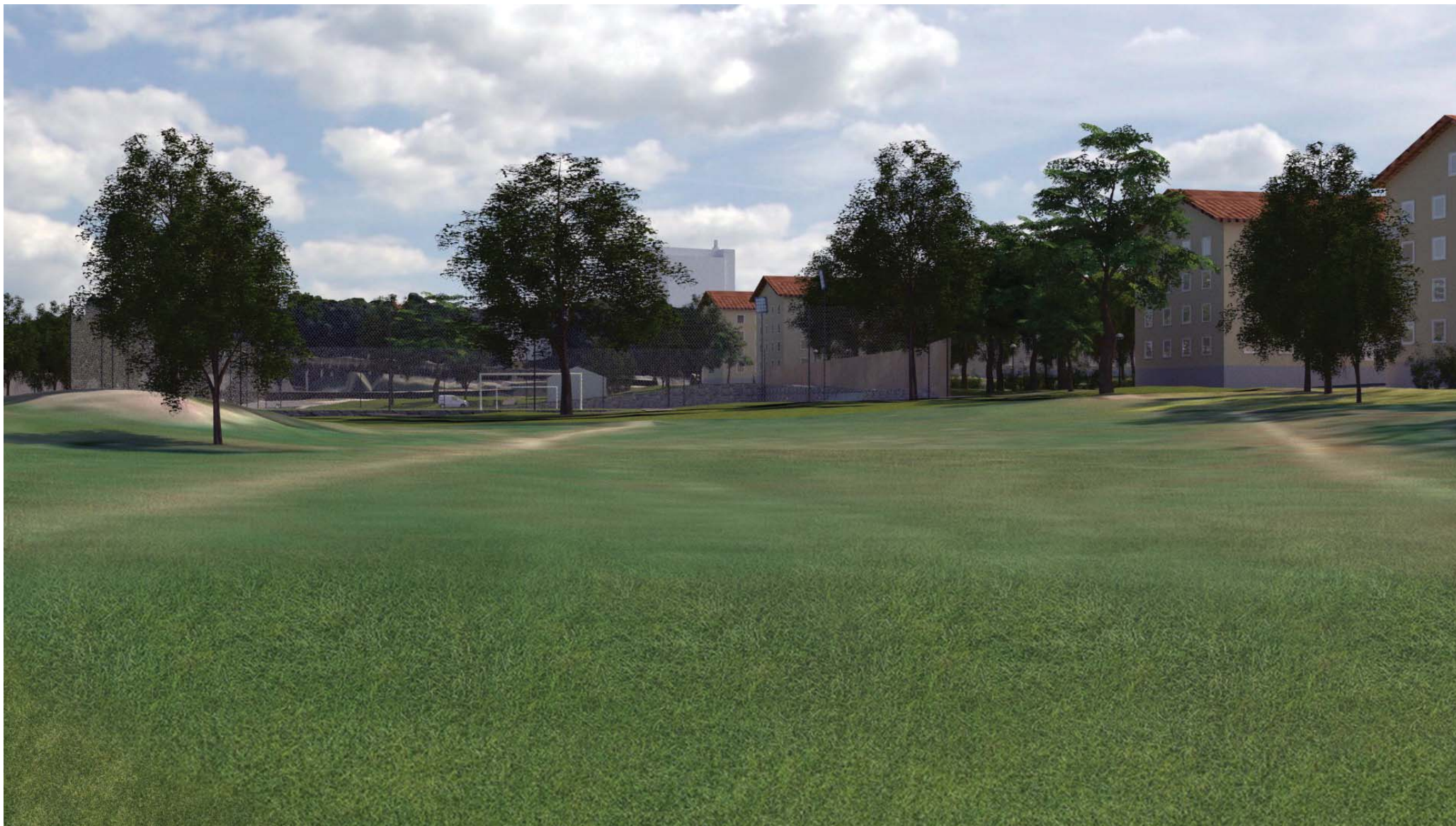
5. Fotbollsplanen sedd från den öppna parken västerifrån