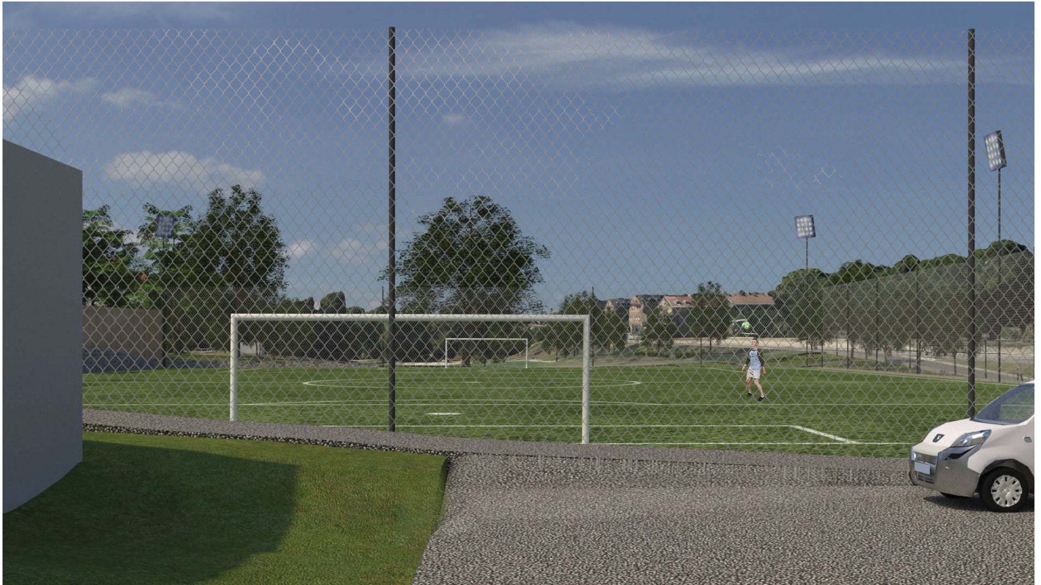
3. Fotbollsplanen sedd från driftstorget öster om ena kortsidan