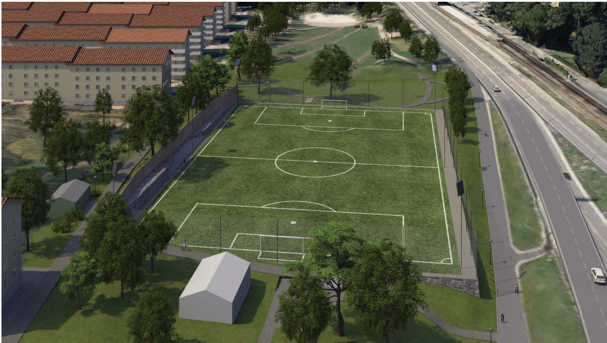
2. Vy över fotbollsplanen från Essingeleden