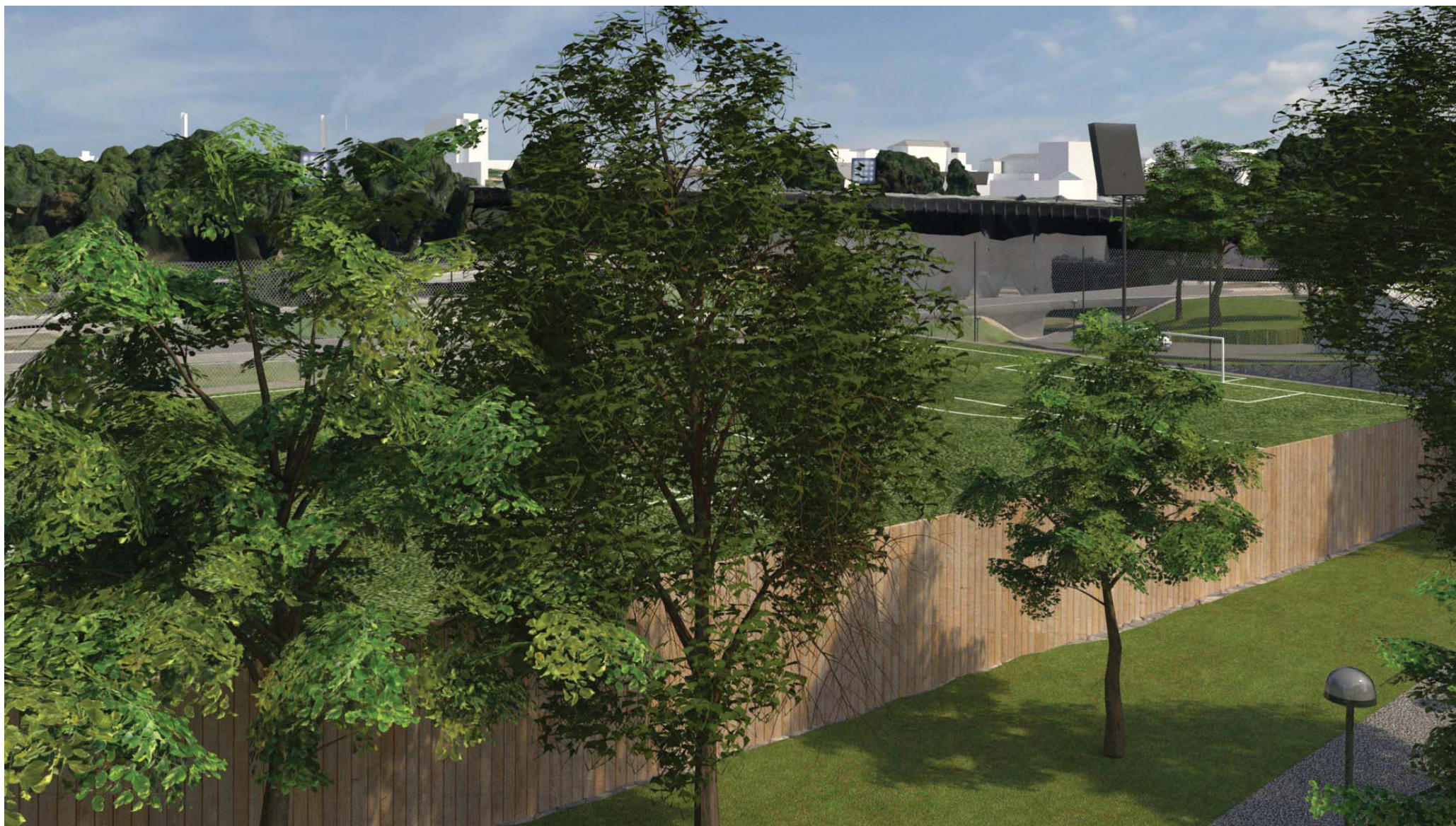
7. Bullerplank längs den södra långsidan