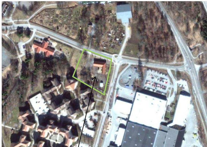
Kalhälls 4 H-gård