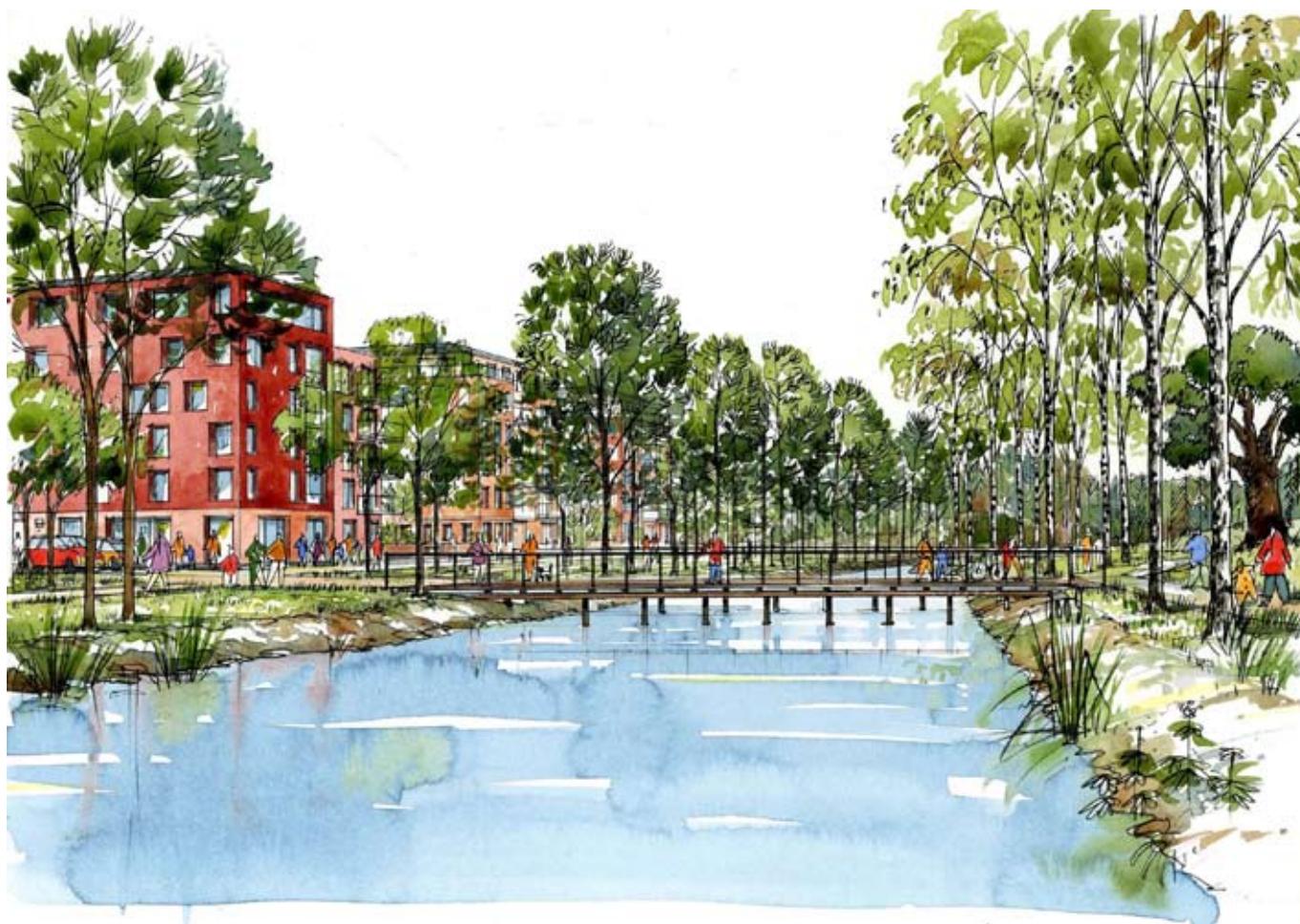
En av de föreslagna gång- och cykelbroarna över Husarviken.

Två nya gång- och cykelförbindelser föreslås över Husarviken för att förbättra sambanden mellan Hjorthagen och Norra Djurgården.