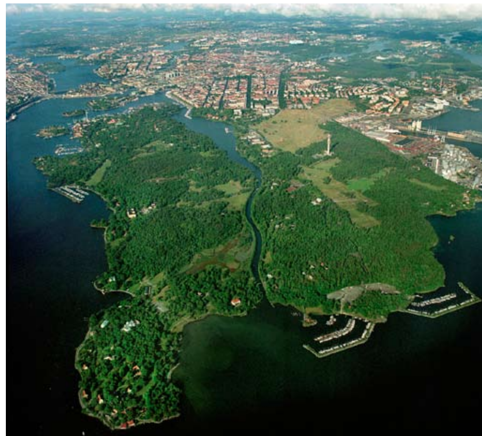
Nationalstadsparken med Södra Djurgården i förgrunden.

Norra Djurgårdsstaden, området vid Norra station, Karolinska Universitetssjukhuset och Karolinska Institutet samt området vid Frihamnen och Loudden