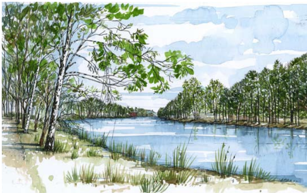
Husarviken. Illustrationen på sida 54 visar samma vy fast med föreslagen bebyggelse längs Husarvikens södra strand.

Hjorthagsparken och delar av grönskan mellan bebyggelsen är rester av ett tidigare naturlandskap. Hjorthagsparkens natur är värdefull, på sluttningarna växer bland annat mycket gamla barrträd, grova ekar, lönn och lärk.