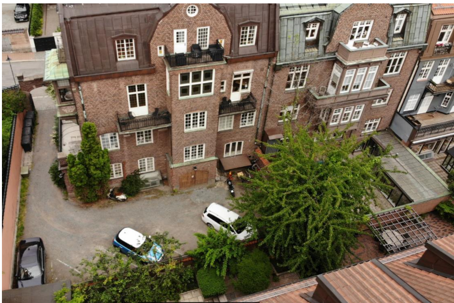
Bild 1 (Sköldungagatan 4 till vänster och Sköldungagatan 6 till höger i bild mot innergård).