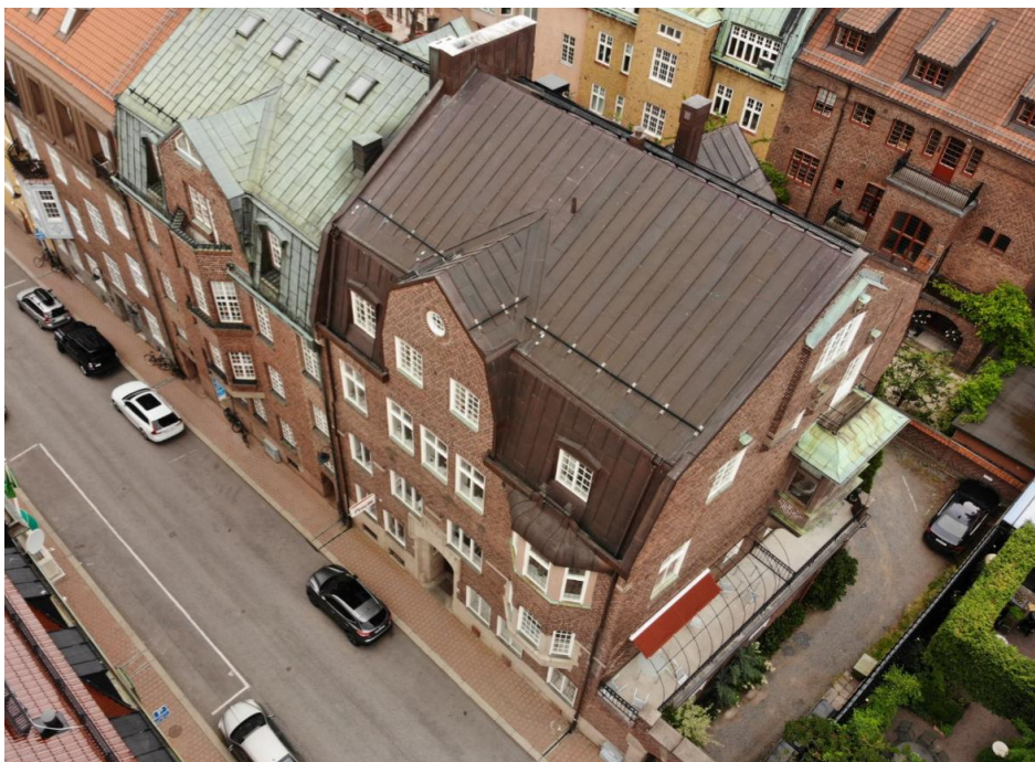
Bild 2 (Sköldungagatan 4 till höger och Sköldungagatan 6 till vänster i bild mot gatan).