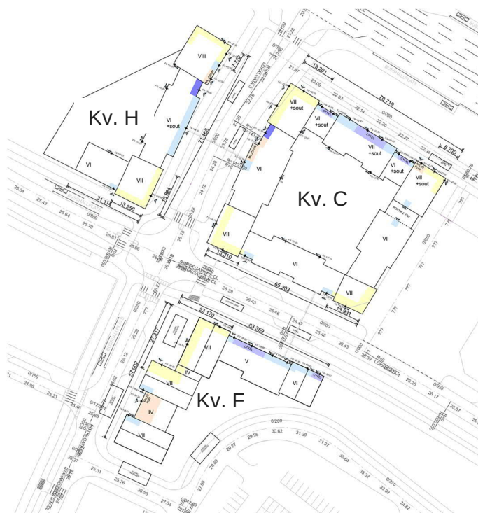
Figur 1. Planerad bebyggelse enligt utdrag från Situationsplan, förhandskopia daterad 2020-02-12. Kv. C utförs med 6 – 7 våningar över markplanet. Under huskroppen och innergården planeras källare- och gårdsunderbyggnad i suterräng. Lägsta golvnivå ligger på +22,2 – +24,0, motsvarande 0 – 2,4 m under angränsade gators planerade gatunivå. Kv. H utförs med 6 – 8 våningar. I västra delen av kvarteret samt under delar av huset planeras källare- och gårdsunderbyggnad i suterräng. Lägsta golvnivå ligger på +22,0 – +23,6, motsvarande 0 – 2,3 m under angränsade gators planerade gatunivå. Kv. F utförs med 4 – 7 våningar. Under gården i söder och delar av huset planeras källare- och gårdsunderbyggnad i suterräng. Lägsta golvnivå ligger på +26,6 – +27,6, motsvarande 0 – 4,0 m under angränsade gators planerade eller befintliga gatunivå.

På uppdrag av ByggVesta har Geoteknologi Sverige AB utfört översiktlig geoteknisk utredning för planerad bebyggelse. Arbetet har omfattat inventering av tidigare utförda undersökningar samt översiktlig geoteknisk utvärdering med avseende på planerad bebyggelse.