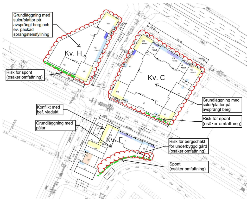
Figur 3. Översiktligt bedömda schakt- och grundläggningsförutsättningar. Inom rödmolnande områden bedöms bergschakt preliminärt erfordras. Exakt omfattning är osäker och behöver verifieras genom undersökningar.

Ur grundvattensynpunkt bedöms samtliga kvarter (C, F, H) inom området kunna utföras på en dränerad terrass, men kompletterande grundvattenrör behöver installeras för att kontrollera rådande grundvattennivåer i området.