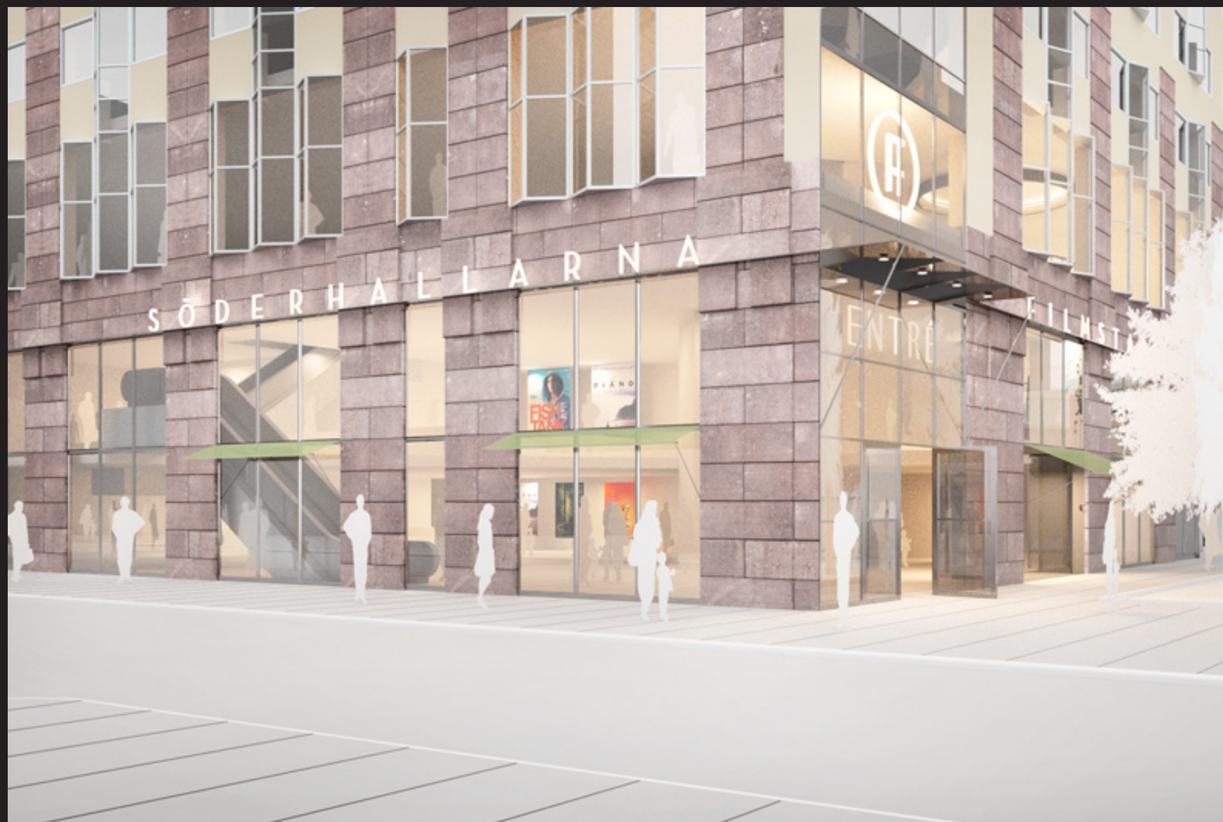
Motsvarar vypunkt I