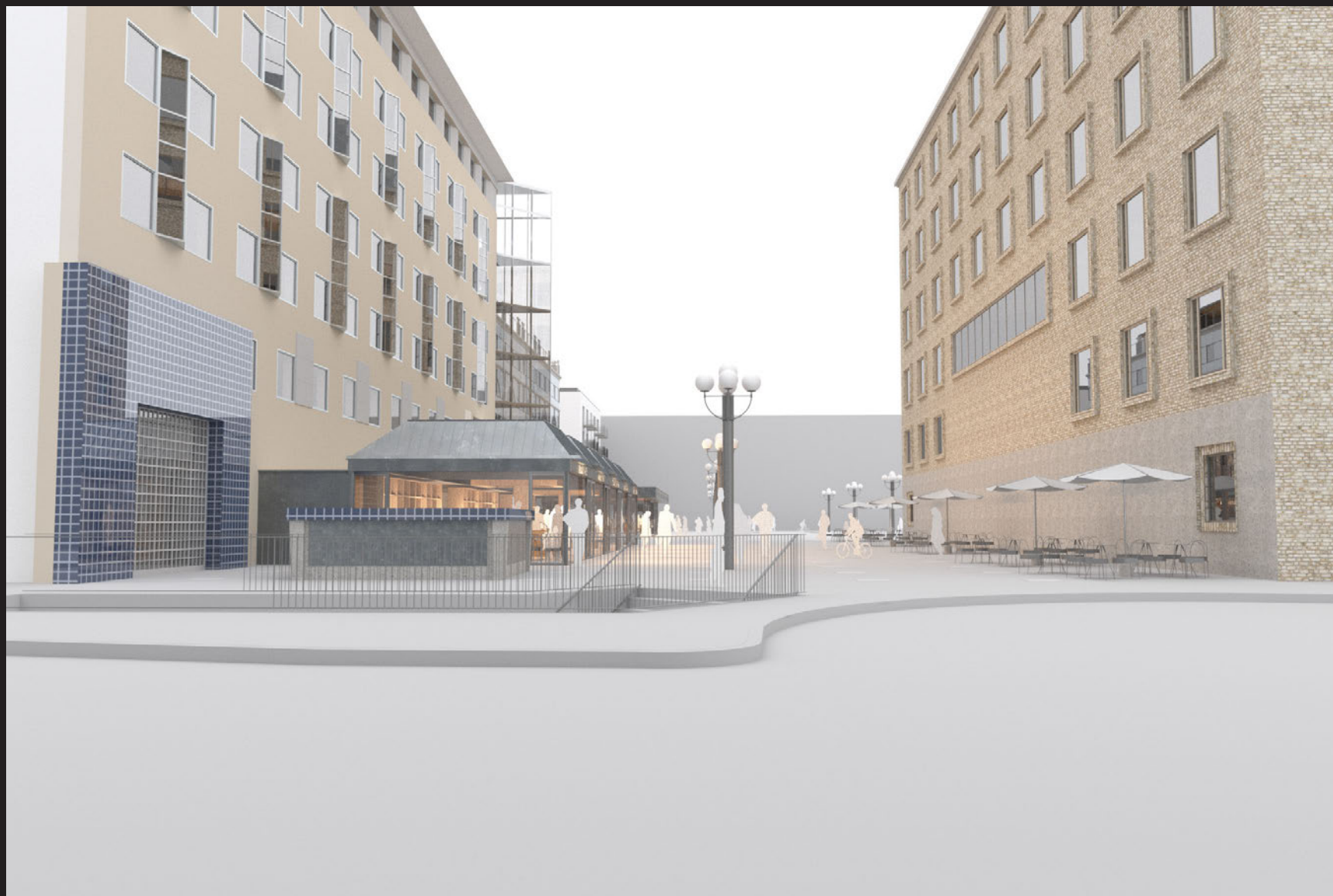
Motsvarar vypunkt C