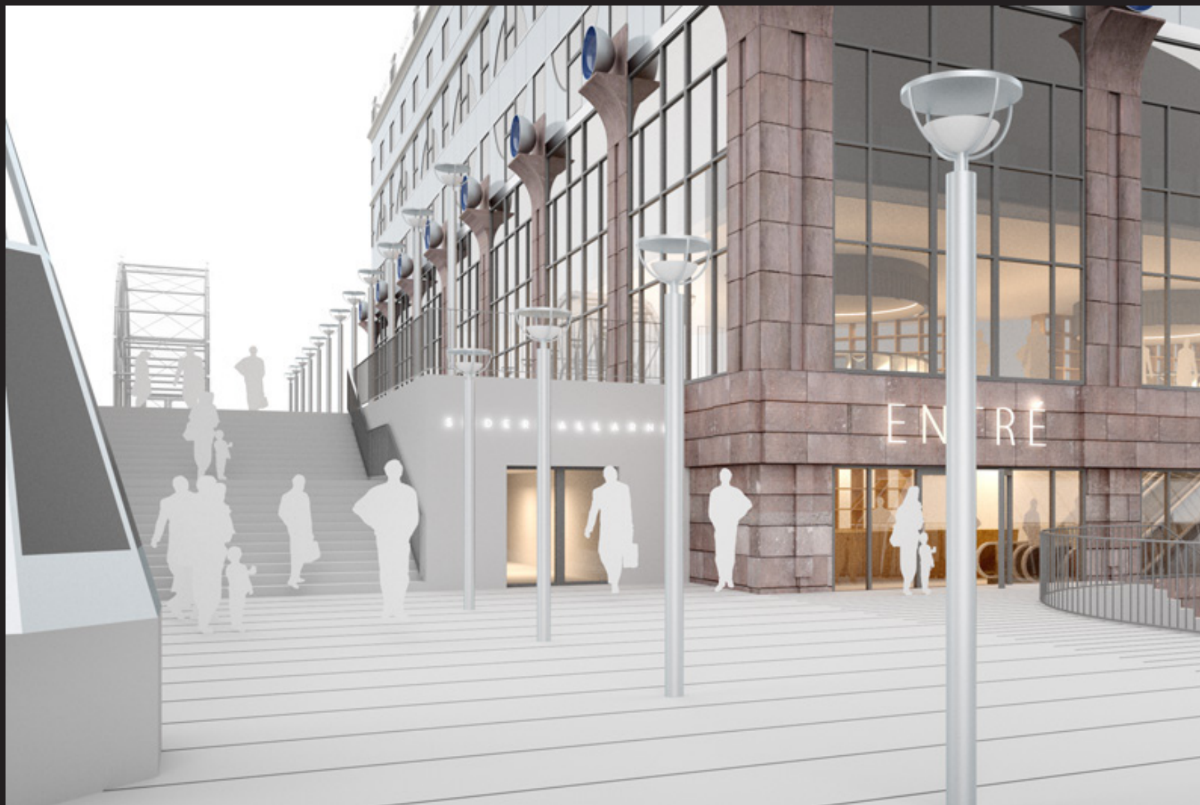
Vy från Fatburstrappan