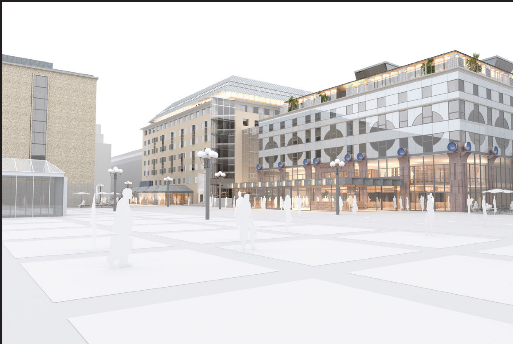
Motsvarar vypunkt B