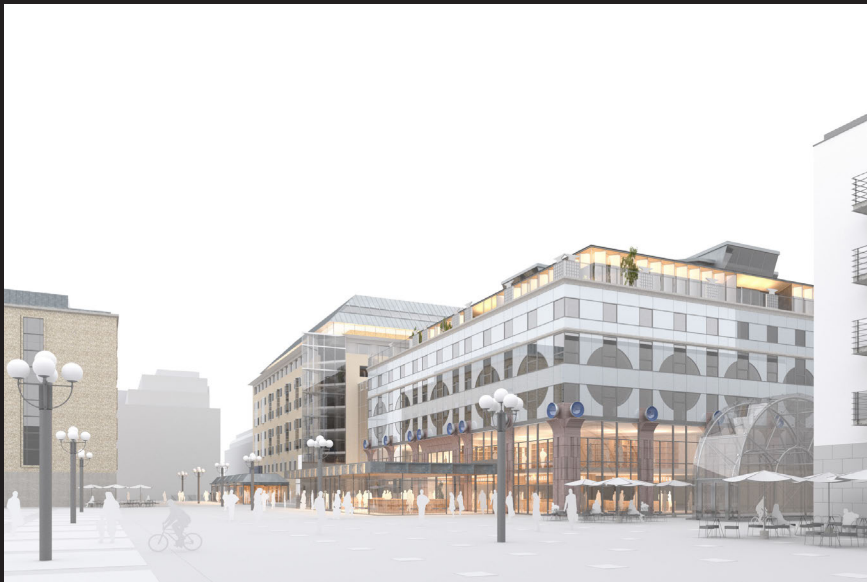
Vy från nordost - nära vypunkt B.