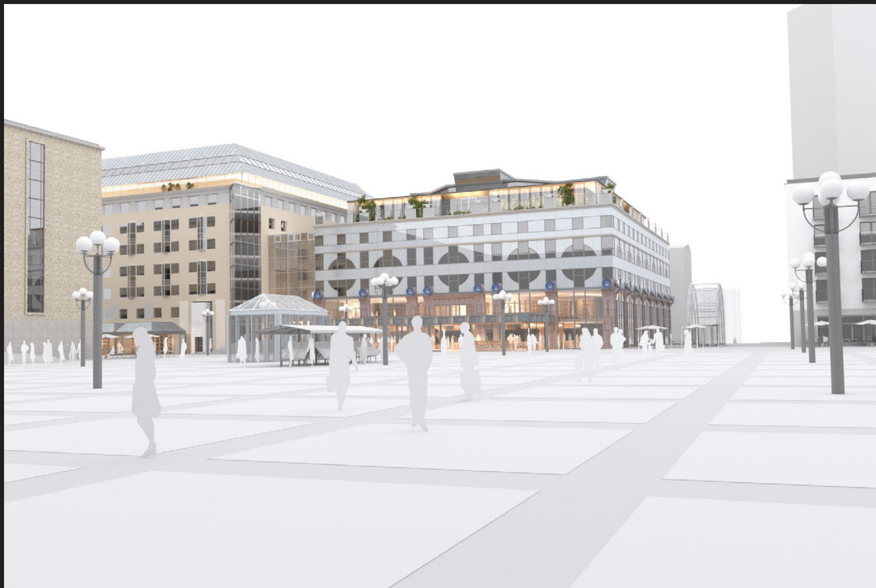
Motsvarar vupunkt A