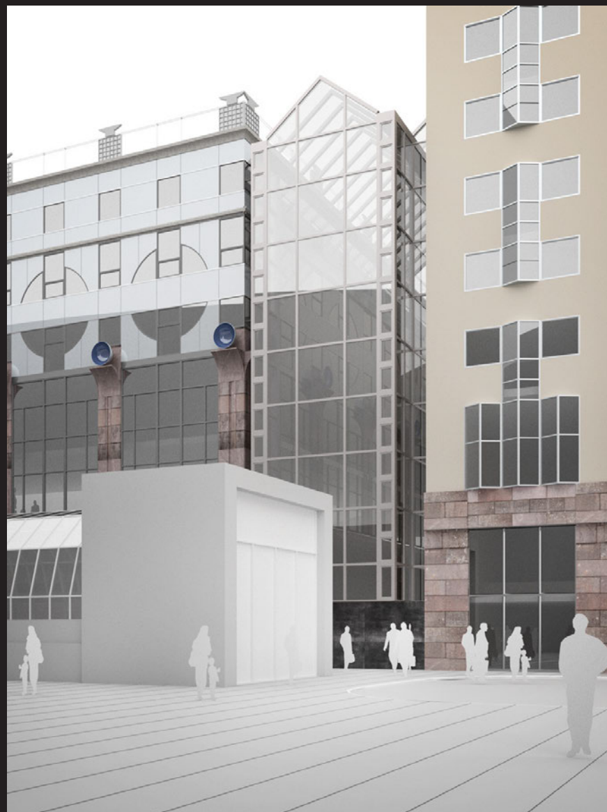
Motsvarar vypunkt J