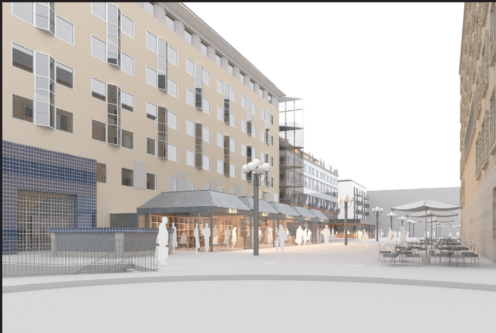
Vy från söder - nära vypunkt C.