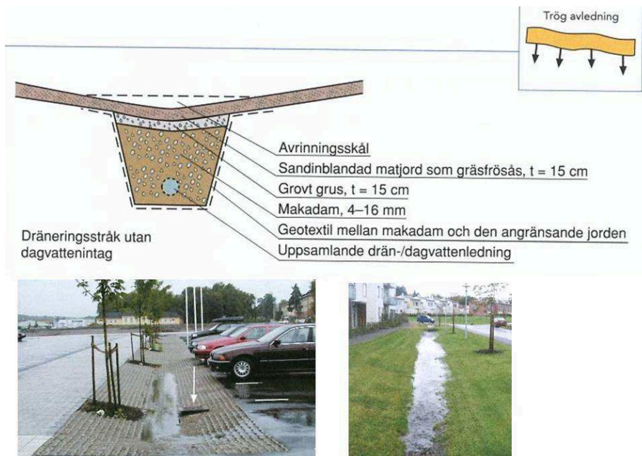
Figur 4. Principuppbyggnad av ett avrinningsstråk med rasterplattor (t.v.) och gräs (t.h.). Bilder från P105.

Avrinningsstråkens funktion är i första hand att ta hand om det dagvatten som inte infiltrerar, tas upp av växter eller avdunstar, utan avrinner på ytan. Uppbyggnaden utgörs av ett makadamfyllt dike som överst beläggas med något permeabelt material, till exempel gräs, grus eller rasterplattor. I botten av stråket kan en dräneringsledning läggas. Se figur 4 nedan för principuppbyggnad av ett avvattningsstråk.