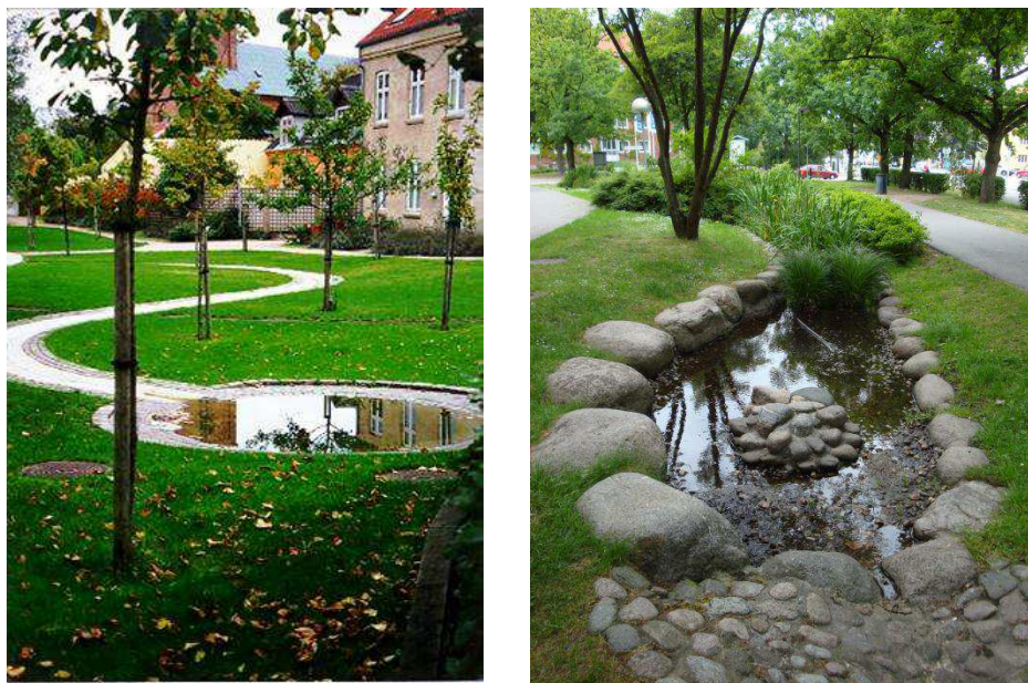
Figur 7. Exempel på utformning av små fördröjningsdammar och översvämningsytor.

I figur 7 visas exempel på små dammar och översvämningsytor invid bebyggelse för yttlig fördröjning.