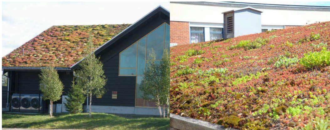
Figur 1. Exempel på hur anläggning av gröna tak kan se ut.

För att minska och utjämna flöden kan man använda gröna tak med exempelvis sedumväxter. Sedumtaken minskar den totalt avrunna mängden på årsbasis med ca 50%. Dessutom ökas initialförlusten vid varje regntillfälle med ca 6-10 mm beroende på vald tjocklek på substratet och lutning på taket. Detta innebär att även kraftiga regn kan utjämnas under den första avrinningstiden. Sedumtaken klarar en lutning på upp till 27%, vid brantare lutning torkar taken mot söder så pass mycket att växterna tar skada. I figur 1 nedan visas exempel på gröna tak.