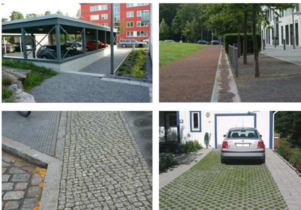
Figur 3. Exempel på permeabla beläggningar.

Hårdgjorda ytor kan med fördel minimeras och ersättas med genomsläppliga material som till exempel grus för att minska avrinningen och öka möjligheten till infiltration eller fördröjning. Det finns ett antal olika vattengenomsläppliga ytmaterial som kan anläggas som alternativ till täta beläggningar. Exempel på sådana är grus, dränerande asfalt, rasterytor med betonghålsten eller plastplattor. I figur 4 visas olika exempel på genomsläppliga beläggningar.