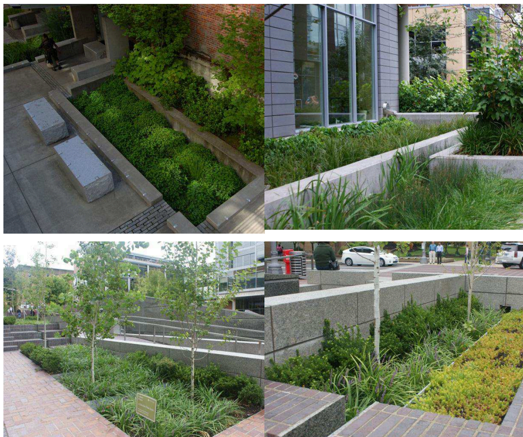
Figur 6. Exempel på utformning av växtbäddar.

För bilder över växtbäddar i bostadsnära miljö se figur 6.