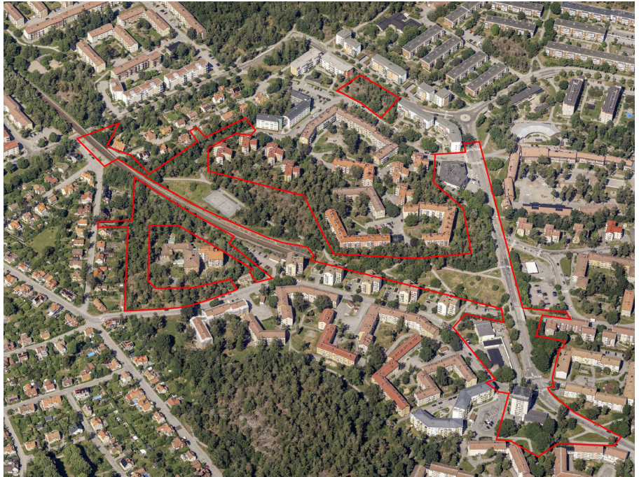
Visa områdesnivå och stadsdelsnivå