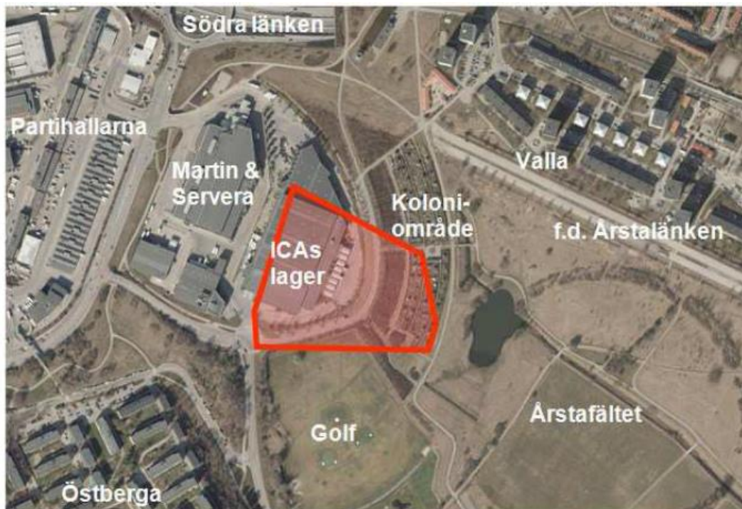
Figur 1. Planområdet markerat i kartan. Omfattar ICA:s lagerlokal, del av kolonilottområdet samt del av golfbanan.

Projektet utgör också en viktig del av stadens åtagande att uppföra bostäder i den utbyggda tunnelbanans influensområde. Kommunen har därmed åtagit sig att själv eller genom annan markägare/entreprenör uppföra ca 45 000 bostäder i tunnelbanans influensområde senast den 31 december år 2030.