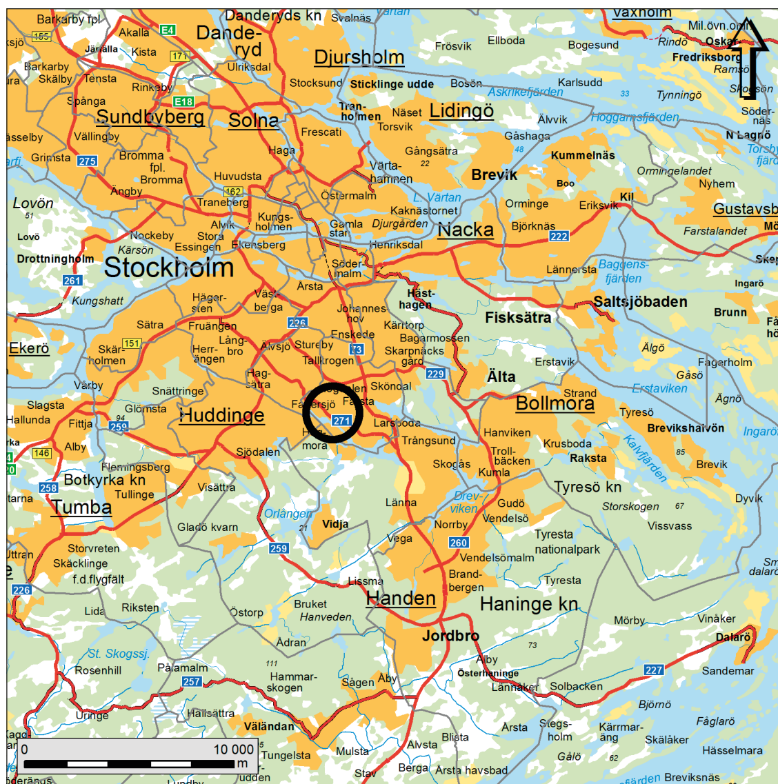
Figur 1. Karta över trakten kring Nykropppagatan med den aktuella undersökningsplatsen markerad med en svart ring. Skala 1:250 000.