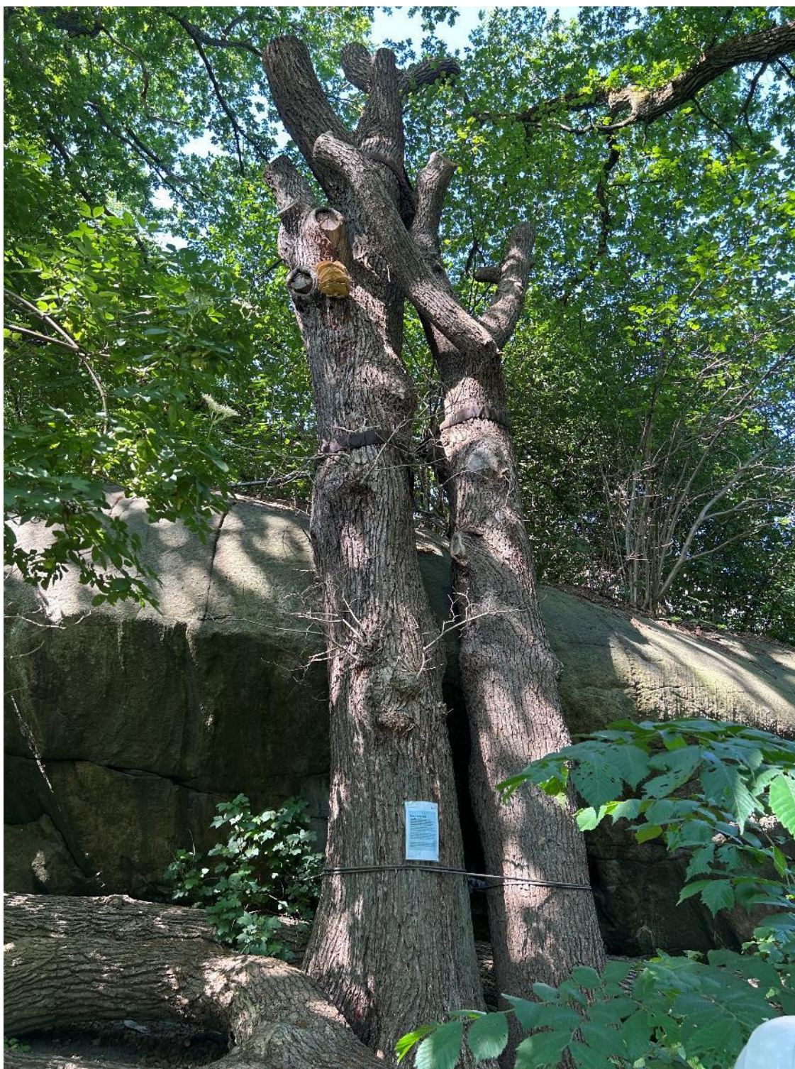
Bild 4. Exempel på avvergade stammar som ställs som högstubbar mot berghäll för att bidra till den ekologiska mångfalden

Kunasvägen 42 352 49 Växjö orjan.stal@viosab.se Telefon 0470-65784 Mobiltelefon 070-6578424