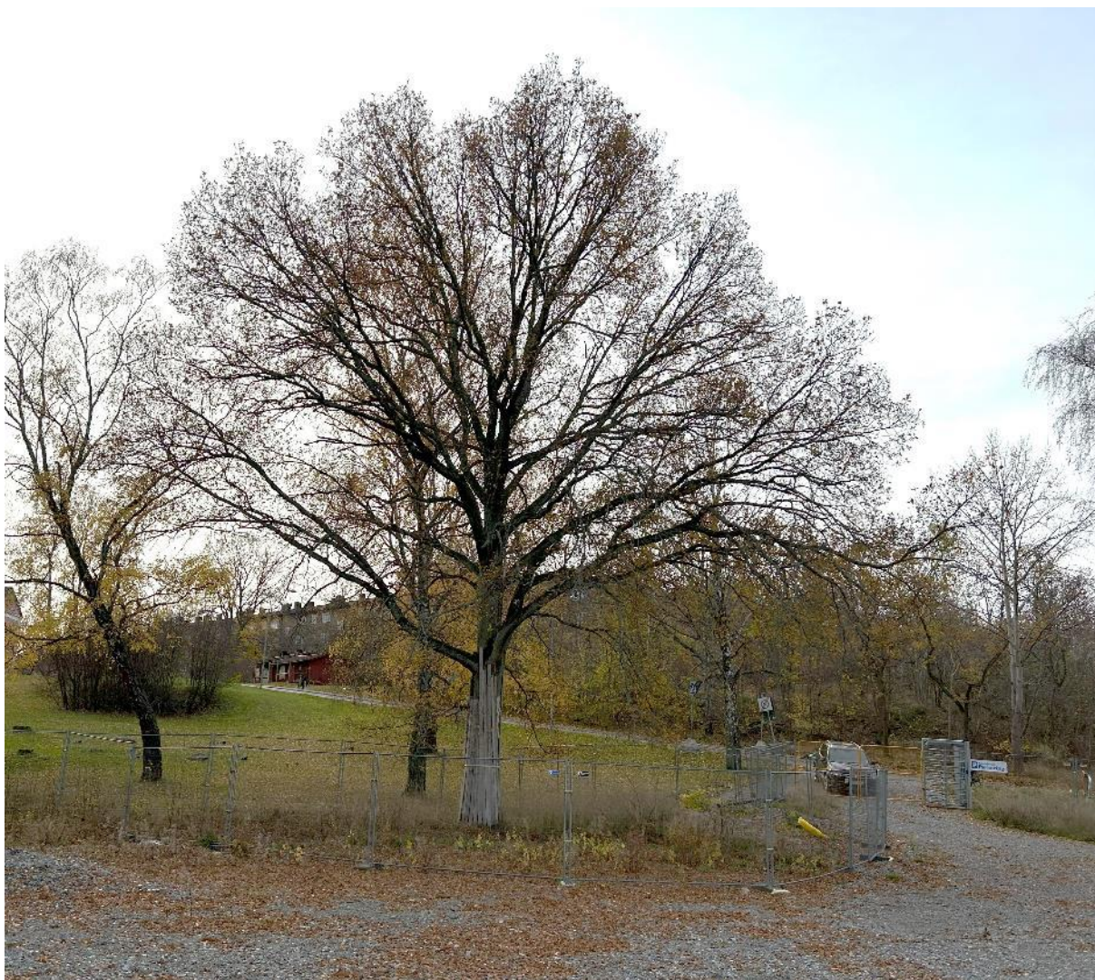
Bild 2. Eken är i god vigör och kondition och bedöms ha goda förutsättningar till att kunna skyddas och sparas vid byggnation av förskola med tillhörande förskolegård.

Den solitäraeken bedöms vara i god vitalitet och är fortfarande i tillväxtfasen. Trädet har inga synbara skador på stammen förutom några döda grenar, vilket är fullt naturligt för ekar som går från juvenilt till adult stadie (se bild 2).