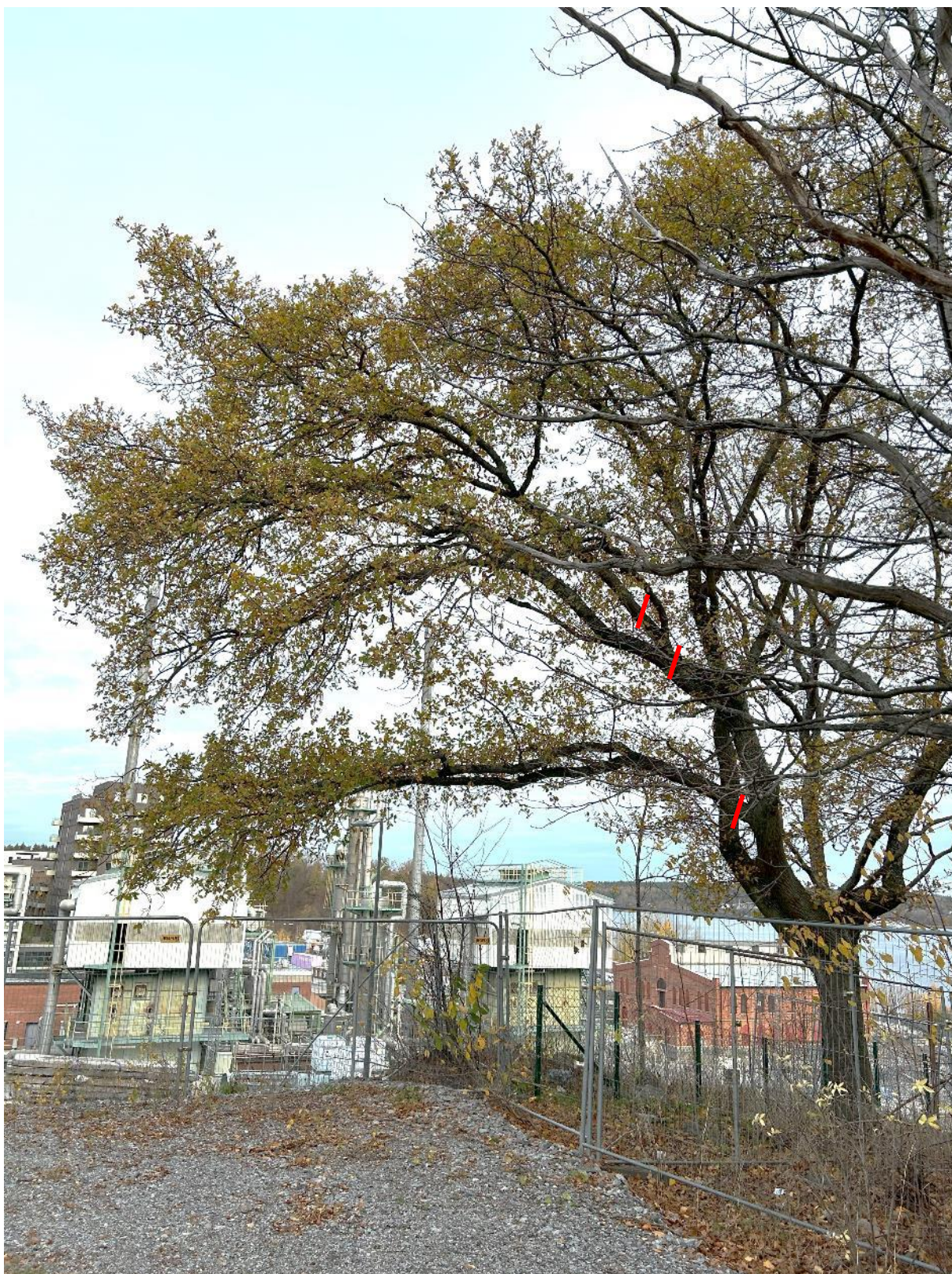
Figur 3. Eken i nordöstra hörnet till fastighetsmark föreslås att beskäras vid de röda strecken på grenarna.