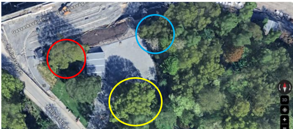
Bild 1. Solitär ek som ska bevaras (gulring) träd som måste avverkas med (rödaringar) och träd som kan påverkas vid byggnation (blåring).

Vid ett parkområde ut med Rådjursstigen där det tidigare har funnits garagebyggnader planeras en förskola, inom kvarter kallat Villebrådet. Byggnaderna planeras att utföras inom det område där garagebyggnaderna tidigare varit placerade. Förskolegården planeras att placeras söder om byggnaderna där det växer en medelstor ek. Eken har bedömts som en viktig efterträdare för eksambandet inom Hjorthagen från framtagna naturvärdesinventering (Calluna). Trädet har satts till att skyddas och bevaras i detaljplanen och bör skyddas även under genomförandet. I kanten av området som ska exploateras ut mot Rådjursstigen måste två ekar avverkas och i den nordöstra delen av området som vetter mot ett skogsparti kan en ek påverkas av byggnationen (se bild 1).