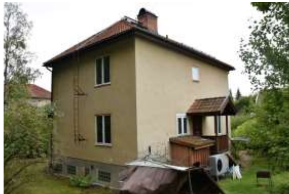
Figur 13. Lillskogen 45 sedd från tomten.