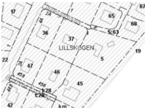
Figur 2. Fastighetskartan visar berörda fastigheter. Tomterna närmast gatan 47, 36 och 37 har nyligen exploaterats med parhus.

Lillskogen 5, 45 och 46 är en del i ett större kvarter, beläget sydost om Bromma kyrka och på gångavstånd från kyrka- och kyrkogård. Villabebyggelsen i kvarteret Lillskogen och utmed Attundavägen karaktäriseras av villor i olika stilar, från olika tider. Majoriteten av villabebyggelse i denna del av området kännetecknas av villor från 1940- och 1950-talet. Många av dessa med funktionalistiska stildrag. Villorna har fasader med träpanel, puts eller tegel, taktäckning består ofta av tegel. Ett större byggnadskomplex Brommagården/äldreboende i hörnet Spångavägen/Bromma Kyrkväg, uppfördes 1999 och utgör med sin långsträckta byggnadsvolym en kontrast mot alla enfamiljshus. Vid samma tid uppfördes även radhus i kvarteret Ålderdomshemmet. Även dessa utgör en kontrast mot villorna i området, men är avseende byggnadshöjd och fasadmateriell ett tillägg som infogat sig väl. Radhusen har en indragen placering på tomten, och marken är välplanerad med mycket grönska i anslutning till gatan. Öster om kvarteret Lillskogen ansluter en bergsslutning med buskar och träd. Vid besök på plats i september 2020, konstateras att mycket har förändrats på senare tid i kvarteren runt Attundavägen. Förtätning och nybyggnation pågår.