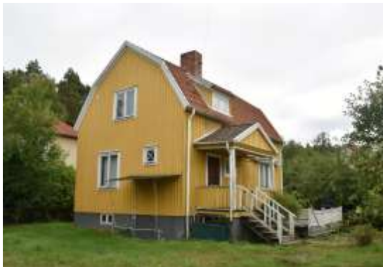
Figur 14. Lillskogen 46, sedd från tomten