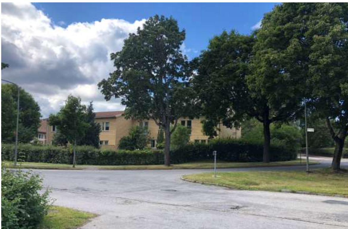
Figur 4. Radhus i kvarteret Ålderdomshemmet. Byggnadskropparna är uppförda med förskjutning i sidled och har fått en indragen placering på tomten. Byggnadshöjd och arkitektur har anpassats till områdets karaktär.