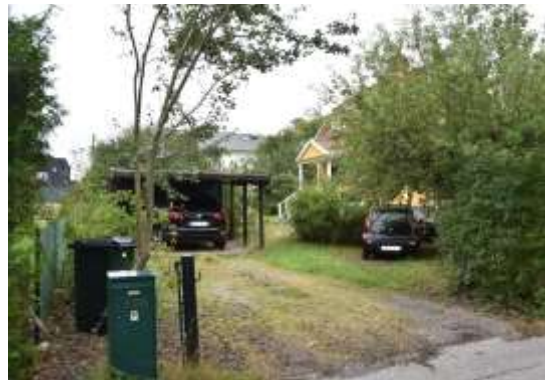
Figur 15. Lillskogen 46, sedd från Bromma kyrkväg.

Den inre delen av tomterna i kvarteret Lillskogen avseende tomt 5, 45 och 46 består i dag av enfamiljshus på stora tomter, se ovanstående fotografier.