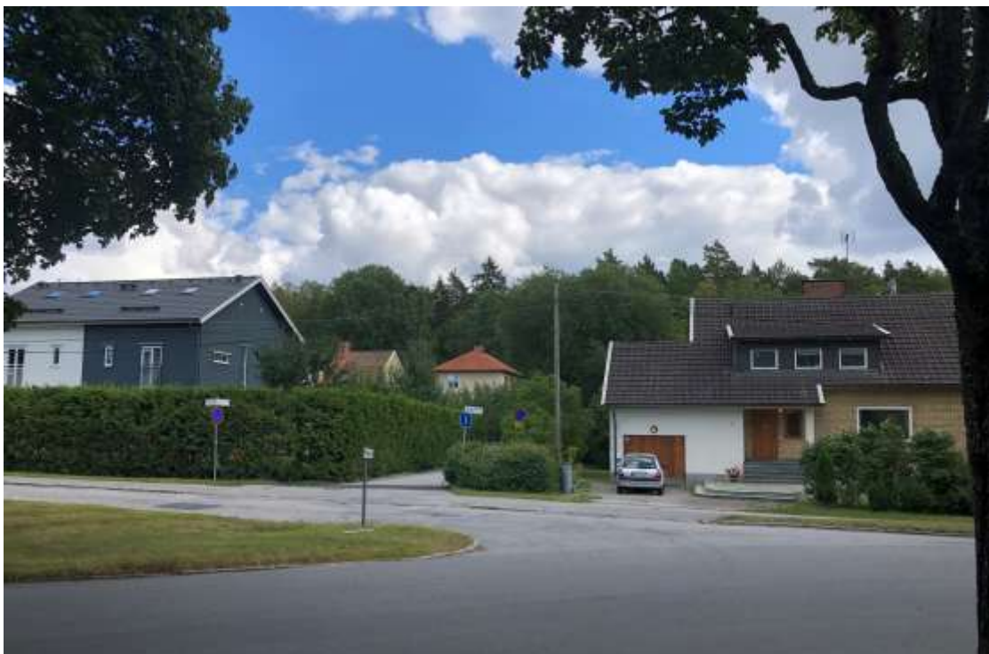
Figur 8. Utsikt in mot kvarteret Lillskogen. Bakom nybyggda parhus skymtar två äldre villor som enligt förslaget kommer att rivas. Till höger i bild ses Lillskogen 42, villa uppförd 1955.