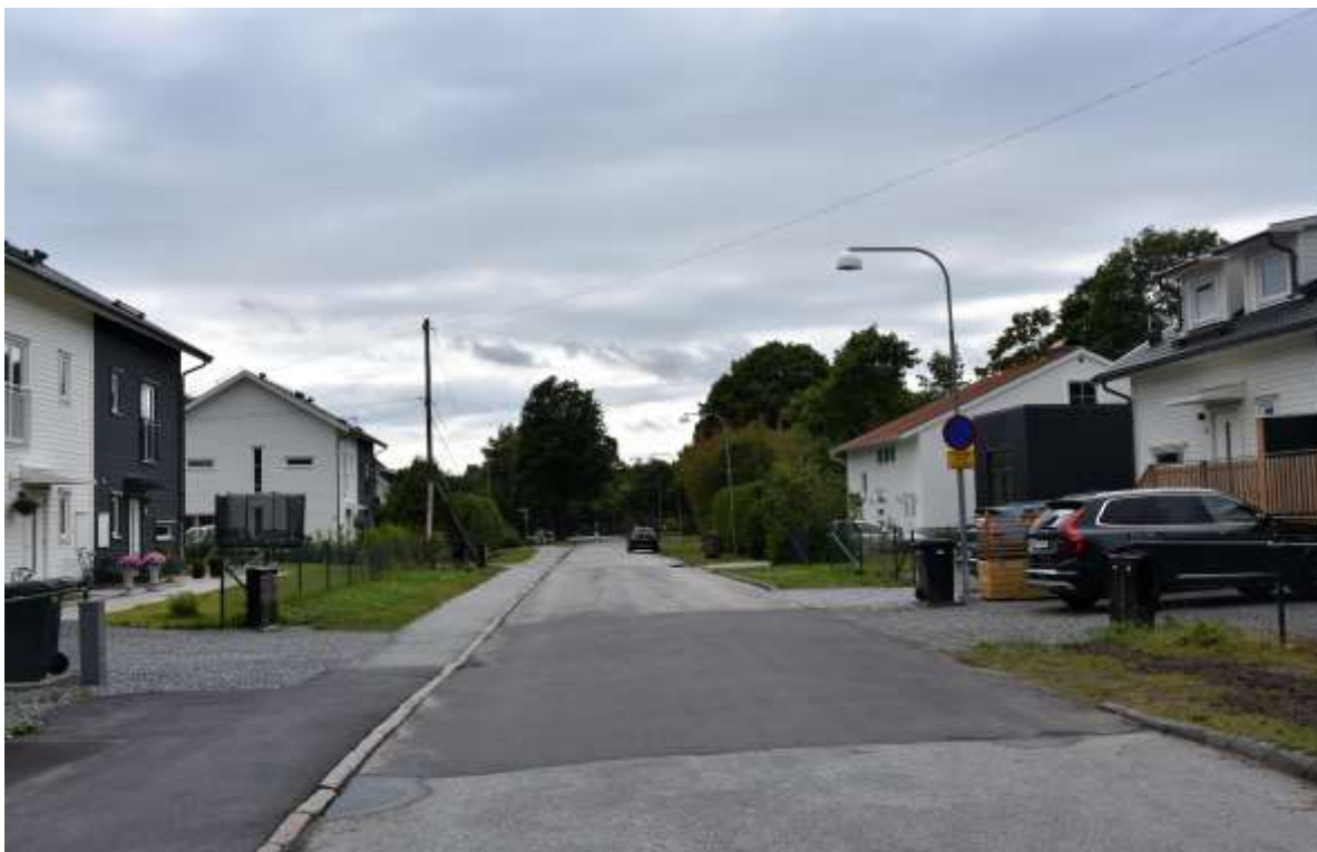
Figur 6. Attundavägen utsikt mot söder, mot Spångavägen. På vänster sida ses nybyggda parhus i kvarteret Lillskogen. Till höger i bild ses nybyggt parhus i kvarteret Prebendet 17.