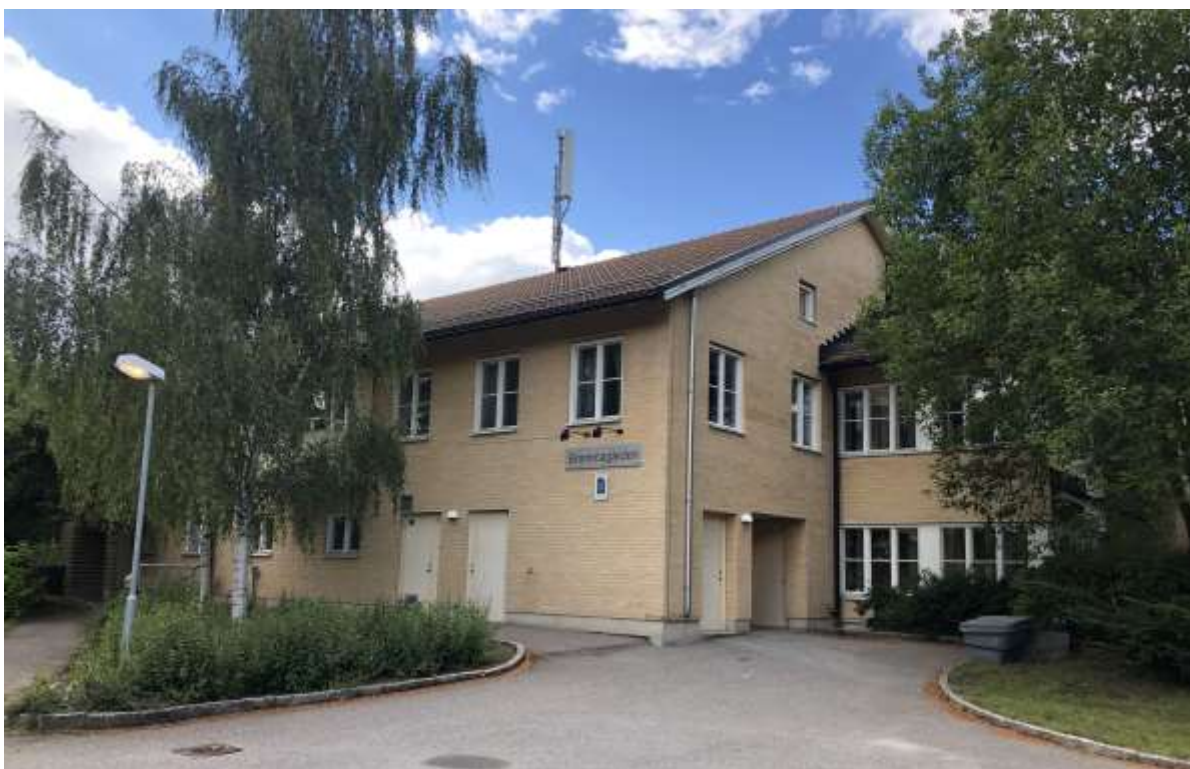
Figur 5. Brommagården har en långsträckt byggnadsvolym, vilket inte riktigt ses på detta fotografi.