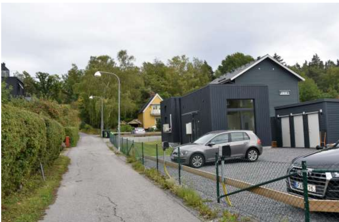
Figur 9. Lillskogsgränd sedd från Attundavägen. Bakom nybyggda hus skymtar Lillskogen 5, villa uppförd 1921. Till vänster i bild skymtar Lillskogen 68. Villa med svart träpanel som uppförts på 2000-talet.