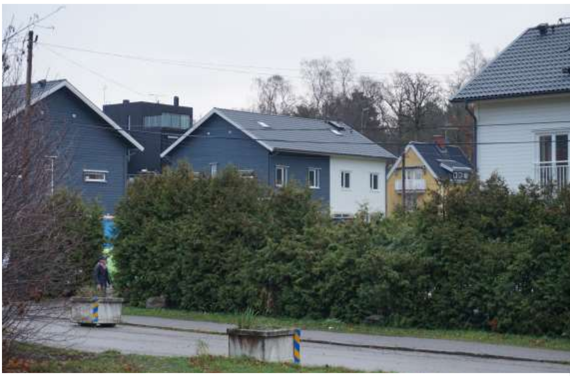
Figur 7. Utsikt mot kvarteret Lillskogen. På höjden ses en villa med svart fasadpanel och plant tak, tillkommen på 2000-talet. En antikvarisk reflektion angående den nybyggda villan, är att den har ett allt för dominerande uttryck i området.