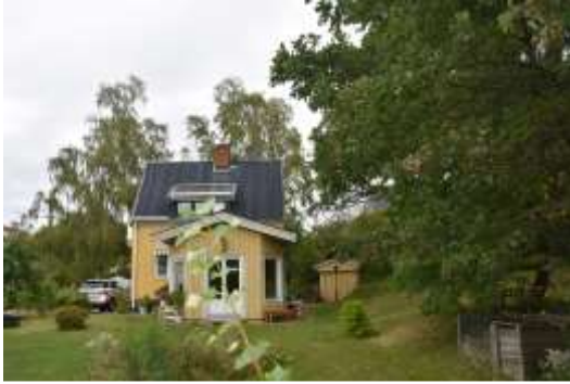
Figur 10. Lillskogen 5, sedd från tomten.