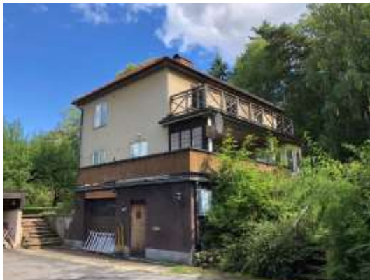
Figur 12. Lillskogen 45, sedd från Bromma kyrkväg.