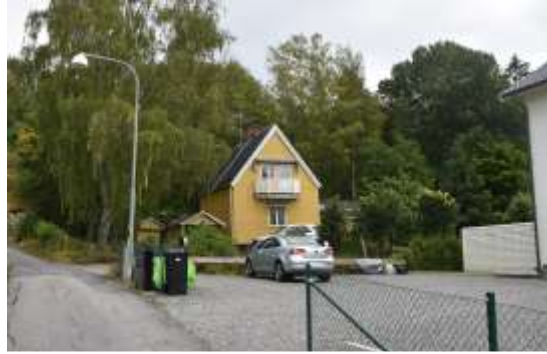
Figur 11. Lillskogen 5. Sedd från Lillskogsgränd.