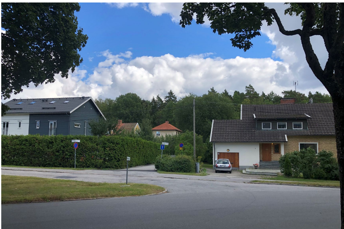
Figur 8. Utsikt in mot kvarteret Lillskogen. Bakom nybyggda parhus skymtar två äldre villor som enligt förslaget kommer att rivas. Till höger i bild ses Lillskogen 42, villa uppförd 1955.