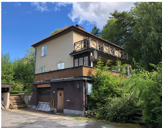
Figur 12. Lillskogen 45, sedd från Bromma kyrkväg.