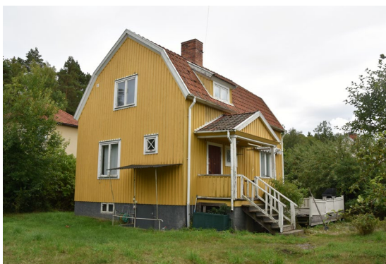
Figur 14. Lillskogen 46, sedd från tomten