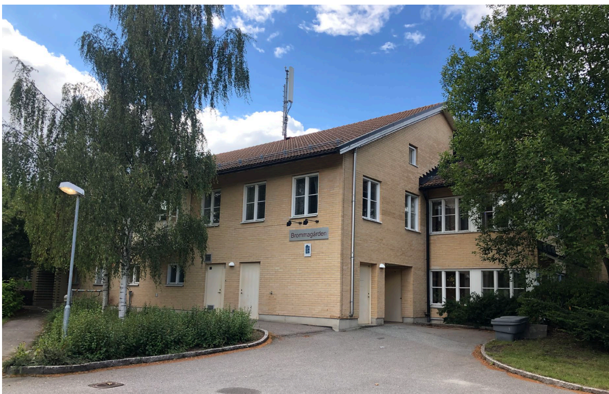
Figur 5. Brommagården har en långsträckt byggnadsvolym, vilket inte riktigt ses på detta fotografi.