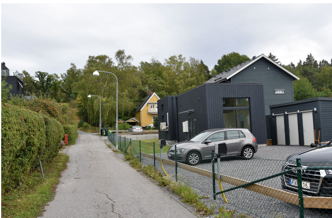
Figur 9. Lillskogensgränd sedd från Attundavägen. Bakom nybyggda hus skymtar Lillskogen 5, villa uppförd 1921. Till vänster i bild skymtar Lillskogen 68. Villa med svart träpanel som uppförts på 2000-talet.