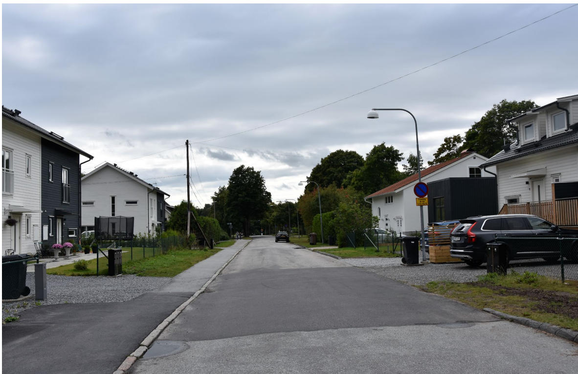
Figur 6. Attundavägen utsikt mot söder, mot Spångavägen. På vänster sida ses nybyggda parhus i kvarteret Lillskogen. Till höger i bild ses nybyggt parhus i kvarteret Prebendet 17.