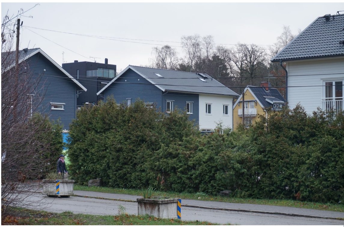
Figur 7. Utsikt mot kvarteret Lillskogen. På höjden ses en villa med svart fasadpanel och plant tak, tillkommen på 2000-talet. En antikvarisk reflektion angående den nybyggda villan, är att den har ett allt för dominerande uttryck i området.