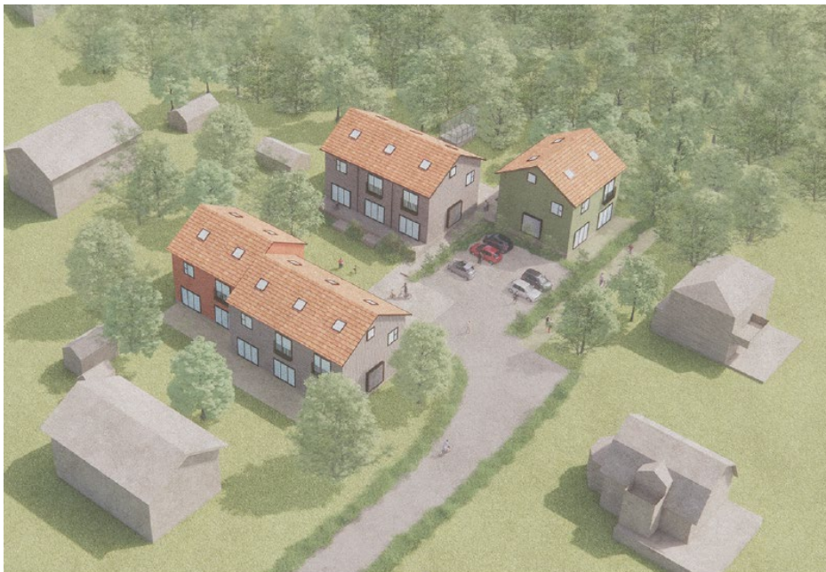
Illustration flygvy som visar hur nya radhus förhåller sig till befintlig bebyggelse.

Situationsplanen visar befintliga träd som sparas samt ny växtlighet.