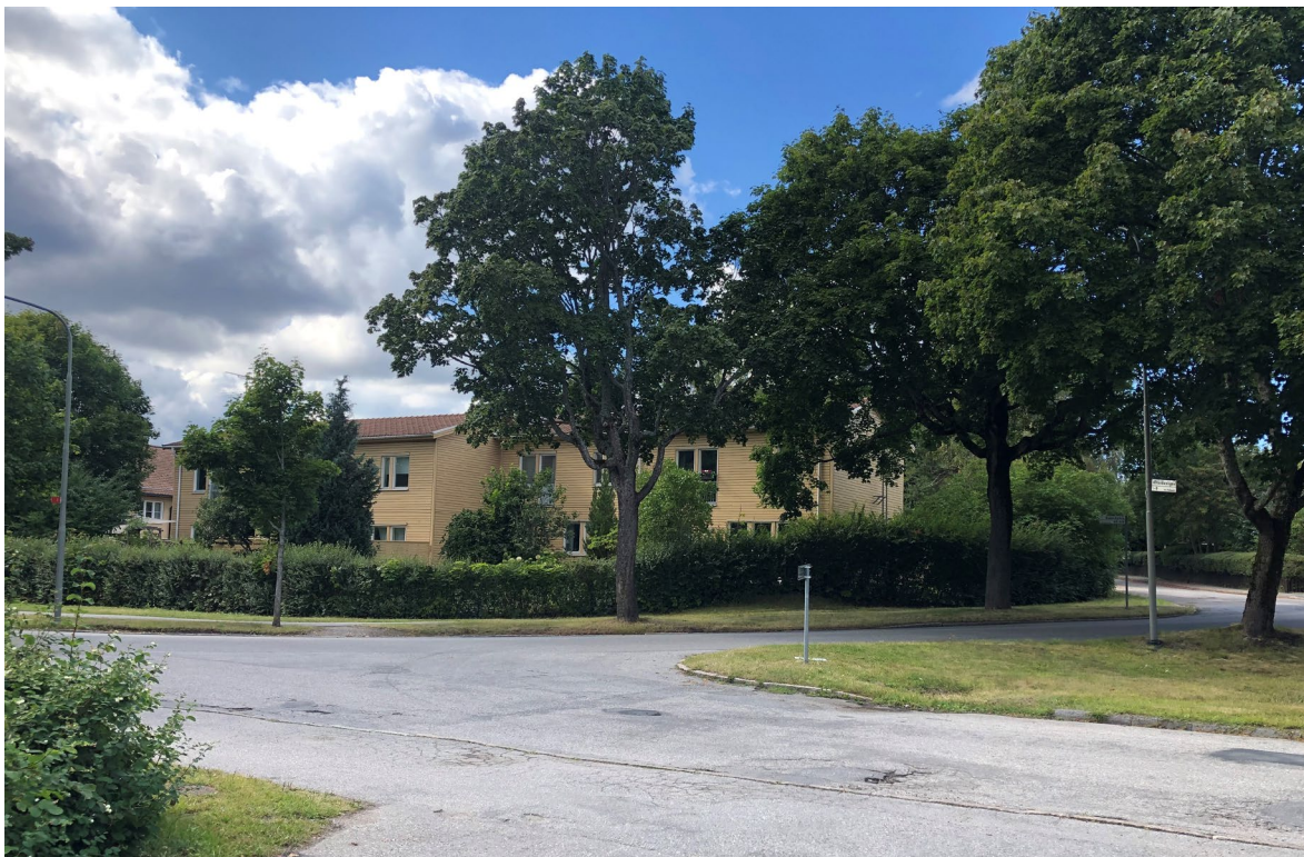
Figur 4. Radhus i kvarteret Ålderdomshemmet. Byggnadskropparna är uppförda med förskjutning i sidled och har fått en indragen placering på tomten. Byggnadshöjd och arkitektur har anpassats till områdets karaktär.