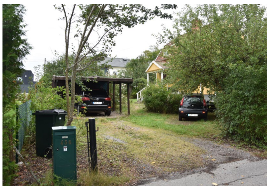
Figur 15. Lillskogen 46, sedd från Bromma kyrkväg.

Den inre delen av tomterna i kvarteret Lillskogen avseende tomt 45 och 46 består i dag av enfamiljshus på stora tomter, se ovanstående fotografier.