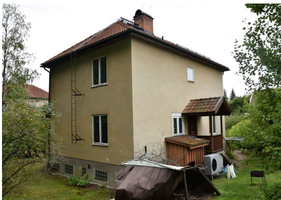
Figur 13. Lillskogen 45 sedd från tomten.