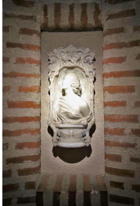
Inmurade byggnadsdetaljer från det rivna Eugeniakapellet, i gårdshuset från 1980-talet.