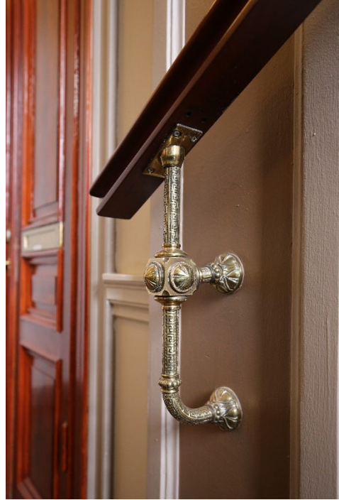
Bevarade byggnadsdetaljer i 1880-talstrapphuset.