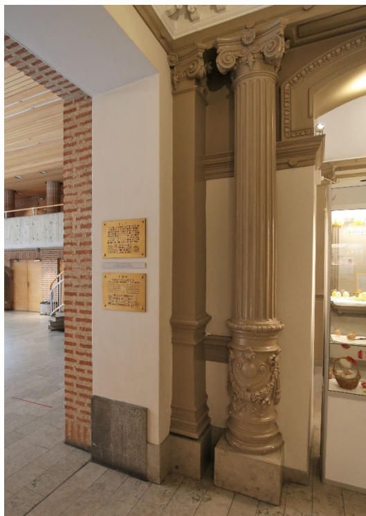
Hanteringen av hur de båda byggnadskropparna från två olika tider hanterats berättar om en tid när ytterligare rivningar i Stockholms stadskärna blivit en omöjlighet.