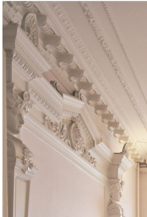
Bevarade byggnadsdetaljer i 1880-paradrummen i gathuset.