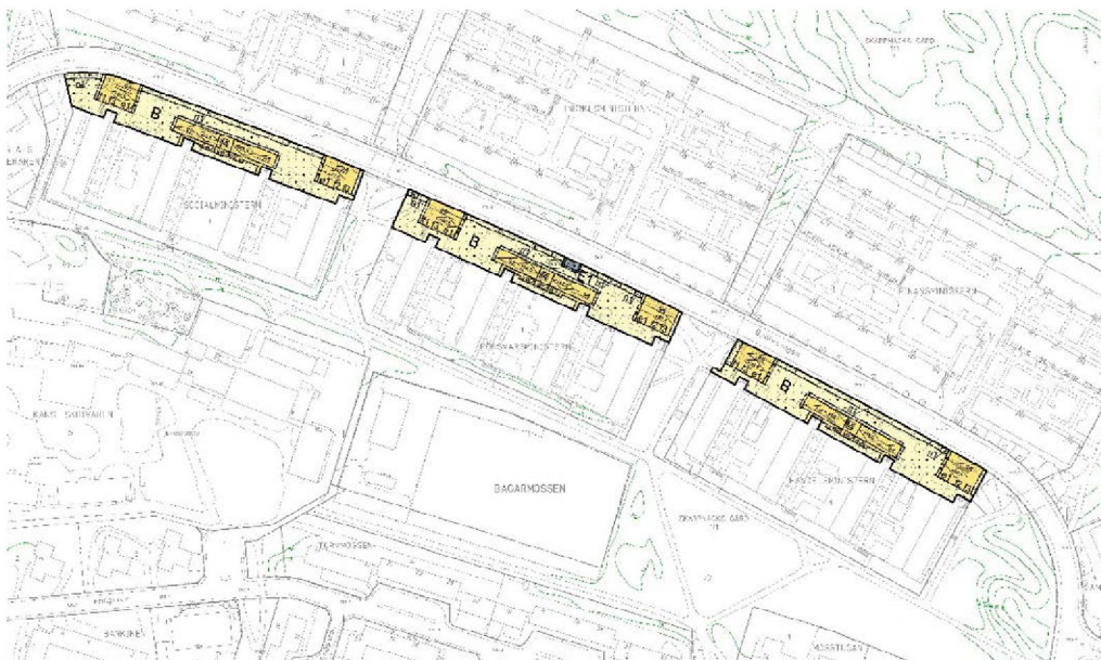
Utsnitt ur Plankarta, samrådshandling, daterad 2021-11-09.

Punkthusen uppförs som fristående volymer och placeras i kvartershörn fram till fastighetsgränsen. Loftgångshusen placeras med indrag från gatan och motbyggs de två mittersta loftgångshusens trapphustorn i varje kvarter. Det innebär att en gård i varje kvarter sluts mot Byälsvägen medan öppenheten genom de två yttersta gårdarna i varje kvarter i huvudsak bibehålls. Loftgångshusen utformas med en bredare portal i bottenvåningarna så att kopplingen mellan gata och gård delvis upprätthålls.