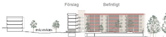
Sektion genom portik på föreslaget loftgångshus på i kvarteret Förvarsministern. (Bild: Vera Arkitekter)

Illustration över planerad bebyggelse, se texter under respektive bild. Vera Arkitekter. Ur Byälsvägen Samrådshandling, daterad 2021-11-09.