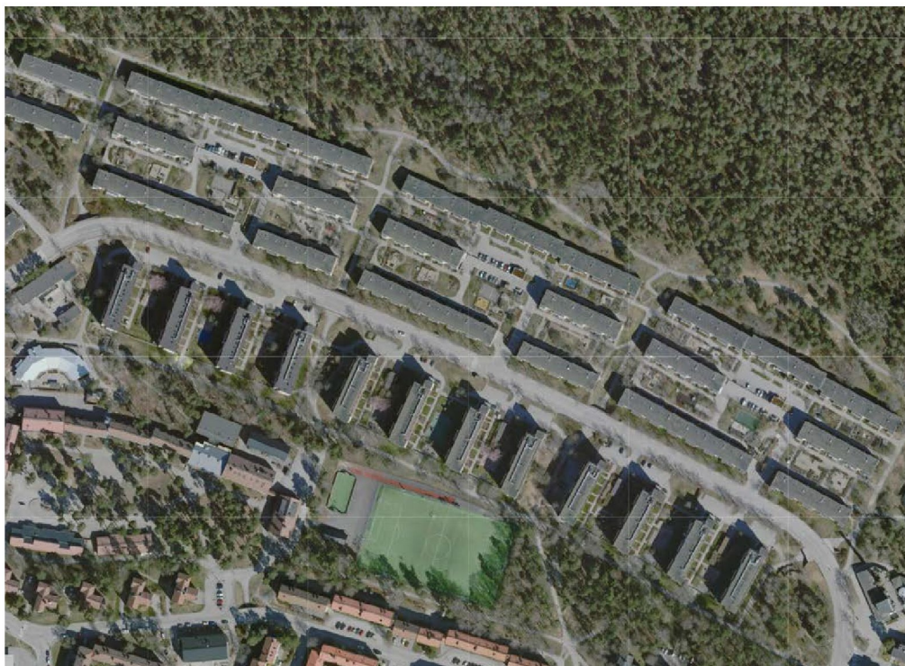
Ortofoto över området som illustrerar områdets enhetliga och välbevarade planstruktur. Byälsvägen centralt i bild i öst-västlig riktning. Aktuellt planområde utgör tre långsmala ytor mellan Byälsvägen och loftgångshusen söder om vägen. Stockholms stad 2020.

Konsekvenser av bedömt planförslag: Det sena 1960-talets rationella planeringsideal som idag är mycket välbevarat och konsekvent genomfört längs Byälsvägen kommer vid genomförande av planförslaget att bli mindre tydligt. Den strama och monotona upprepningen av huskroppar kommer att brytas upp och läsbarheten minska. Samtidigt påverkas endast den norra delen av området mot Byälsvägen och huskompositionen med mellanliggande gårdar och grönstråk kommer från söder inte att förändras. Berättelsen om rekordårens (1960-1975) stadsplanering och byggnad i Bagarmossen, kommer delvis att försvagas.