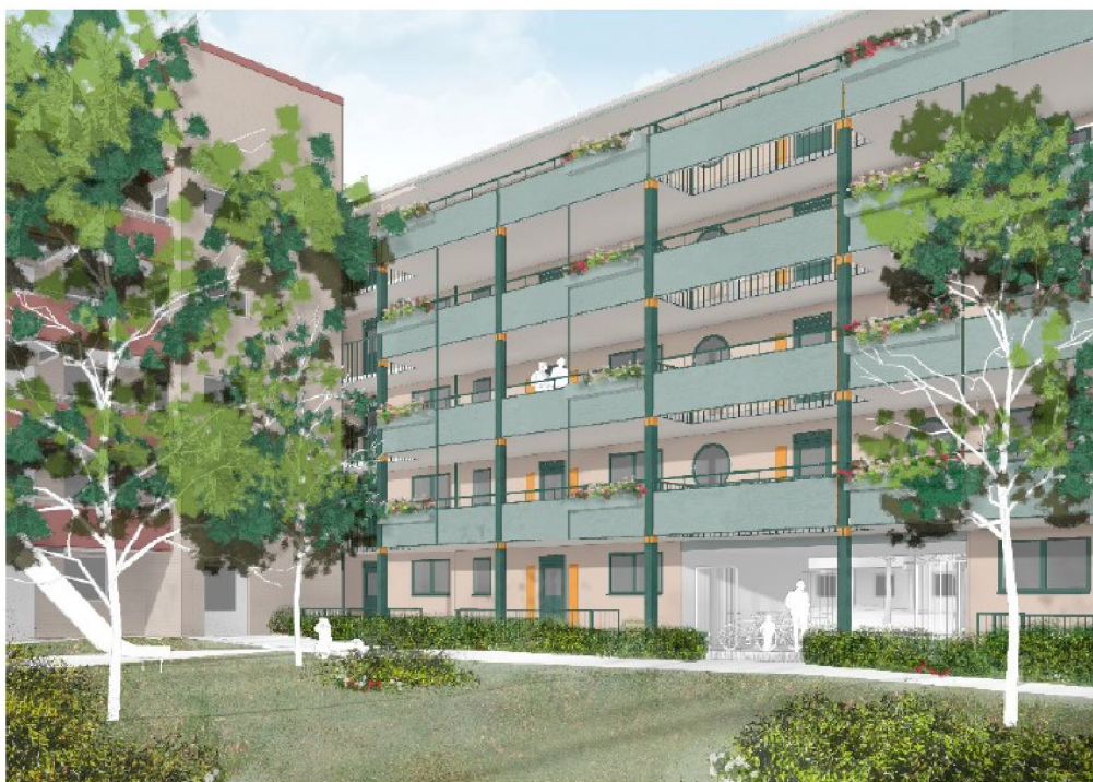
Illustration över föreslaget lamellhus i kv Försvarsministern, vy från gårdsrum. Vera Arkitekter. Ur Byälsvägen Samrådshandling, daterad 2021-11-09.

I planbeskrivningen finns illustrationer av föreslagna byggnader som visar fasader i grov, ljus puts med större färgfält i olika kulörer. Mot gårdar och gavlar är de nya loftgångshusen redovisade med flertalet accentkulörer. I planbeskrivningen föreslås platta tak som medger vegetationstak och solceller, och påbjuder markerade takkrön som relaterar till befintliga byggnaders plåtinklädda krön. Balkonger regleras i planen, bland annat medges ej balkonger mot Byälsvägen. Den ljusa putsen är tänkt att relatera till de befintliga husens kalksandstens-tegel i kulör och ytstruktur. Färgfälten varierar i kulör men ska förhålla sig till kalksandstenen. De färgade putspartierna utförs med en liten livförskjutning i förhållande till den ljusa putsen och utförs jämfört med den ljusa putsen, med en slätare puts. För entréer och öppna hörn föreslås ytor med hårdare, gärna mineralt, material i mörkare kulör, till exempel sten, terrazzo, fibercement eller vackert kakel . Portikerna föreslås kläs in i ett reflekterande material.