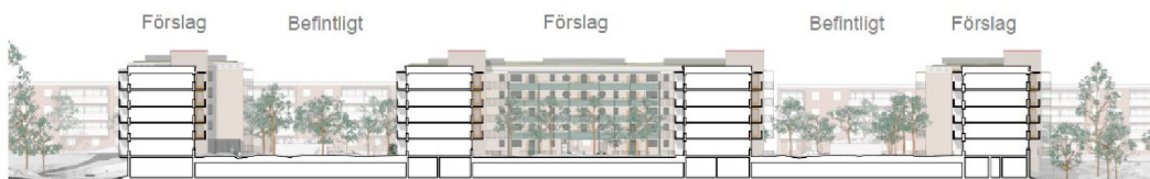
Sektion genom befintlig bebyggelse i kvarteret Förvarsministern. Föreslaget loftgångshus i bildens mitt, föreslagna punkthus till höger och vänster och befintliga bostadshus norr om Byälsvägen i bakgrunden. (Bild: Vera Arkitekter)