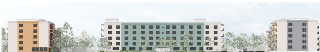
Förslag på fasader mot norr och Byälsvägen på fastigheten Förvarsministern. (Bild: Vera Arkitekter)

Viss ombyggnad av befintliga parkstråk som angränsar till fastigheterna inom planområdet är nödvändig vid ett genomförande. De föreslagna punkthusen innebär att gångstråk och trappor mellan kvarteren och omgivande grönstråk måste ersättas med nya i andra lägen än idag. I granskad handling föreslås också tillgängliga entréer till punkthusen genom källarvåningar i parknivå, vilket innebär utökad hårdgjorda ytor i dessa lägen.