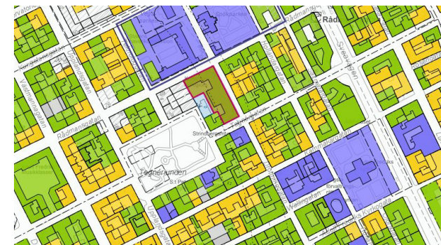
Stockholms stadsmuseums klassificeringskarta. Den aktuella fastigheten är markerad med en röd linje.

Det bör noteras att klassificeringsbeslutet fattades två dagar innan den antikvariska förundersökningen var klar och att beslutet då inte hade nått antikvarierna på White.