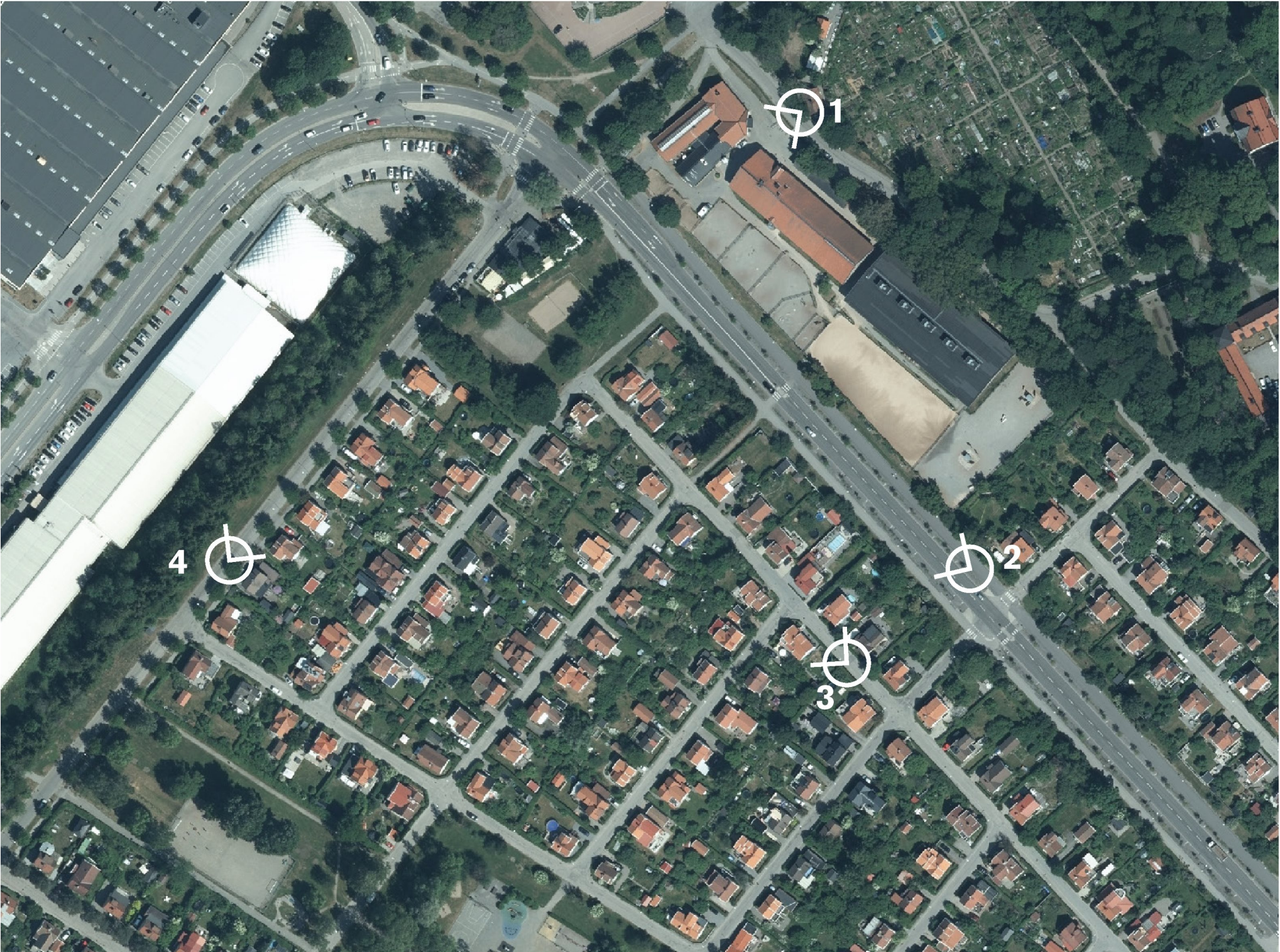
Vyer - placering vid befintlig situation.