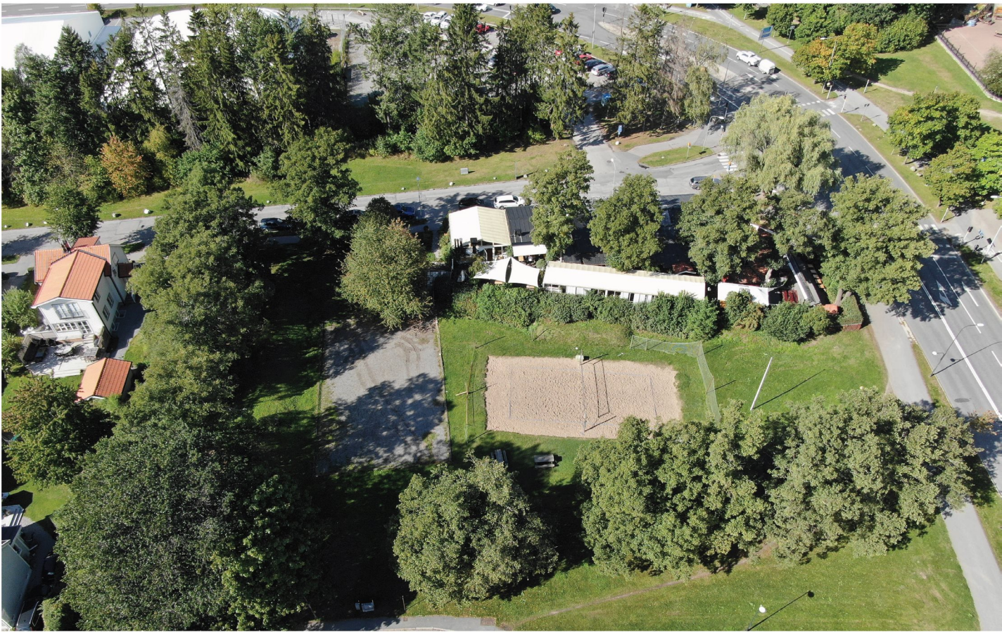
Flygvy över Rättikan 1 mot nordväst. Sockenvägen till höger.

Planförslaget har som ambition, i linje med översiktsplanen, att ge platsen en mer stadsmässig karaktär, vilket kan betraktas som en anpassning till den expolatering som planeras på andra sidan Bägersta byväg. Som ett led i denna inriktning kommer även äldre karaktäristiska träd och den äldre dammens vallar att tas bort. Åtgärderna innebär sammantaget en försvagning av områdets rurala karaktär och en konsekvens blir att platsens historiska koppling till Enskede gård till stor del försvinner. Värde av dessa sammanhang har dock enligt kulturmiljöutredningen reducerats sedan tidigare, dels genom anläggandet av Sockenvägen på 1950-talet dels genom att bränneribyggnaden inte längre finns kvar. Trots negativa konsekvenser kan förslaget accepteras då vissa delar av parken kommer bevaras och vara öppen för allmänheten. Ett antal träd kommer att nyplanteras. Planförslaget bedöms inte påverka områdets planhistoriska värde i någon större utsträckning.