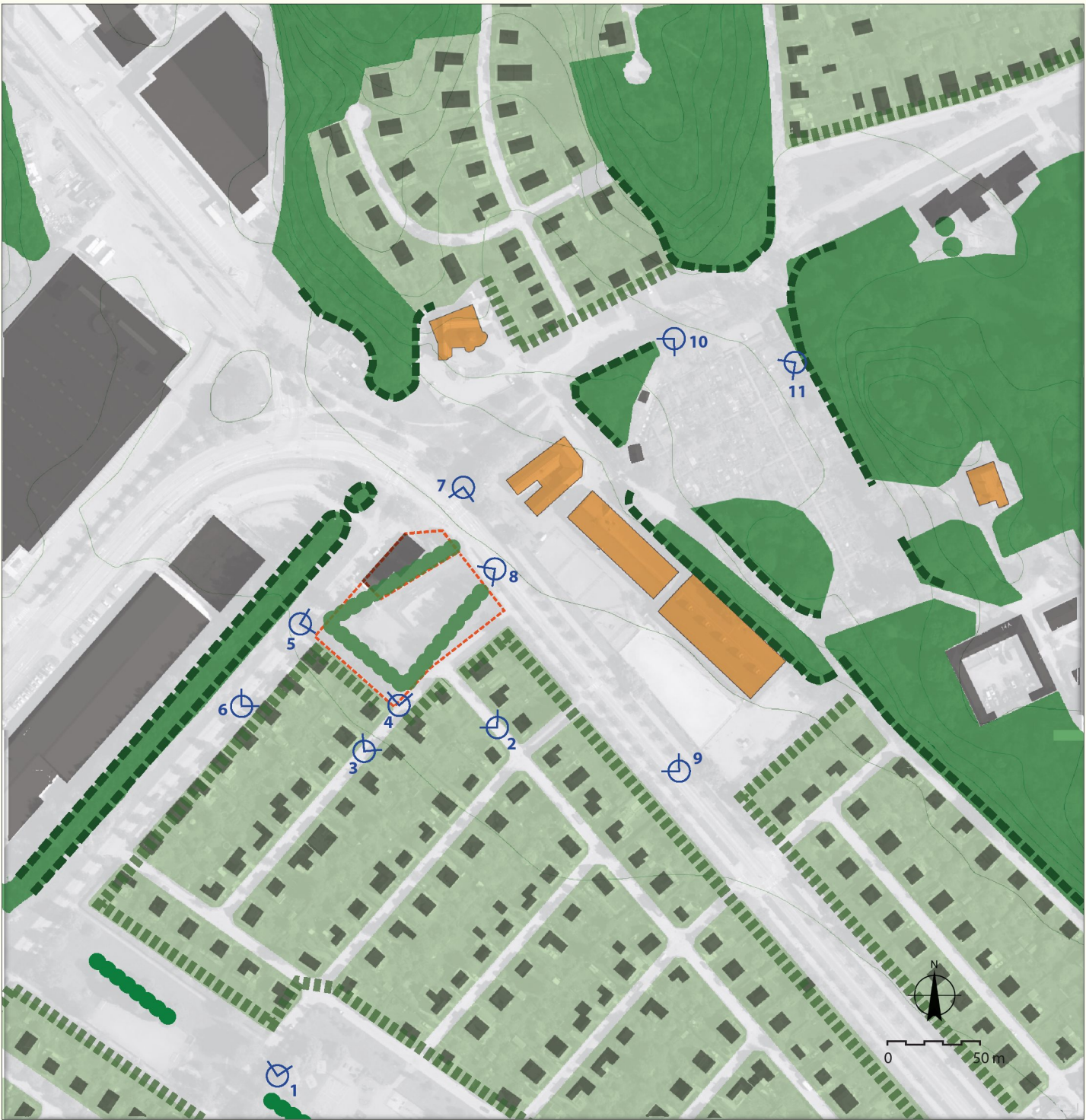
Landskapsstruktur och utblickar

I öster upplevs Enskede ridskolas bebyggelse samt Sankt Sava, serbisk-ortodoxa kyrkan, som bebyggelsefront eller blickfång. Bakom bebyggelsen finns storvuxna solitära träd och skogsbryn vid Enskede gård. Enskedeberget som utgör en grön fond i bakgrunden.