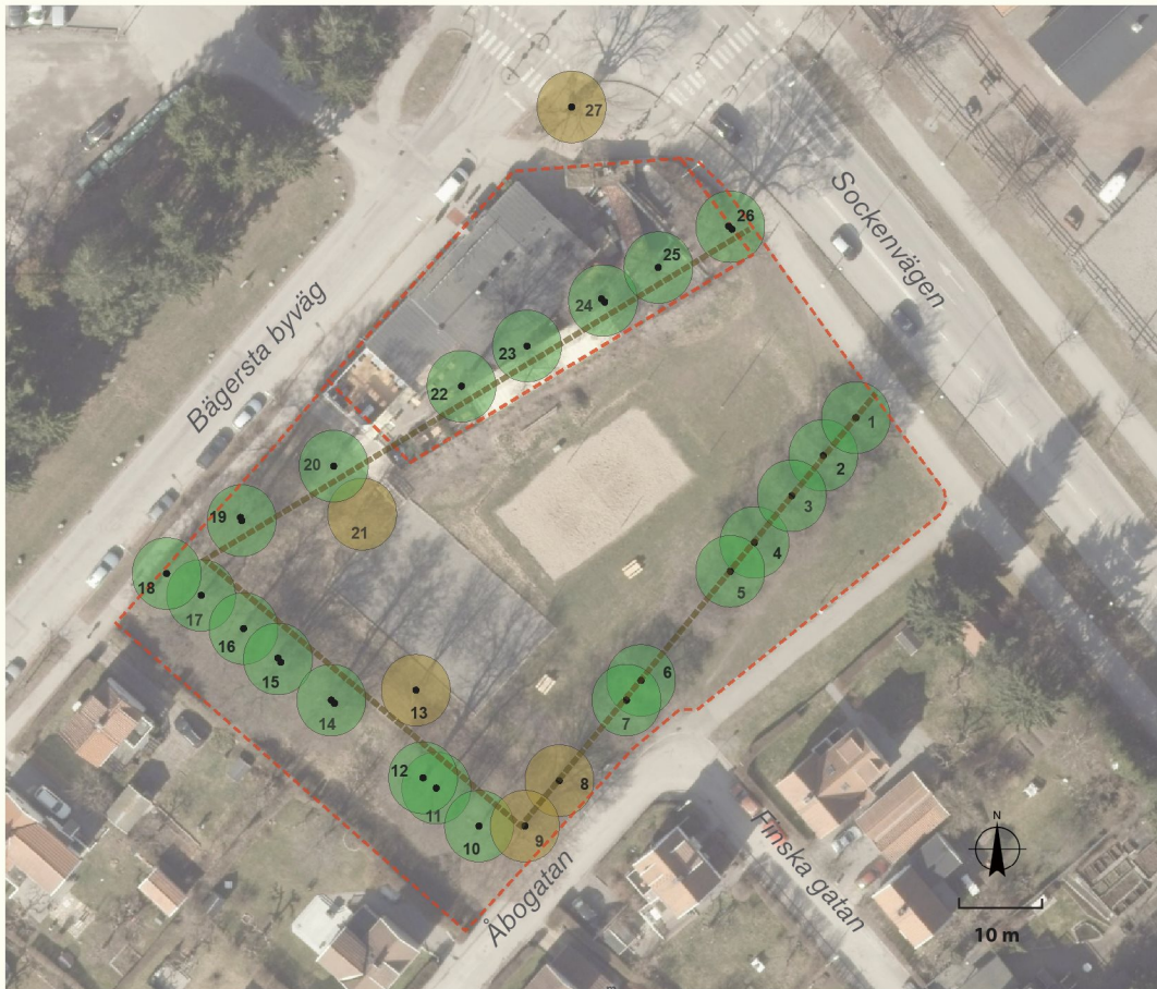
Rättikan 1, trädinventeringskarta

Trädradernas och vallarnas orientering i kombination med den nedsänkta ytan kan upplevas som en återstående del av ett tidigare hydrologiskt system som visuellt kan relateras till Enskede gård på andra sidan Sockenvägen. Den nu torrlagda dammen vittnar om ett tillvaratagande av vatten från det omgivande avrinningsområde via en f.d. bäck utmed Bägerstavägen och kolonilotterna. Bäckravinen är fortfarande avläsbar vid trädgårdsmästarbostaden (Enskede gårdskafé).