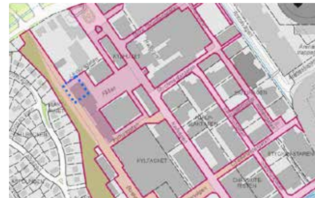
Karta visande fastigheten Johanneshov 1:1 samt berörd plats för föreslagen exploatering markerad med blått.

Det kulturhistoriska värdet som beskrivs i denna analys hanteras i PBL 2 kap 6 § samt PBL 8 kap 13 och 17 §§.