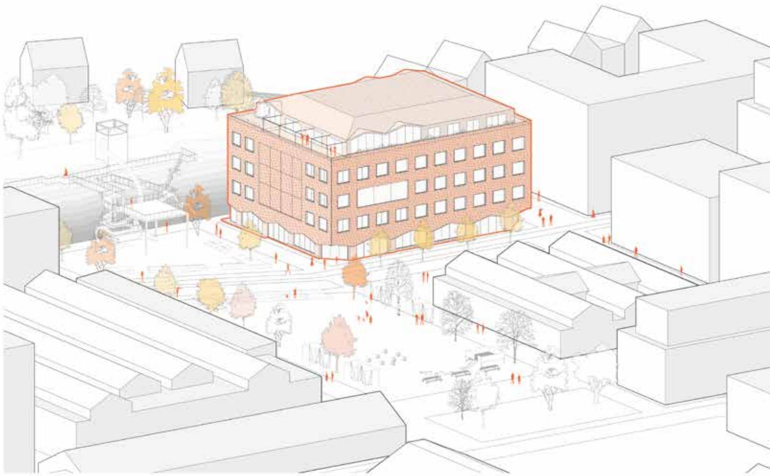
Illustrationen visar föreslagen byggnad med berget i fonden och Fållan i förgrunden.