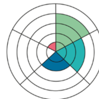
Gradering av platsens kulturhistoriska värden efter planerad byggnation