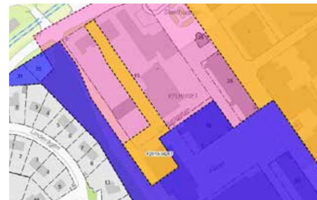
Karta visande pågående planarbeten. Aktuell detaljplan i gult i bildens mitt. Blått område visar området som behandlades under etapp 1.