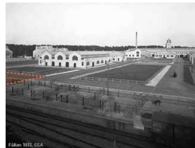
Överst: Slakthusområdet 1910-tal. Bild från Stockholmskällan med placering föreslagen exploatering utritad med orange.