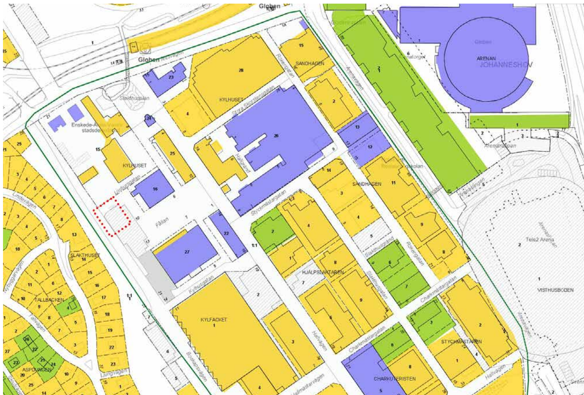
Stockholms stadsmuseums klassificeringskarta. Den föreslagna byggnaden är markerad med en röd prickad linje.