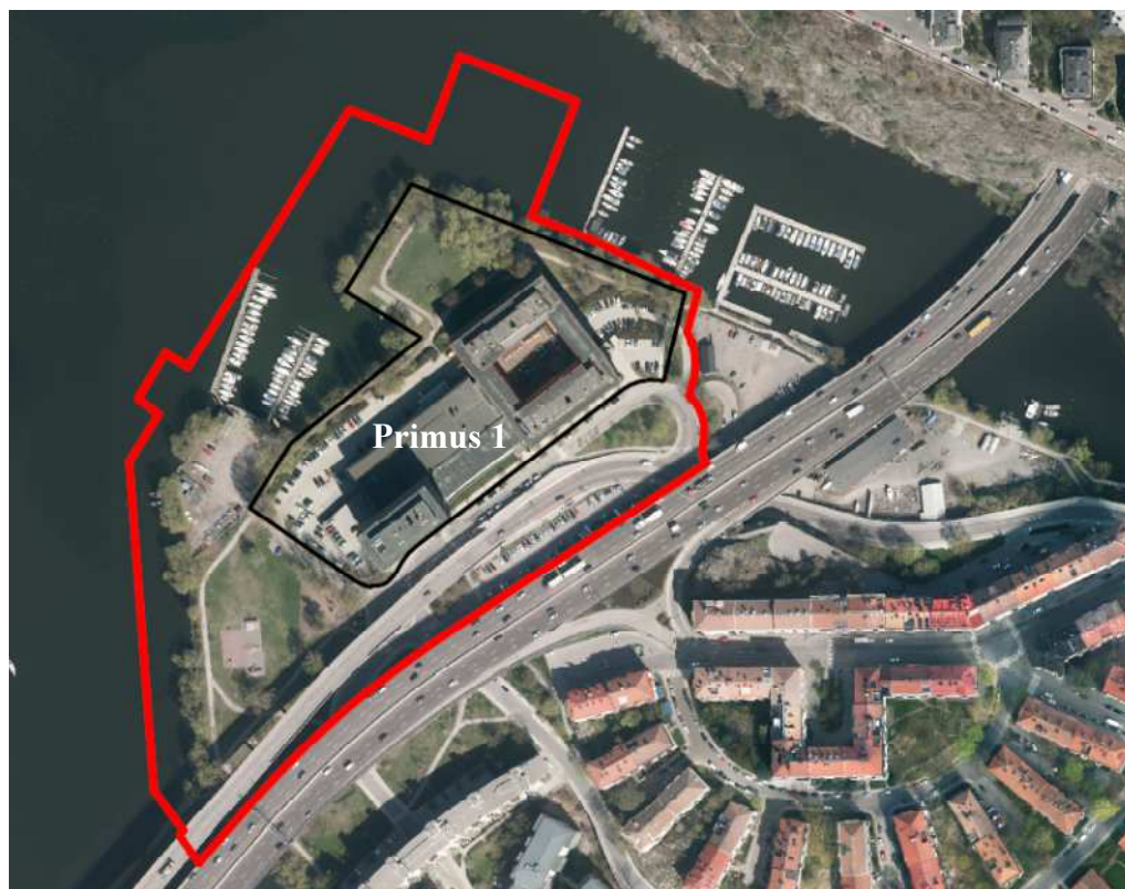
Planområdets avgränsning är markerad i rött. Primusfastighet är markerad i svart.

Stockholms stad yrkar att länsstyrelsen förordnar att område som ska ingå i detaljplan för Primus 1 mm i stadsdelen Lilla Essingen, S-Dp 2006-05021, inte ska omfattas av strandskydd.