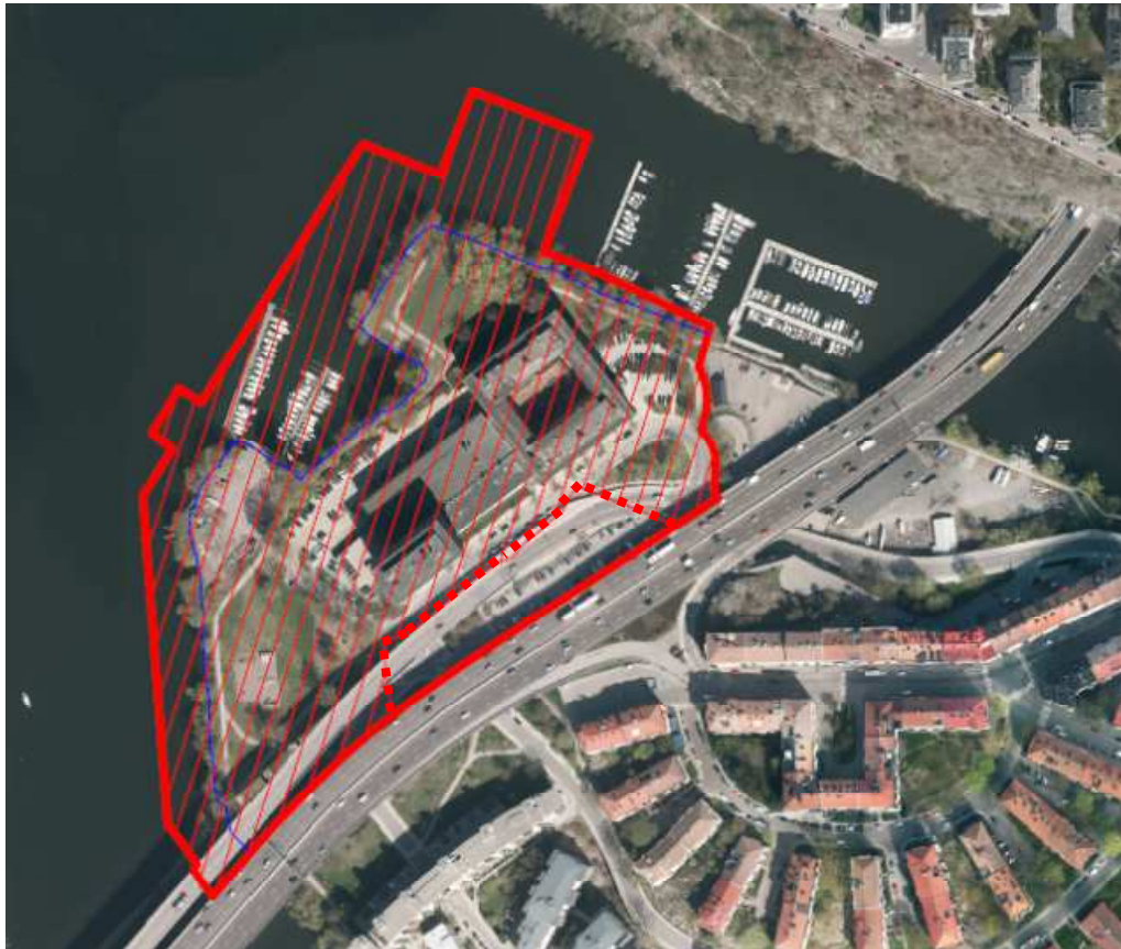
Avgränsning av strandskydd inom planområdet, 100 meter från strandlinjen. Strandskydds kommer att inträda inom skrafferat område.

Ansökan avser alla delar av aktuell detaljplan som ligger inom 100 meter från strandlinjen, på land och i vatten. Det gäller även områden för allmän plats parkmark. Motivet är att anordningar för friluftslivet annars kan behöva separata dispensprövningar, även vid t.ex. flyttning av anordningarna. Markanvändningen park säkerställer att andra slags anordningar inte kan tillkomma.