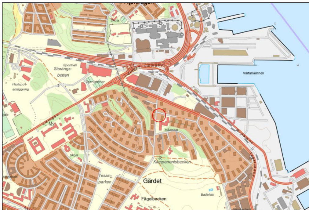
Figur 1. Lokalisering av den undersökta fastigheten Rio 7, inringad med rött (VISS, 2018).