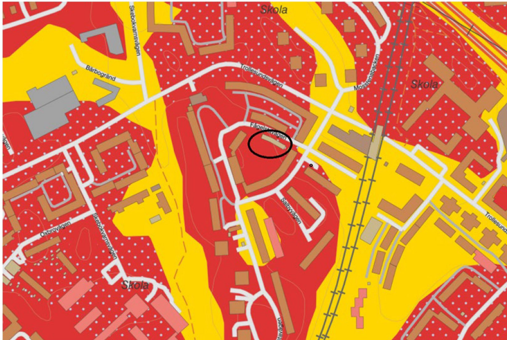
Figur 3. Karta med undersökningsområde markerat med röd cirkel (SGU Kartvisaren 2020 rött: urberg, rött med ljusblå prickar: tunt moräntäcke på berg, gult: postglacial lera)

Enligt SGU:s kartvisare utgörs den dominerande ytjorden av urberg utan jordtäckelse eller urberg med tunt och osammanhängande moräntäckelse. I lägre liggande partier, som strax nordöst om undersökningsområdet förekommer större områden med glacial lera (Figur 3).