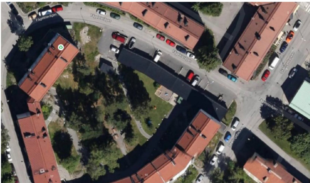
Figur 2 Flygfoto över undersökningsområdet.