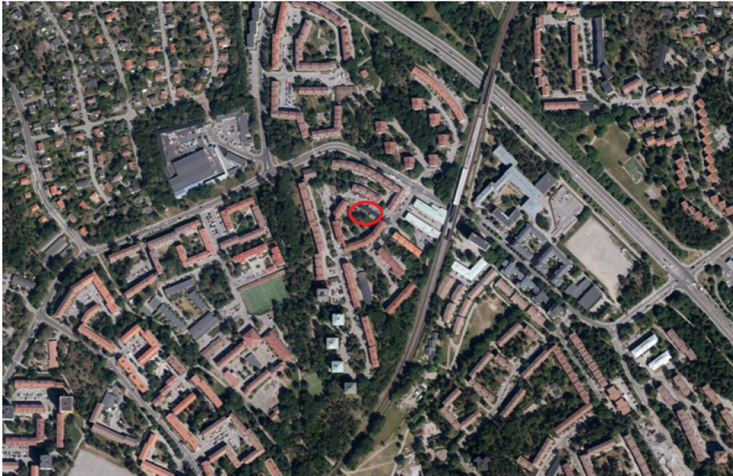
Figur 1 Översiktskarta vilken visar var undersökningsområdet är lokaliserat, se det rödmarkerade området.