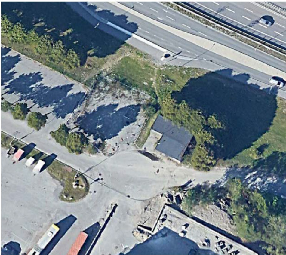
Fastighet Köping 2