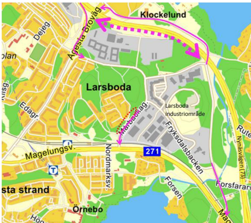
Figur 4.1. Heldragna pilar visar möjliga vägar in och ut ur Larsboda industriområde idag. Bred streckad linje visar en framtida planerad väg in i industriområdet. Aktuellt exploateringsområde är markerat med röd streckad linje. Inom närområdet är det endast Nynäsvägen som är klassad som en transportled för farligt gods.

Beroende på vilka tillkommande verksamheter som planeras inom industriområdet så kan det tillkomma transporter av farligt gods till och från området. Utifrån genomförd kartläggning av befintliga verksamheter samt bedömningen av möjliga framtida verksamheter görs bedömningen att antalet farligt godstransporter till och från verksamheter är relativt begränsat och inte kommer att öka i någon större omfattning vid en utbyggnad av industriområdet. Det bedöms framförallt röra sig om transporter av lösa behållare. Det bedöms inte förekomma några verksamheter som hanterar brandfarliga varor i sådan utsträckning att de genererar stora, frekvent förekommande, farligt godstransporter.