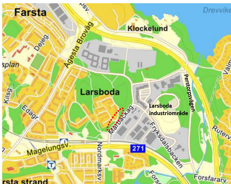
Figur 3.1. Spjutsö (röd ring) och den närmaste omgivningen.

Det aktuella området ligger i Farsta i södra Stockholm och omfattar delar av fastigheten Farsta 2:1. Området ligger på den västra sidan av Mårbackagatan på båda sidor om Persbergsbacken, se figur 3.1.