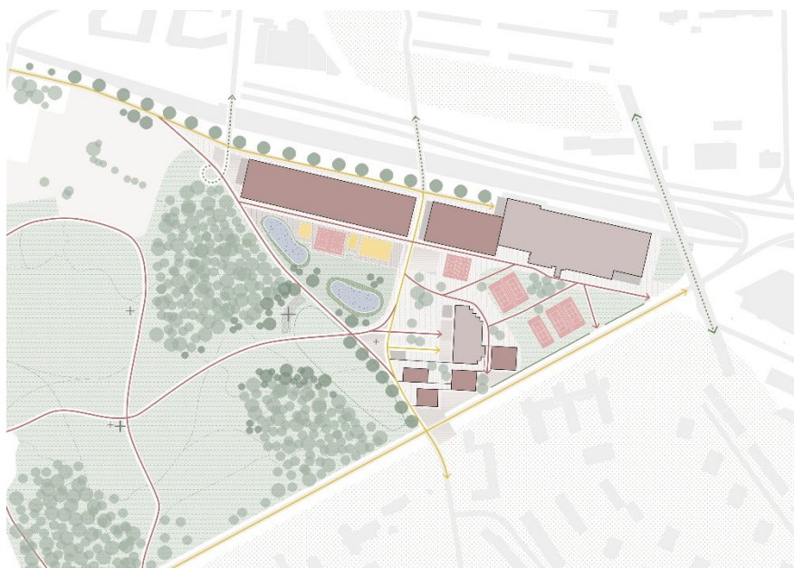
Storänsbotten från sydost, schematisk illustration av tänkt disposition.

Planområdet är anslutet till kommunalt ledningsnät för vatten och avlopp. Enligt solkartan har området mycket sol och skulle passa bra för solpaneler.