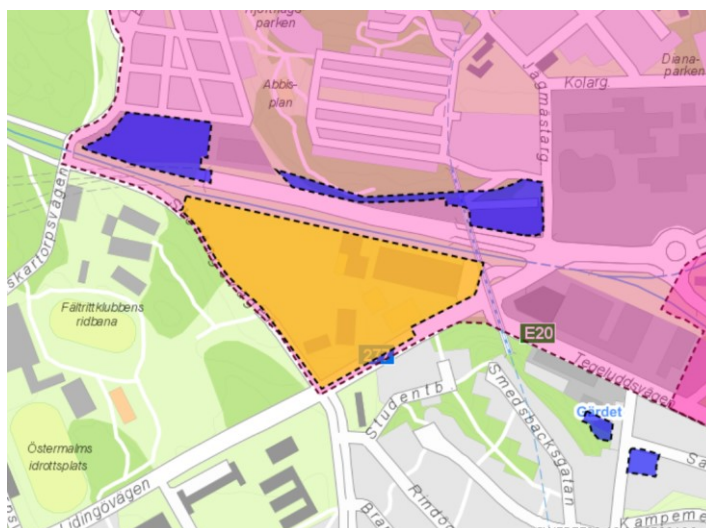
Karta som visar planområdets avgränsning i gult, samt angränsande pågående detaljplaner eller program. Planområdet ligger inom Norra Djurgårdsstadens stadsutvecklingsområde.

Endast en liten del av området, i den östligaste delen, omfattas av detaljplan, Dp 2004-05426 som reglerar trafikplatsen vid Hjorthagen. Merparten av området, den obebyggda delen, omfattas inte av någon detaljplan. Den östra delen av området omfattas av områdesbestämmelser Ob 87032, reviderad 1989, som innebär en utökad lovplikt för vissa åtgärder, fasadändringar, rivning mm. inom Nationalstadsparken.