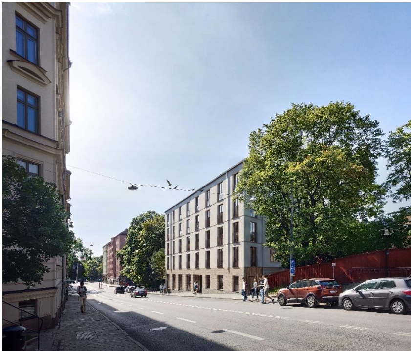
Det planerade huset sett från Renstiernas gata norrifrån (Belatchew arkitekter).

Möjlighet till boendeparkering för bil ordnas i Stigbergsgaraget, cirka 600 meter från planområdet, med ett lägesbaserat parkeringstal (cirka 0,4 platser per lägenhet). Föreslagen ny bebyggelse ska anordna cirka 90 cykelplatser i källarvåningen, vilket motsvarar cirka fem cykelparkeringsplatser per lägenhet.