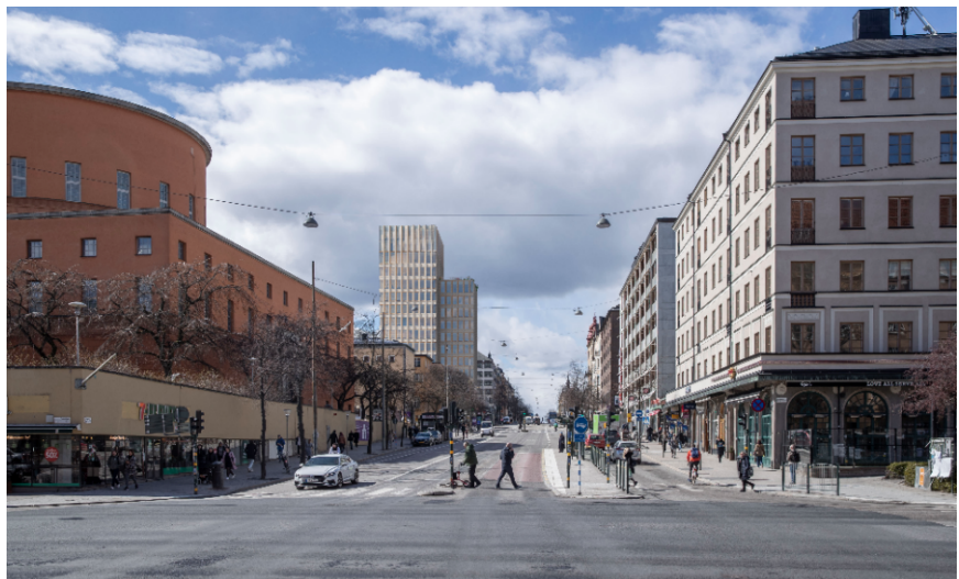
Volymstudie, planförslaget sett från nordöst/Odengatan (vy punkt 5). White och Koponen Stenqvist, 2024

Den högre delvolymen har placerats in mot kvarterets mitt. Syftet är att placeringen ska minimera skuggverkan och vara gynnsam för mikroklimatet för närliggande bebyggelse och allmän plats.