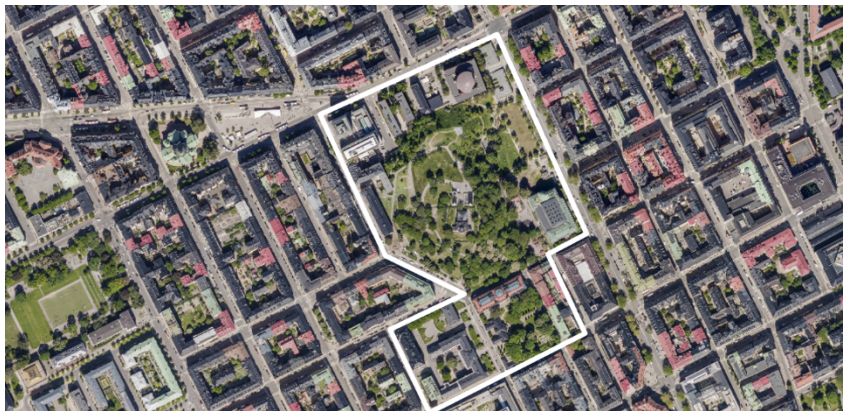
Flygfoto, värdekärna Stockholms gamla högskoleområde – omkring Observatorielunden markerad med vit linje.

I riksintresset ingår även enskilda miljöer, så kallade värdekärnor, som på olika sätt vittnar om stadens utveckling. Planområdet ligger inom värdekärnan för Stockholms gamla högskoleområde omkring Observatorielunden. I området ingår bland annat Stockholms Observatorium från 1750-talet samt den första Tekniska högskolan, Handelshögskolan och Stadsbiblioteket som är uppförda under 1920-talet.