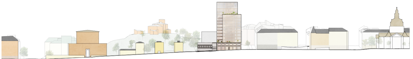
Elevation genom Odengatan som redovisar planförslagets höjder och kulörtoner i relation till närliggande bebyggelse, exempelvis Stadsbiblioteket (t.v. om planförslaget i bild) samt Gustav Vasa kyrka (t.h. om planförslaget i bild). Visionsbild White och Koponen Stenqvist, 2024.

Den arkitektoniska idén togs fram i ett parallellt uppdrag. Efter det parallella uppdraget bearbetades förslaget inför samrådet och sänktes med två våningar för att bättre ta hand om anpassningar i relation till stadsbild och stadssiluett.