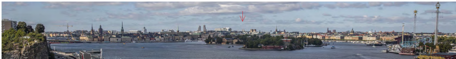
Vy från Fåfången på Södermalm. Planförslaget och dess påverkan på stadsbilden (röd pil). White White och Koponen Stenqvist, 2024

I yttrandena från granskningen kvarstod synpunkter från enstaka remissinstanser att byggnadskropparna behöver bli lägre. Det förekom även yttranden från remissinstanser som berörde tekniska och logistiska frågor i planförslaget. Länsstyrelsen yttrade sig endast gällande föreslagen dagvattenhantering i planförslaget.