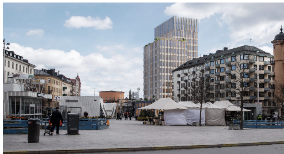
Volymstudie, planförslaget sett från Odenplan/Gustav Vasa kyrka (vypunkt 1). White och Koponen Stenqvist, 2024

För att öka upplevelsen av slankhet och vertikalitet har högdelen delats upp i två delvolymer med olika höjder. Den lägre delen av dessa relaterar i höjd till det befintliga läkarhusets takfotshöjd. Den högre volymen är ca 11 meter högre än dagens hisstoppshöjd.