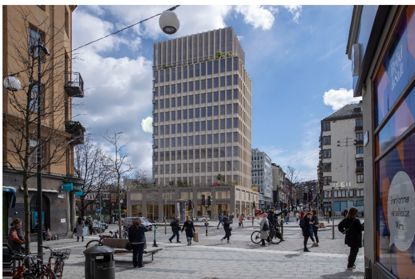
Volymstudie, planförslaget sett från norr/Norrtullsgatan (vy punkt 4). White och Koponen Stenqvist, 2024

Planförslaget innebär att en ny byggnad uppförs vid korsningen Odengatan/Norrtullsgatan, som ersättning för dagens läkarhus. Den nya byggnaden föreslås fortsatt utgöra ett landmärke vid Odenplan, en av stadens viktigaste infrastrukturnoder.