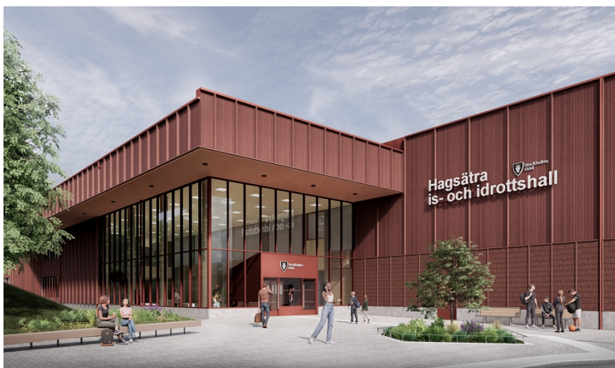
Huvudentrén orienteras mot idrottsplatsen och utformas med generösa glaspartier för ett välkomnande uttryck. Illustrationer: Cedervall Arkitekter.

Is- och idrottshallens utformning ska tydligt spegla byggnadens funktion och ges en lokal förankring genom att ta fasta på stadsdelens bärande karaktärsdrag. Karaktärsgivande för befintlig bebyggelse i stadsdelen är framförallt dess enkla och enhetliga uttryck samt de dova och jordnära kulörerna. Stadsdelens publika byggnader håller generellt en hög arkitektonisk kvalitet och har tillåtits sticka ut i stadsbilden genom avvikande material, framförallt tegel.