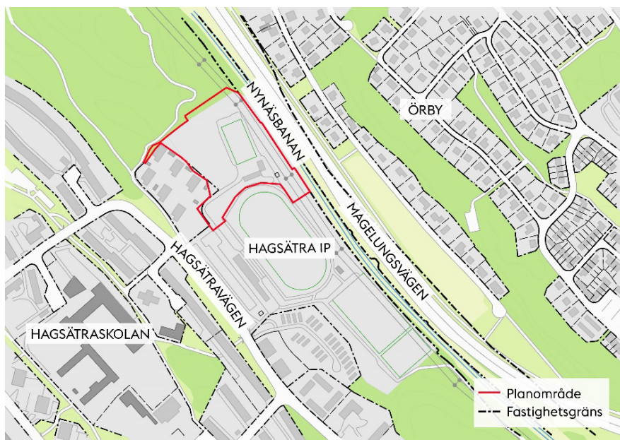
Karta som visar planområdets läge och preliminära avgränsning.

Planområdet ligger i den norra delen av Hagsätra idrottsplats och omfattar del av fastigheterna Älvsjö 1:1, Älvsjö 1:7 och del av fastigheten Kolargossen 1. Planområdet angränsar till Nynäsbanan och Magelungsvägen i nordöst, naturmark i väst och norr samt befintlig idrottsanläggning i söder. Planområdet omfattar cirka 1,8 hektar.