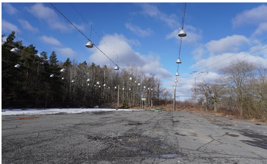
Mark som är aktuell för exploatering består i huvudsak av en öppen, flack och hårdgjord yta som tidigare använts som isrink. Parallellt med Nynäsbanan (till höger i bild) går en luftledning som avses avvecklas under hösten 2024.