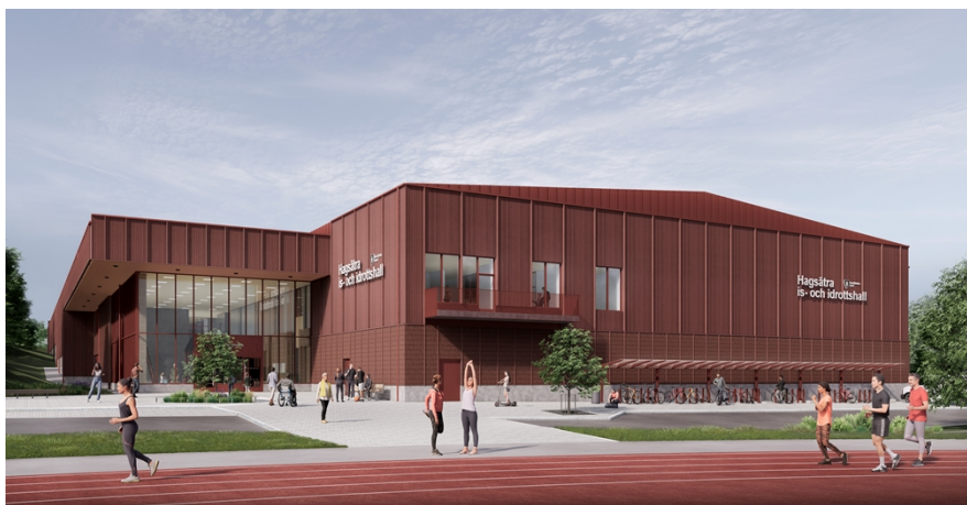
Byggnaden skapar genom sin placering en nordlig inramning av idrottsplatsen. Genom byggnadens placering bibehålls idrottsområdets öppenhet och historiskt viktiga siktlinjer, exempelvis från Hagsätravägen, över idrottsplatsen och vidare till Örby. Illustration: Cedervall Arkitekter.