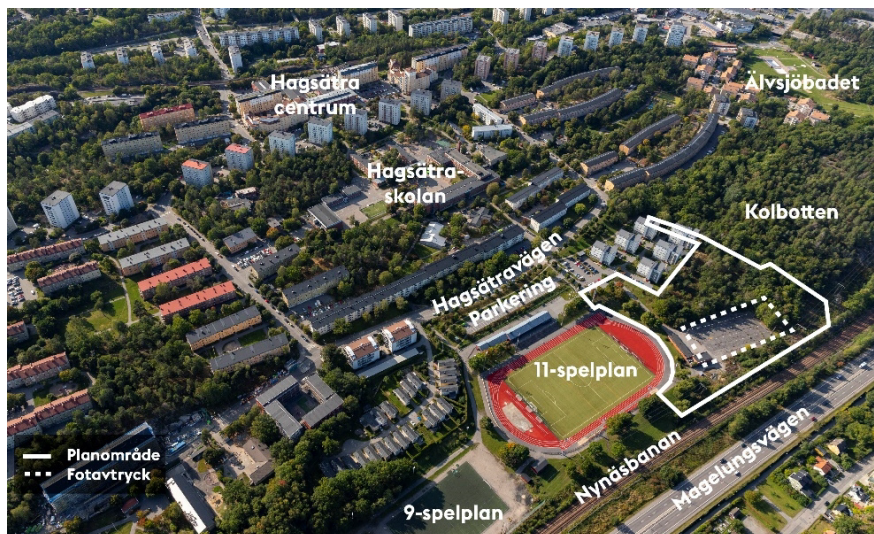
Flygbild över Hagsätra idrottsplats med planområdet inom vit linje och is- och idrottshallens placering inom vit streckad linje.