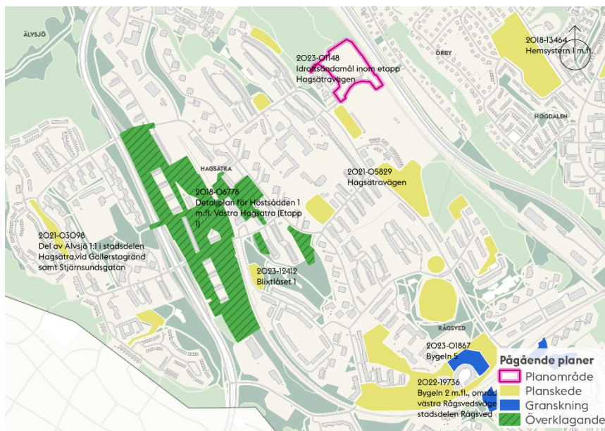
Karta som visar pågående detaljplaner och program i närområdet.