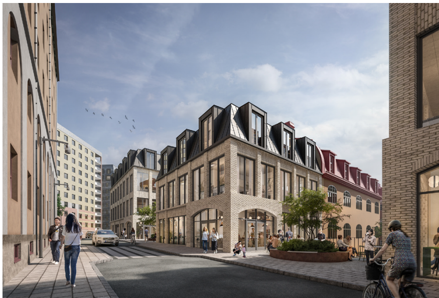
Visualisering över föreslagna byggnader mot Hälsobrunnsgatan. Mot gatan medges byggnaderna bli tre respektive fyra våningar.