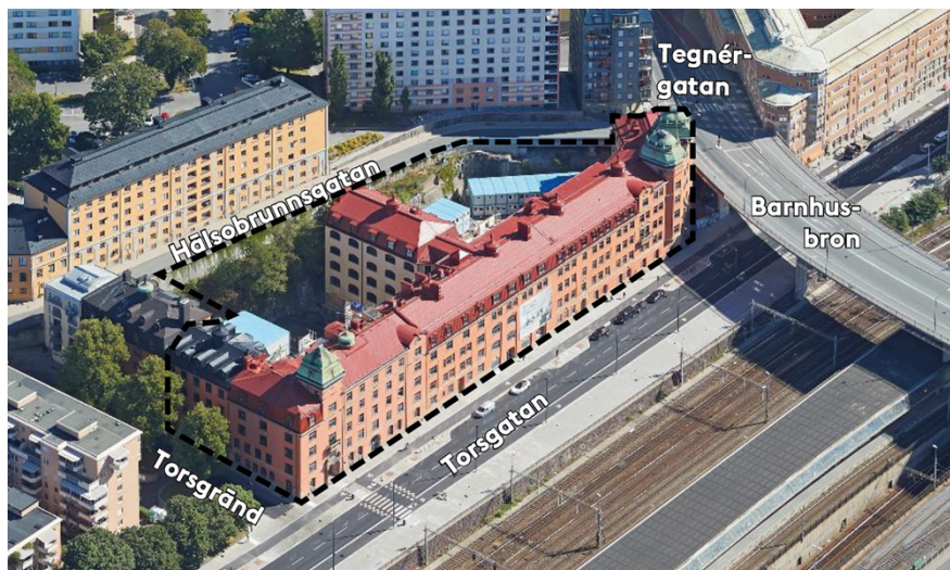
Bilden visar ett flygfotografi av befintlig bebyggelse inom kvarter Öskaret 1. Planområdet är markerat med svartstreckad linje.

Byggnaderna har ett högt kulturhistoriskt värde och är grönklassade enligt Stadsmuseets kulturhistoriska klassificering. De fem våningar höga byggnaderna utgör tillsammans med två flerbostadshus uppförda 1906 och 2008 ett halvt slutet kvarter som är tydligt förankrat i stenstaden. Byggnaderna utgör front mot spårområdet och Barnhusviken vilket gör att byggnaderna är synliga även i den stora skalan i vyer över vattenrum. Huvudbyggnaden är uppförd med en putsfasad och rött tegeltak. En byggnadskropp, verkstadsflygeln, delar av kvarterets gårdsrum i två delar. Flygeln avslutas med en brandgavel med en omsorgsfullt utformad taksiluett.