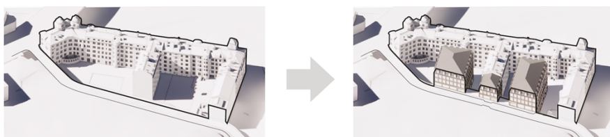
Bilden visar en schematisk skiss på kvarteret före och efter.

Takformen hämtas från befintlig byggnad som har ett mansardtak med takkupor för att kunna inreda vinden. Takplåten på de nya byggnaderna ska utföras i svart eller mörkgrå plåt för att tydligt kunna avläsas som separata volymer från huvudbyggnaden på fastigheten. Fasaden ska utföras i tegel, också för att tydligare särskiljas från huvudbyggnaden, samtidigt som tegel är ett material som inte är främmande i en äldre bebyggelsestruktur. Teglet ska vara av ljus kulör för att förbättra förutsättningarna för ljusinsläpp till angränsande bostäder.