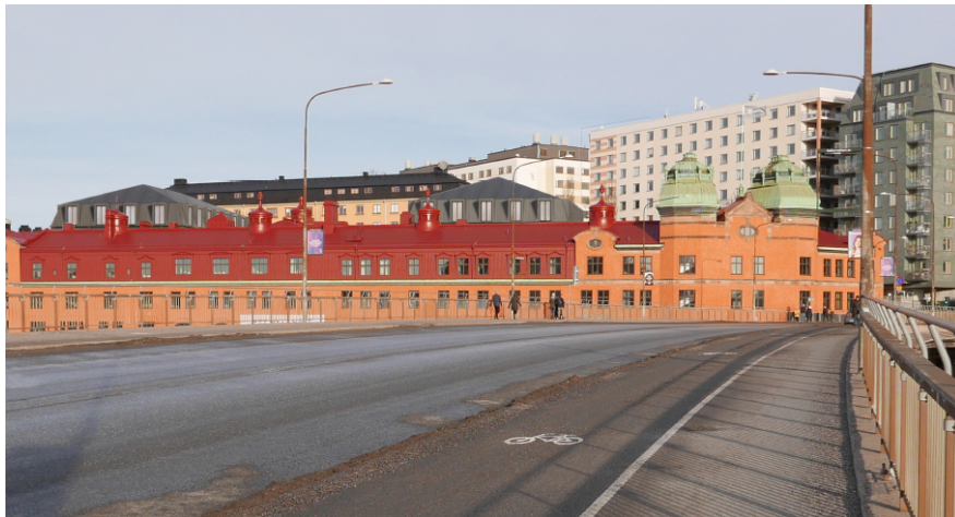
Visualisering över föreslagna byggnader från Barnhusbron. Den föreslagna bebyggelsen utgör de mörkgrå volymerna som sticker upp en våning bakom f.d. Stockholms Gas- och vattenledningsverks byggnad (rött plåttak).

kulturhistoriskt värdefulla bebyggelsen i området. Planförslaget ska hålla en hög arkitektonisk kvalitet.