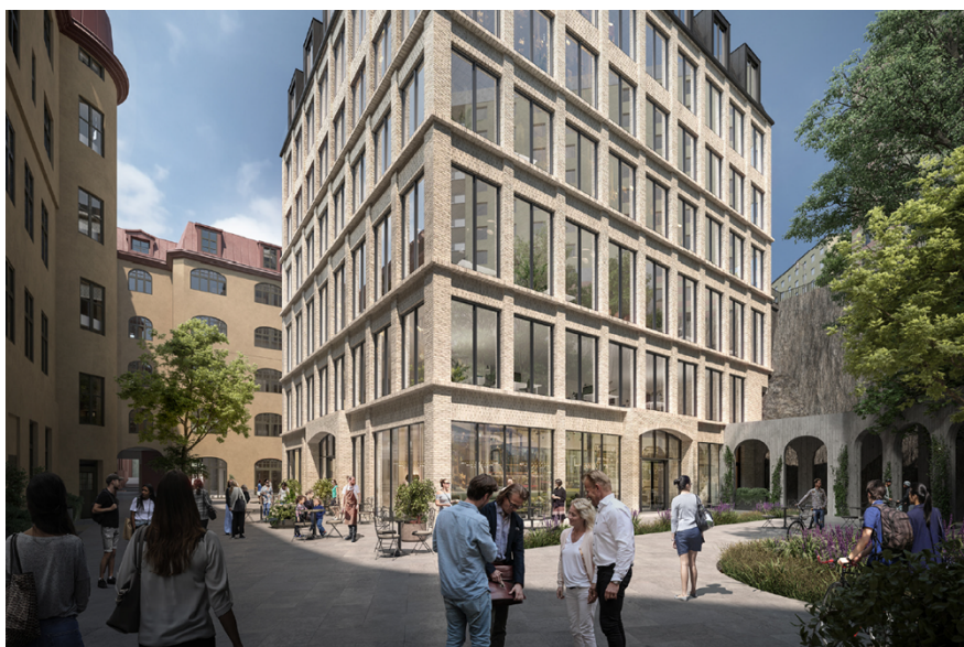
Visualisering över en av de föreslagna byggnaderna nedifrån fastighetens gårdsyta. Från gården medges byggnaderna bli max sju våningar.

De två högre byggnaderna höjer sig över befintlig bebyggelse inom fastigheten, vilket medför att den översta våningen blir synlig från vattenrum och spårområde och påverkar stadens taklandskap mot vattnet. Den nya bebyggelsen skapar stadsrum med entréer och öppna bottenvåningar längs Hälsobrunnsgatan och på kvarterets innergård. Ett par mindre platsbildningar på kvarteretsmark möjliggörs längs med Hälsobrunnsgatan för att levandegöra gatan. Bebyggelsen samspelar med stadslandskapet och den