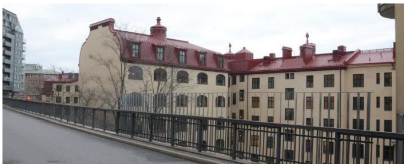
Fotografi av befintliga fasader som vetter mot Hälsobrunnsgatan med verkstadsflygeln och brandgaveln i bildens mitt.

Byggnaderna har ett högt kulturhistoriskt värde och är grönklassade enligt Stadsmuseets kulturhistoriska klassificering. De fem våningar höga byggnaderna utgör tillsammans med två flerbostadshus uppförda 1906 och 2008 ett halvt slutet kvarter som är tydligt förankrat i stenstaden. Byggnaderna utgör front mot spårområdet och Barnhusviken vilket gör att byggnaderna är synliga även i den stora skalan i vyer över vattenrum. Huvudbyggnaden är uppförd med en putsfasad och rött tegeltak. En byggnadskropp, verkstadsflygeln, delar av kvarterets gårdsrum i två delar. Flygeln avslutas med en brandgavel med en omsorgsfullt utformad taksiluett.