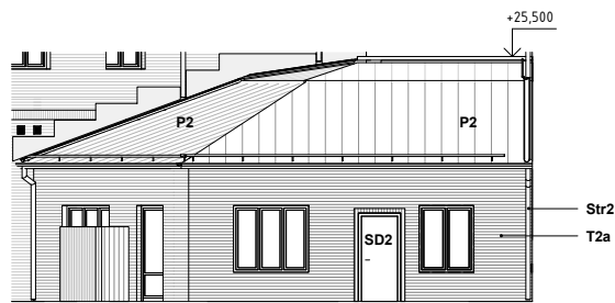
Gårdshus fasad mot öster