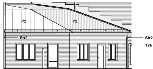
Gårdshus fasad mot sydöst