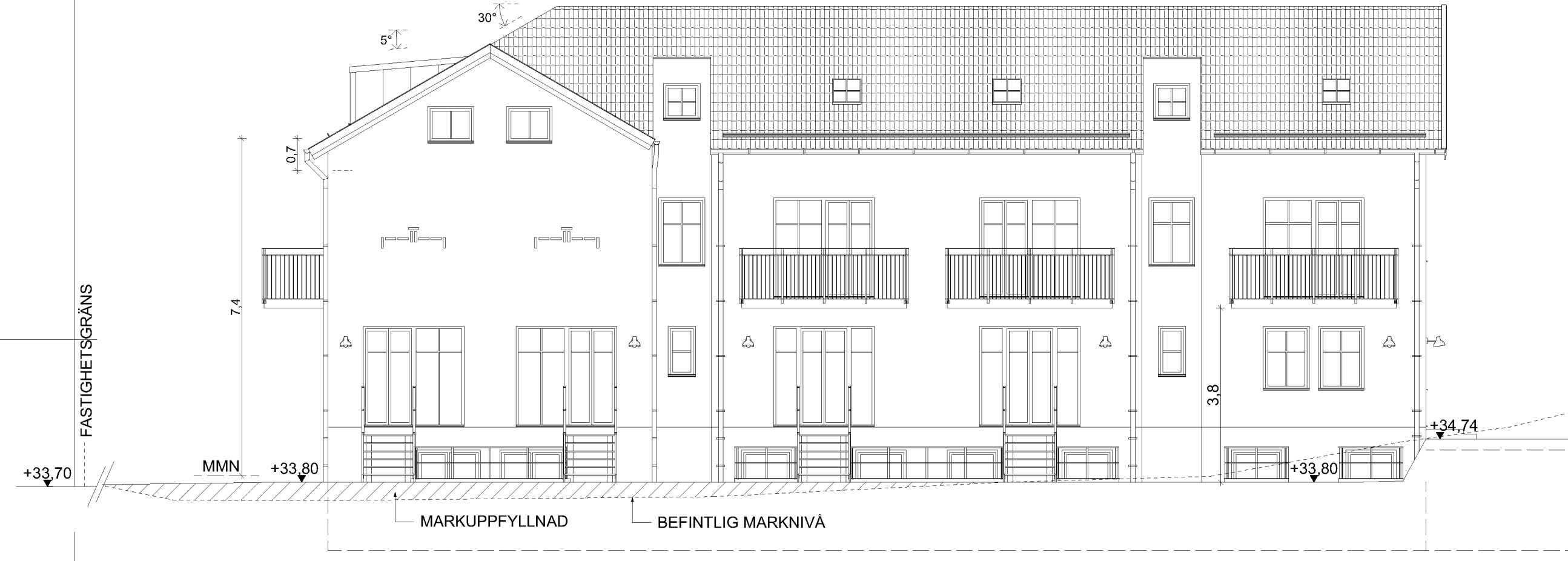
FASAD A1 MOT SÖDER