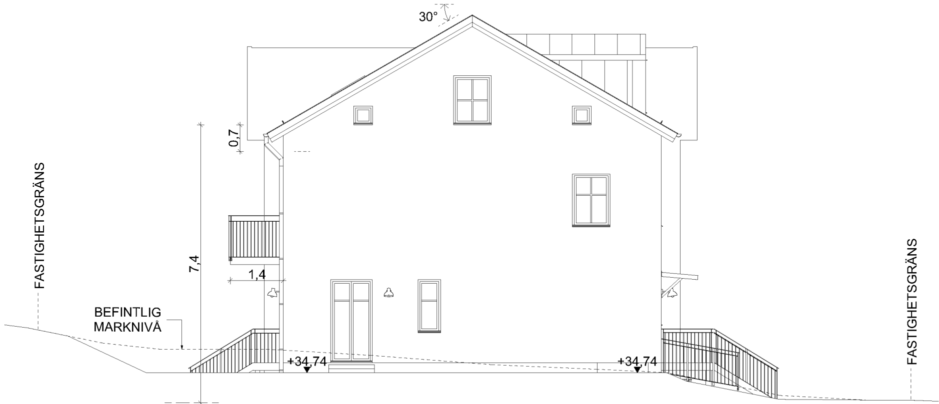
FASAD A2 MOT ÖSTER