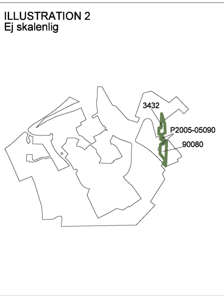
Illustration 2 visar berörda detalplaner. Ändring genom tillägg görs inom grönmarkerade områden.