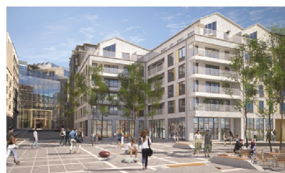
Till vänster, vy mot kvarter ett sett från Lindhagensgata (Belatchew Arkitekter). Till höger, vy mot kvarter fyra från kvarterstorget (Brunnberg och Forshed).

Mot de större gatorna, slottsparken och idrottsplatsen har kvarteren en skala om totalt åtta våningar inklusive en eller två takvåningar. Mot kvarterstorget får kvarteren en skala om fem våningar plus en indragen takvåning. Bottenvåningarna ska innehålla publika lokaler. Bostadskvarteren är slutna med relativt stora gårdar och formar tydliga gaturum och platser. För att balansera föreslagen täthet skapas ett "kvarterstorg" mellan bostadskvarteren. I kvarter tre planeras en förskola med sex avdelningar. Del av bostadsgården tas i anspråk för förskolegård.