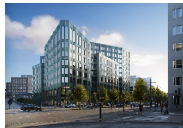
Kvarter 7 och 8: Till vänster, idrottshallen sett från idrottstorget (Vida Arkitektkontor). Till höger, kvarter 8 sett från korsningen Lindhagens- och Kjellgrensgata (Fojab Arkitekter)