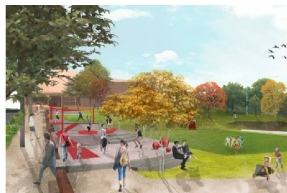
Till vänster, Parkeringshusets fasad under Essingeleden (Wåhlin Arkitekter). Till höger, Ekparken (Nivå Landskapsarkitektur).