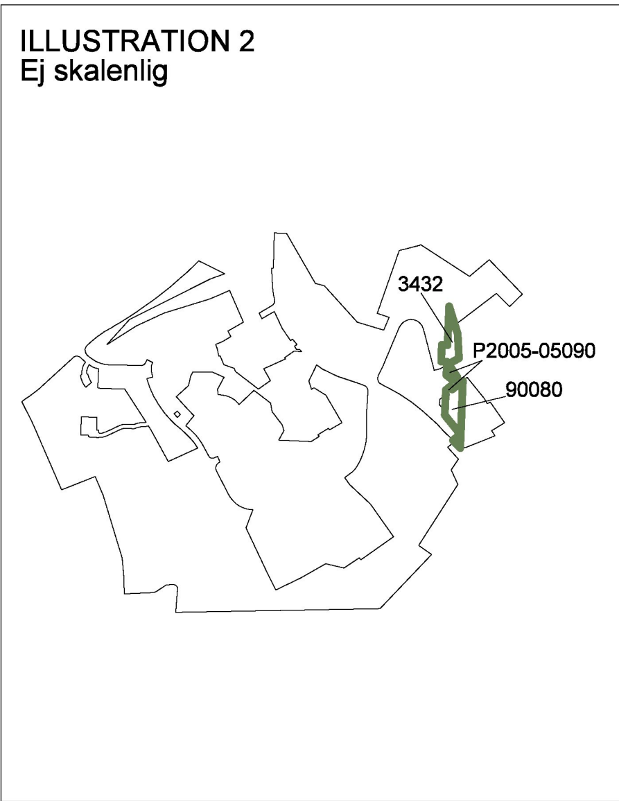
Illustration 2 visar berörda detalplaner. Ändring genom tillägg görs inom grönmarkerade områden.