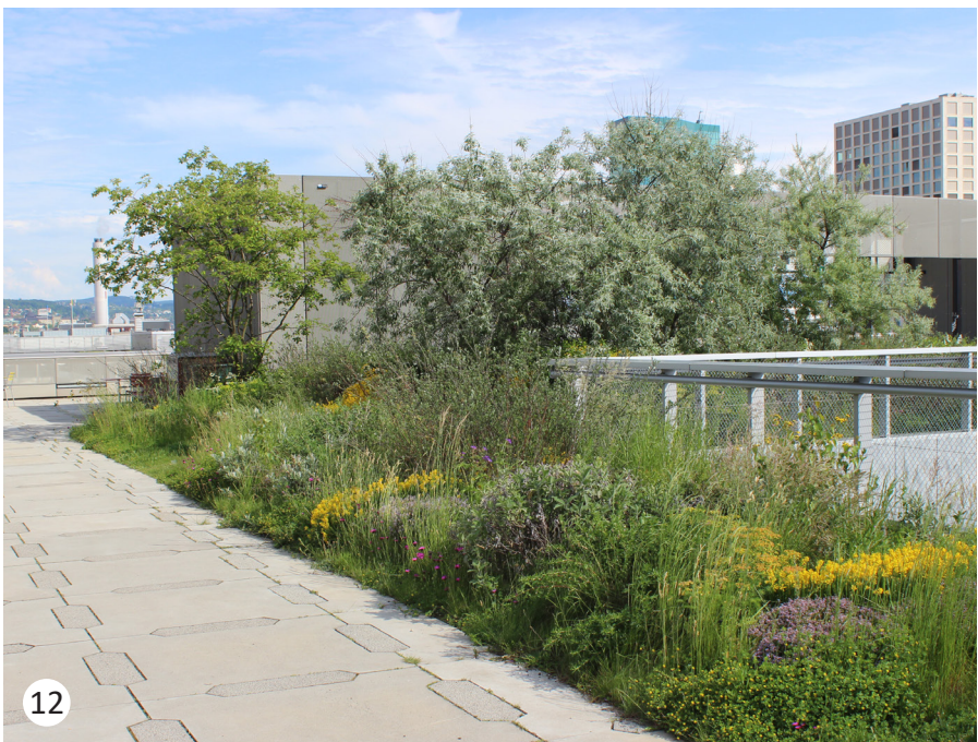
1. I slänten mot Klarahusets trädgård anläggs ängsmark. 2. Längs med förgårdsmarken i söder anläggs planteringar med buskar och perenner. Växtbäddarna är nedsänkta för att ta hand om dagvatten från gångbanan. 3. Den forna gasklockans läge markeras med en avvikande fris i markbeläggningen. 4. Torgets markbeläggning utgörs av granithällar. 5. Sittmurar i granit med träsits omgärdar torget. 6. Förskolegården omgärdas av en lekfull slinga. 7. Gläntor med tippi på förskolegården för lugn lek. 8. Regnbädden bidrar med upplevelsevärden genom spängerna över den nedsänkta växtligheten. 9. Stödmur mot allmän plats i norr utförs i granit, bild visar liknande mur i området. 10. Pergolas och pergolagångar med klättrerväxter på gården erbjuder skugga. 11. Ett lekfullt sätt att använda en stödmur på förskolegården. 12. Förslag på växtlighet i rabatter vid torget.