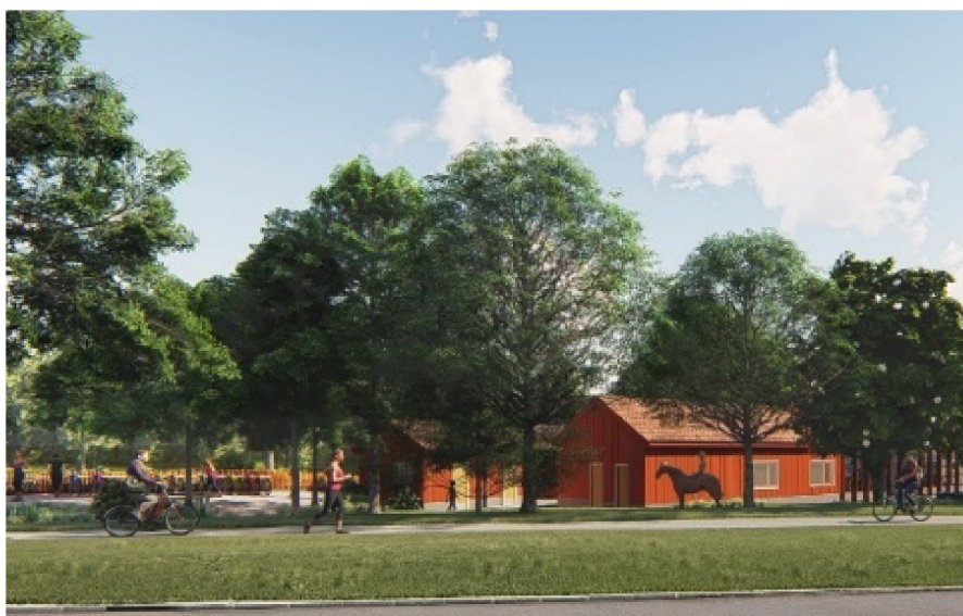
Vy från korsningen Bägerstavägen.