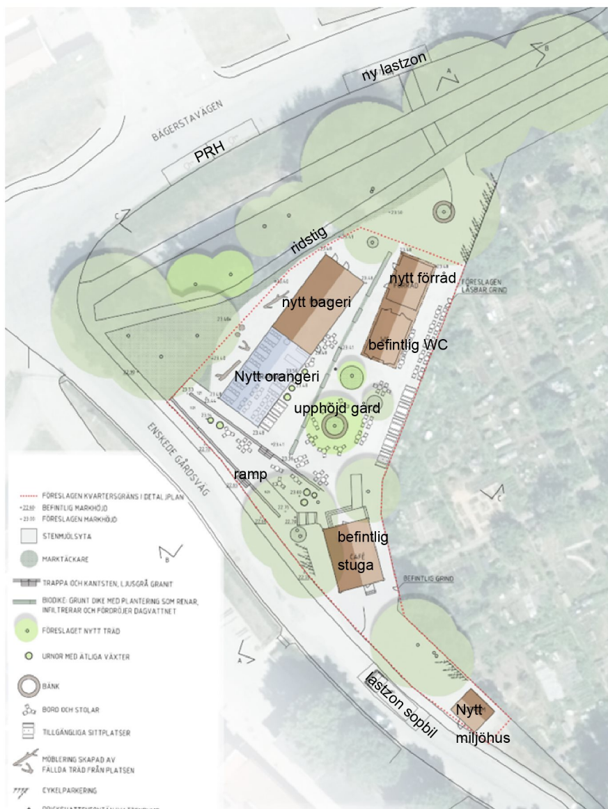
Illustrationsplan från samrådet (Horn, Uggla och HMXV)