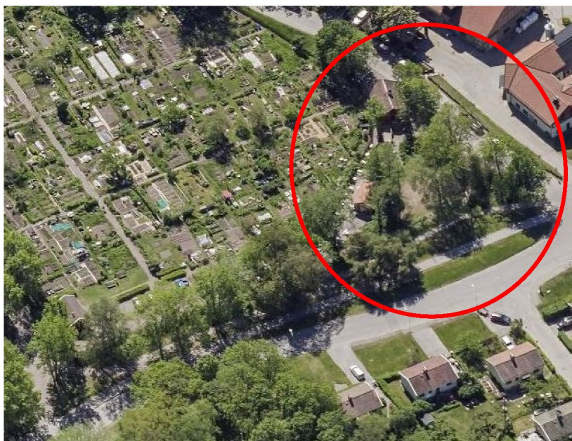
Snedbild över planområdet från väster.