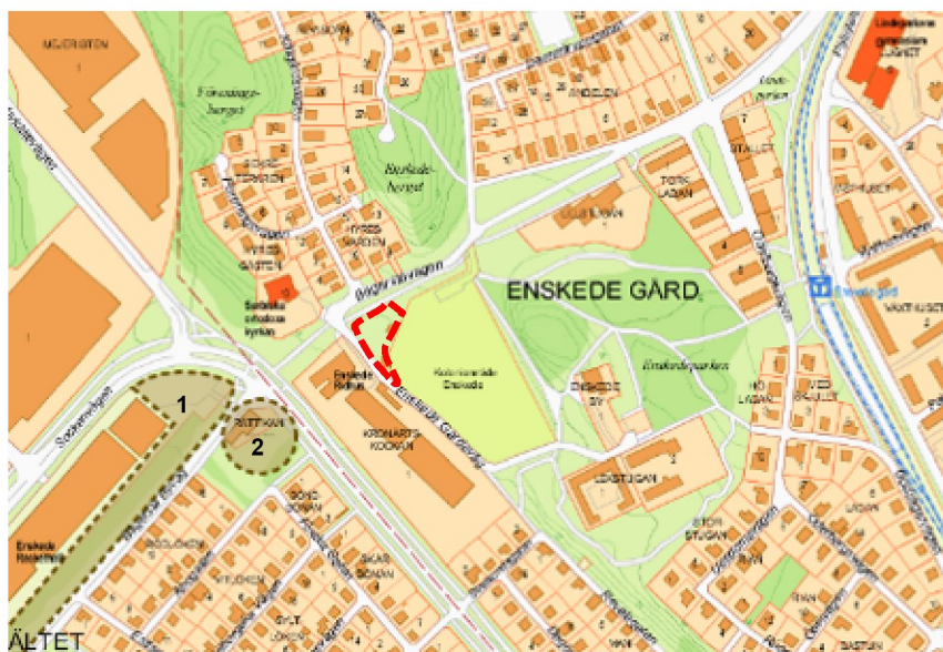
Karta som visar planområdets preliminära läge (röd streckad linje) samt pågående detaljplaner i närområdet (1 Dp Bägersta Byväg, 2 Dp Rättikan 1).