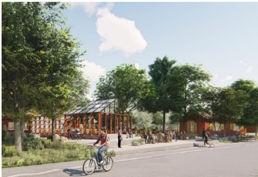
Vy från korsningen Enskede Gårdsväg/ Bägerstavägen från samrådet. (Illustrationer HMXW arkitekter)