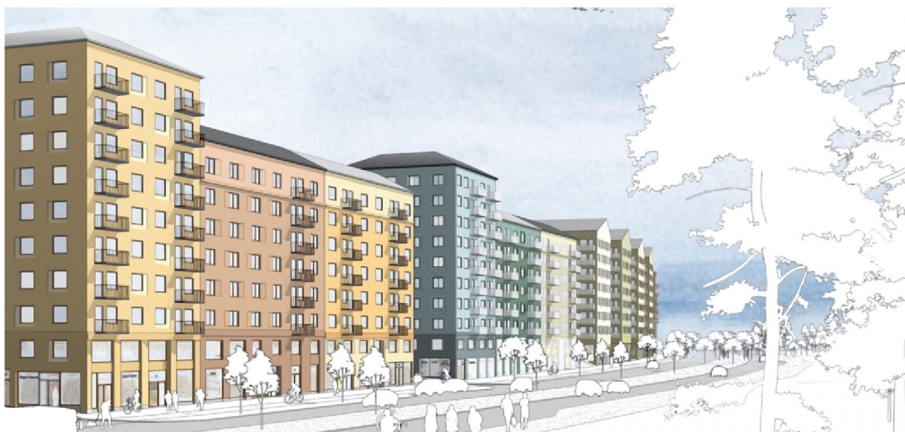
Perspektiv från Hanstavägen söderut. Hanstavägen får en stor andel lokaler och en hög variation. Bild Reflex Arkitekter.