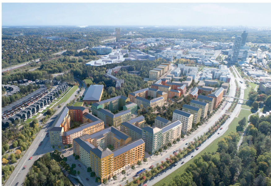
Flygbild över planerad bebyggelse sett mot Kista verksamhetsområde. Bild: Reflex Arkitekter/Ripellino Arkitekter.

Parkering anordnas i underjordiska garage samt i ett parkeringshus som inryms i den tidigare serverhallen i anslutning till kontorsanläggningen. Projektspecifikt parkeringstal är 0,54 med möjlighet att sänka parkeringstalet till 0,4 med ambitiösa mobilitetsåtgärder.