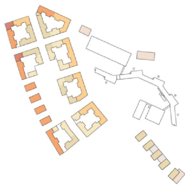
Princip för våningsantal.

Utgångspunkten i förslaget är att skapa en variation inom en sammanhållen helhet och en tydlig kvarterstruktur med orienterbarhet och förutsägbarhet. Bebyggelseskalan hålls samman genom ett medvetet förhållningssätt till omgivande gaturum. Högre mot de storskaliga stadsgatorna och lägre mot områdets mitt och lokalgatorna. Variationen består i att trapphusenheterna ska ges en egen gestaltning utifrån byggnadskomponenter, material och färgsättning. En regelbunden variation i hur takfoten hanteras skapar en rytm i fasaden och bidrar med ett ytterligare lager till att särskilja trapphusenheterna. Den trapphusvisa variationen är bärande för arkitekturen och regleras i plankartan.