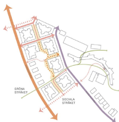
Princip för gatustruktur och kopplingar

Gatorna inom planområdet följer omgivande struktur och tillför öst-västliga tvärstråk för att tydliggöra områdets kopplingar till Husby och Kistahöjden. Gatorna kopplar på, kompletterar och förstärker det befintliga gatunätet. Hanstavägen och Kista alléväg utformas som stadsgator med förbättrade vistelsevärden och en rad tvärstråk etableras för att stärka kopplingarna över Hanstavägen till Husby. Tvärstråken möjliggör en fortsättning i en framtida struktur på andra sidan Hanstavägen.