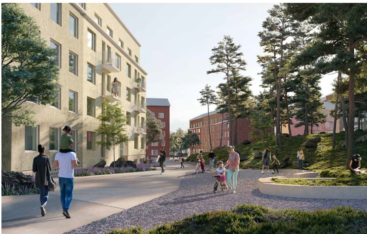
Perspektiv från gångfartsområdet och kvartersparken. Bebyggelsen i områdets mitt får en lägre skala med indragen översta våning. Bild: Reflex Arkitekter.