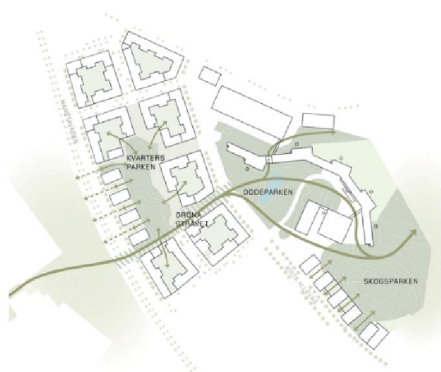
Princip för parker och ekologiska samband.

IBMs tidigare huvudkontor får en ökad användning som förutom kontor tillåter bostäder, förskola, centrumverksamhet och besöksanläggning. Upplevelsen av att kontorsbyggnaden är inplacerad i ett skogslandskap ska i stora delar bevaras och stärkas genom att två nya parker etableras i anslutning till byggnaden. Byggnaden öppnas upp mot nya allmänna platser, såsom torget vid den tidigare matsalen och motionshallen. Torget ramas in av ny bostadsbebyggelse utmed Kista alléväg. Serverhallen görs om till parkeringshus med utgångspunkt i dess kulturhistoriska värden. I övrigt tillåts uppförande av en förskola och en byggnad med blandat innehåll mot Lagtingsgatan. Befintliga byggnader förses med rivningsförbud och bevarandebestämmelser som ska säkerställa att byggnaden varsamt kan omvandlas för att rymma det nya innehållet.