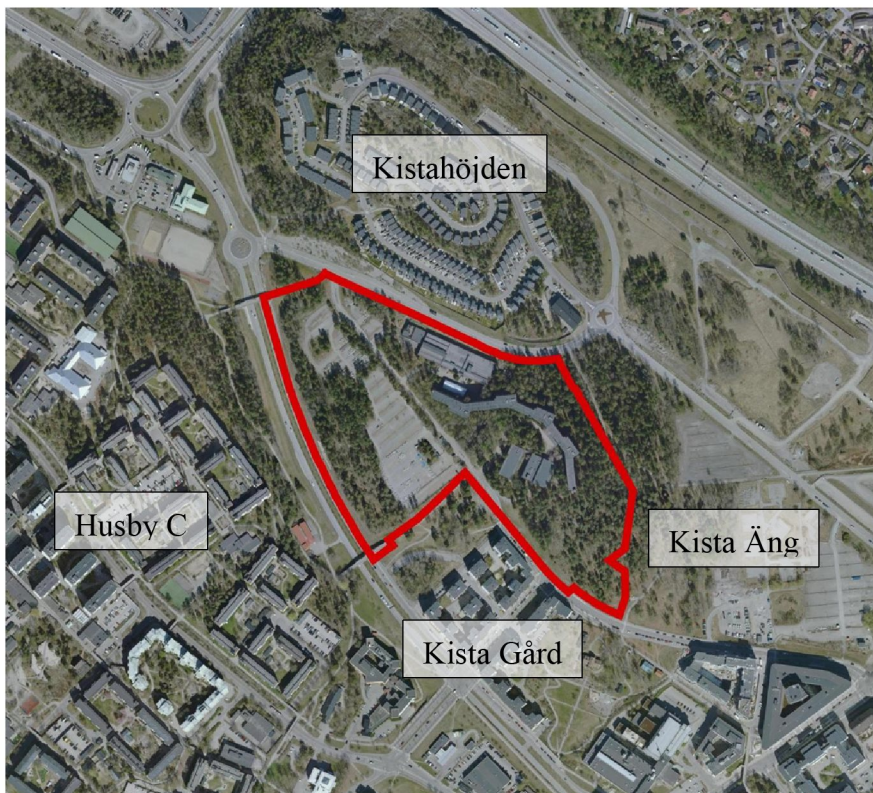
Flygbild över norra Kista och delar av Husby med planområdet inom röd markering.

Planområdet präglas av de befintliga kontorsbyggnaderna och av den varierande växtlighet som omger kontors- och parkeringsanläggningarna. Mest påtagligt är de större sammanhängande skogsområdena. Tre bostadsområden i olika stadier av utbyggnad angränsar planområdet. Kistahöjden norr om Lagtingsgatan innehåller småhus och radhus, Kista Gård i söder omfattar sammanlagt sex bostadskvarter som är delvis färdigställda och Kista Äng i sydost med planer på blandad stadsbebyggelse i rutnätsstruktur.