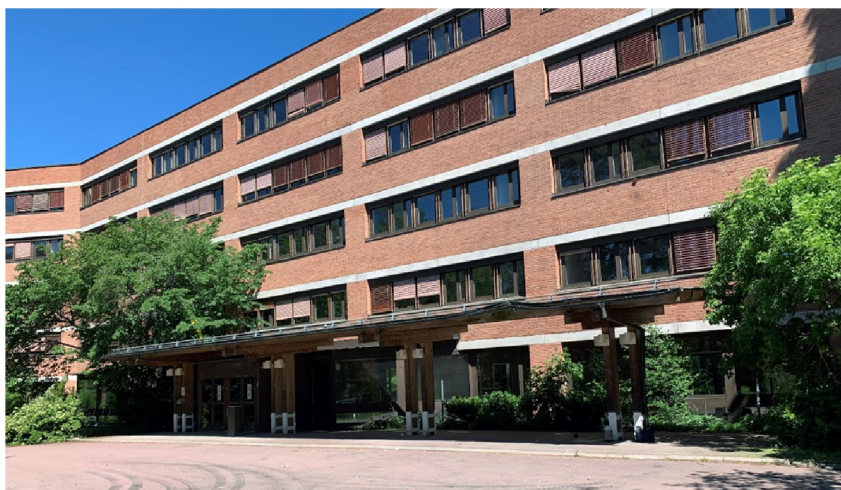
Huvudentré till kontorsbyggnaden.

motsvarar fordringarna för byggnadsminnen i kulturminneslagen. En kulturhistorisk konsekvensbeskrivning har tagits fram för att beskriva det kulturhistoriska värdet i relation till planförslaget.