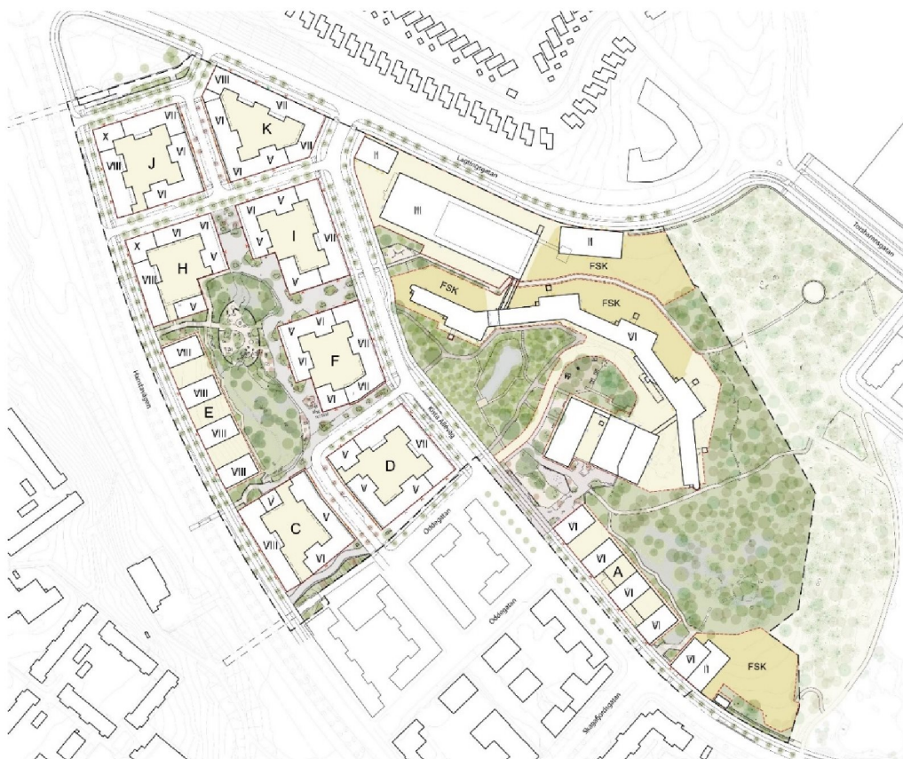
Illustrationsplan över planområdet med beteckning för respektive kvarter, våningsantal och placering av förskolor. Bild Land Arkitektur.