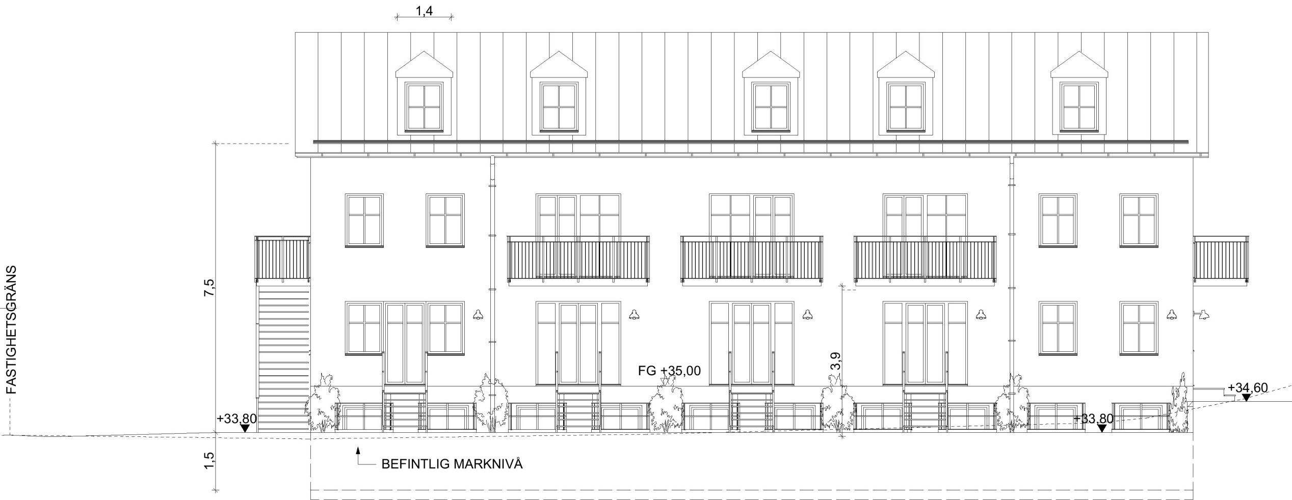
FASAD A1 - MOT SÖDER