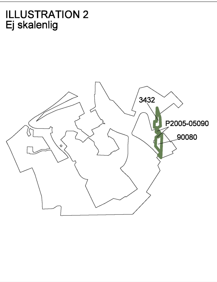
Illustration 2 visar berörda detalplaner. Ändring genom tillägg görs inom grönmarkerade områden.